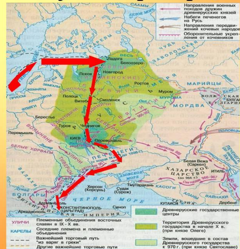
Торговый путь «из варяг в греки».

12. Выделите две причины успехов норманнов? (П)