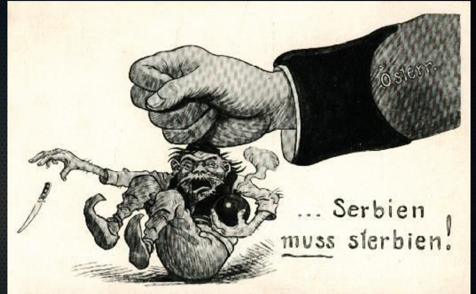
Австрийская карикатура «Сербия должна погибнуть»

Действия Николая II вызвали недовольство русского военного руководства. Генеральный штаб никогда не разрабатывал вариантов частичной мобилизации против Австро-Венгрии, попытка осуществить такую меру привела бы к неразберихе, грозившей сорвать имевшиеся планы общей мобилизации против австро-германского блока.