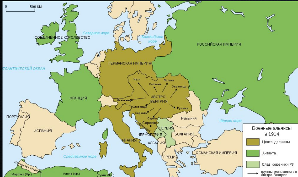
Военные альянсы в Европе в 1914 г.

10 июля 1914 г. Австро-Венгрия предъявила Сербии ультиматум, угрожая в случае его отклонения войной.