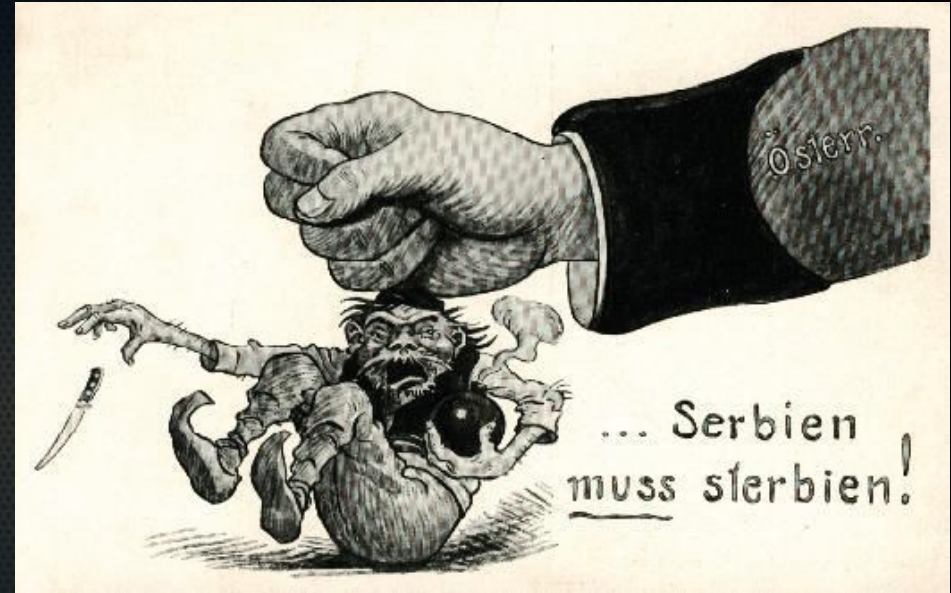
Австрийская карикатура «Сербия должна погибнуть»

Действия Николая II вызвали недовольство русского военного руководства. Генеральный штаб никогда не разрабатывал вариантов частичной мобилизации против Австро-Венгрии, попытка осуществить такую меру привела бы к неразберихе, грозившей сорвать имевшиеся планы общей мобилизации против австро-германского блока.