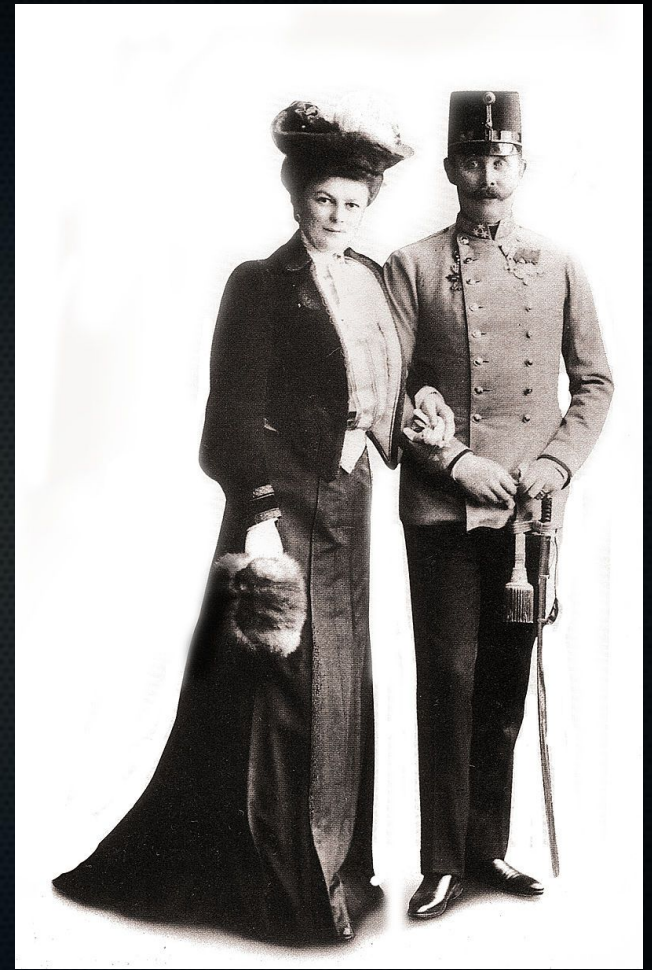
Франц Фердинанд и София

В Вене немедленно обвинили сербские власти в пособничестве участникам покушения и считали, что найден хороший предлог для окончательной расправы с Сербией.