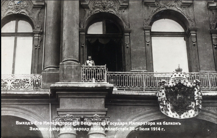
Выходъ Его Императорскаго Величества Государя Императора на балконъ Зимняго дворца къ народу послѣ молебствія 20-го Юля 1914 г.

Николай II объявляет о начале войны с Германией с балкона Зимнего дворца