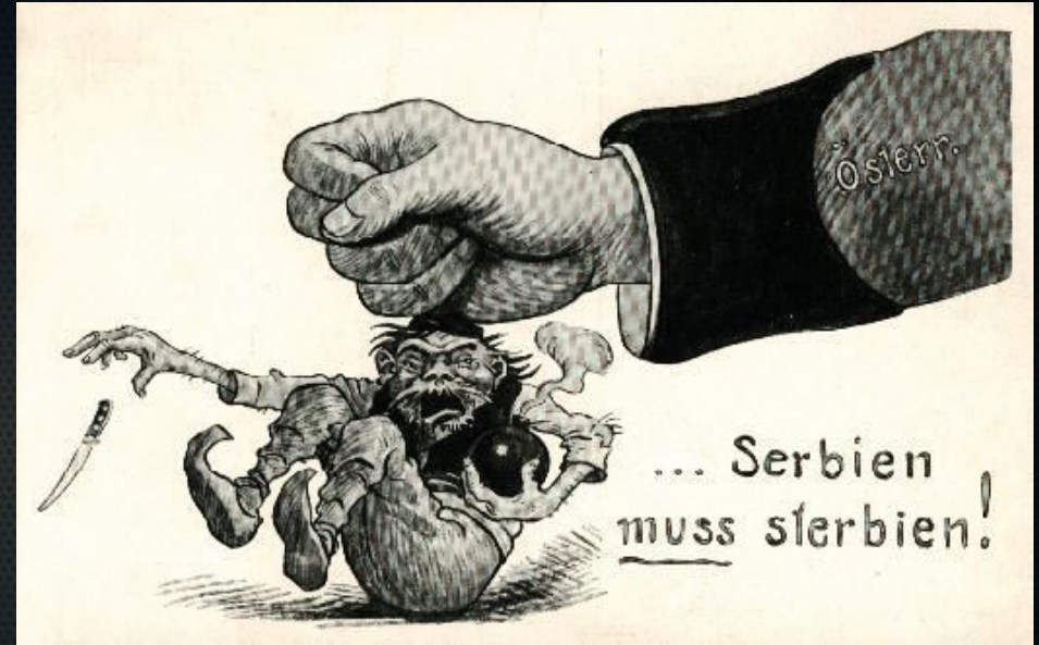
Австрийская карикатура «Сербия должна погибнуть»

Действия Николая II вызвали недовольство русского военного руководства. Генеральный штаб никогда не разрабатывал вариантов частичной мобилизации против Австро-Венгрии, попытка осуществить такую меру привела бы к неразберихе, грозившей сорвать имевшиеся планы общей мобилизации против австро-германского блока.