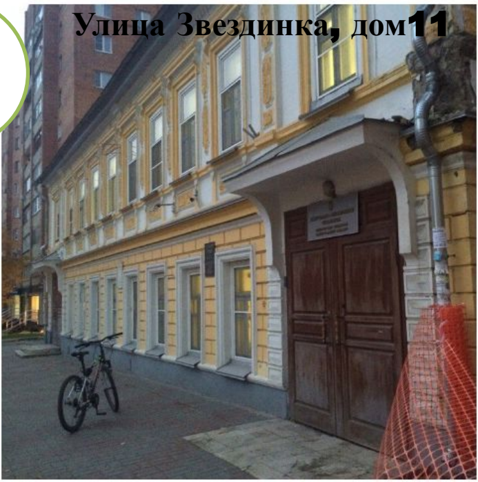
Улица Звездинка, дом 11