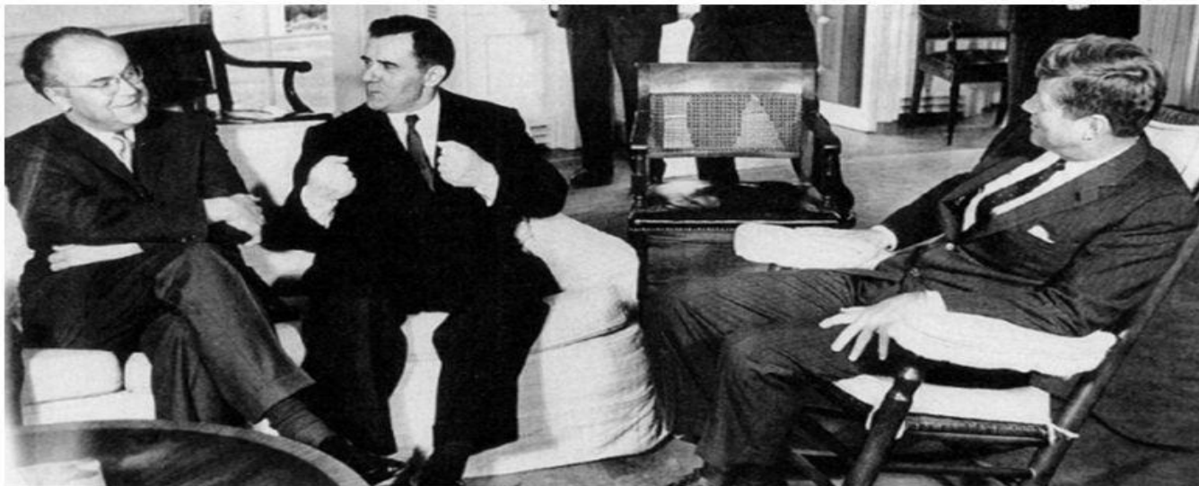
18 октября 1962 г., Белый Дом. Посол СССР в США Анатолий Добрынин (слева), министр иностранных дел СССР Андрей Громыко (в центре), президент США Джон Кеннеди (справа)