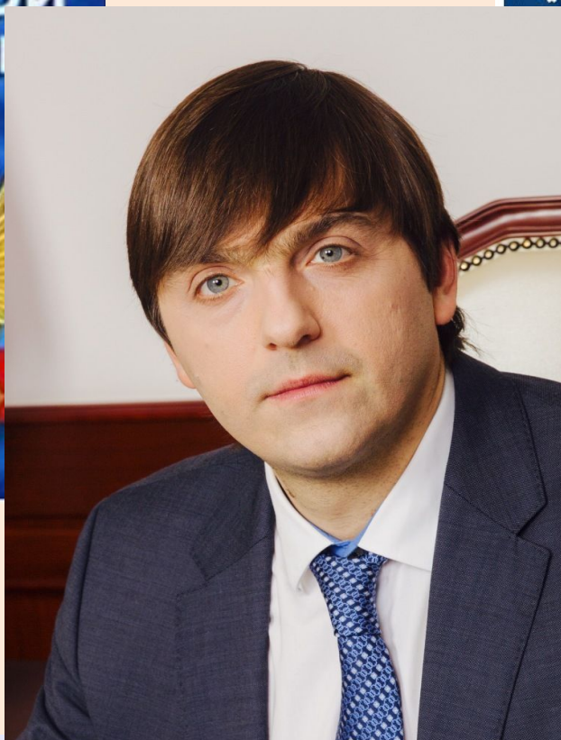
Министр просвещения Российской Федерации Кравцов Сергей Сергеевич