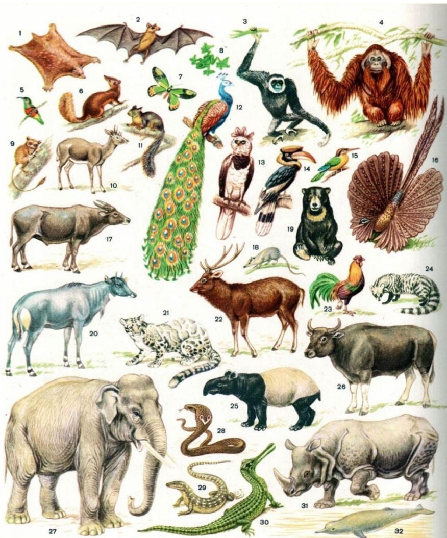
Характерные представители фауны Индо-Малайской области: 1 — шерстокрыл; 2 — летучая лисица; 3 — гиббон лар; 4 — орангутан; 5 — короткохвостая лекстрицида; 6 — тулайя тана; 7 — паурусник Виктории; 8 — летающая лягушка; 9 — долгопят; 10 — четырёхрогая антилопа; 11 — индийская тигристая белка; 12 — павлин; 13 — гартия; 14 — птица-носорог; 15 — зимородок гуриал; 16 — фазан аргус; 17 — карликовый буйвол; 18 — гимнура; 19 — малайский медведь; 20 — антилопа нильгау; 21 — дымчатый леопард; 22 — замбар; 23 — банкивский петух; 24 — малайская виверра; 25 — индийский тапир; 26 — бангтенг; 27 — индийский слон; 28 — кобра; 29 — полосатый варан; 30 — гавиал; 31 — индийский носорог; 32 — речной дельфин гангский сусук.

Млекопитающие Индо-Малайской области включают 46 семейств, пять из них - сумчатые и однопроходные - встречаются только в Папуасской подобласти, представляя здесь австралийский элемент. Эндемичных же семейств всего четыре.