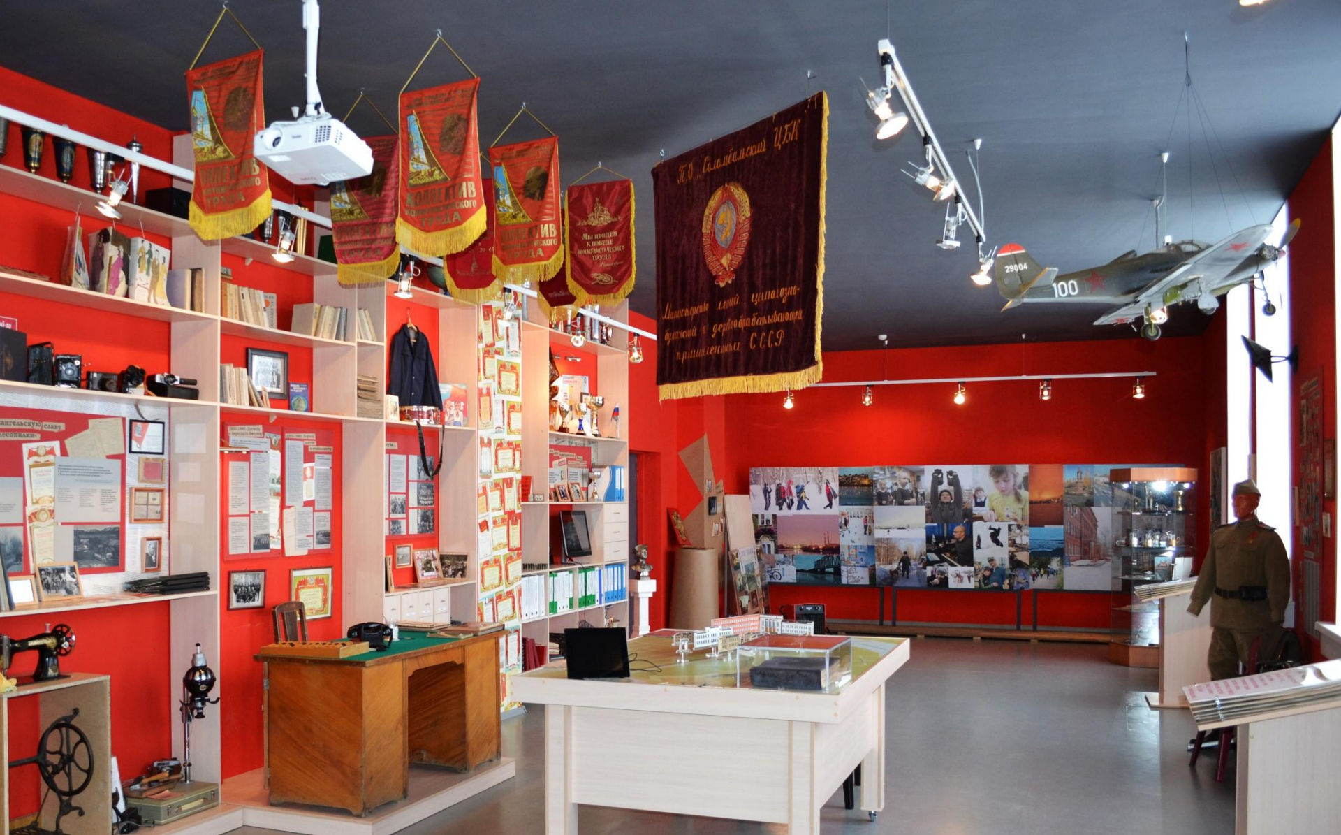
Культурно-выставочный комплекс «История поселка Первых Пятилеток»