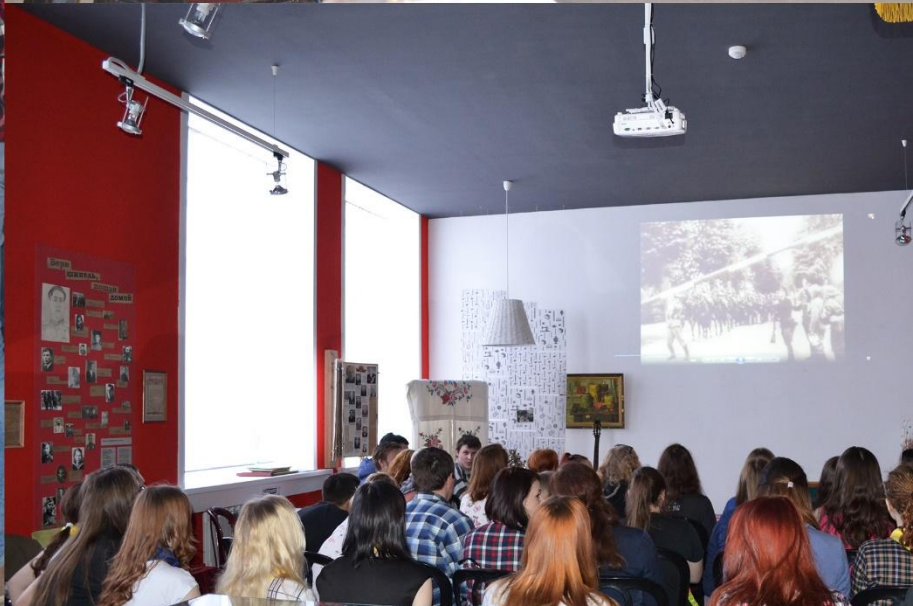
Интеллектуальная игра для студентов «Кинобитва»