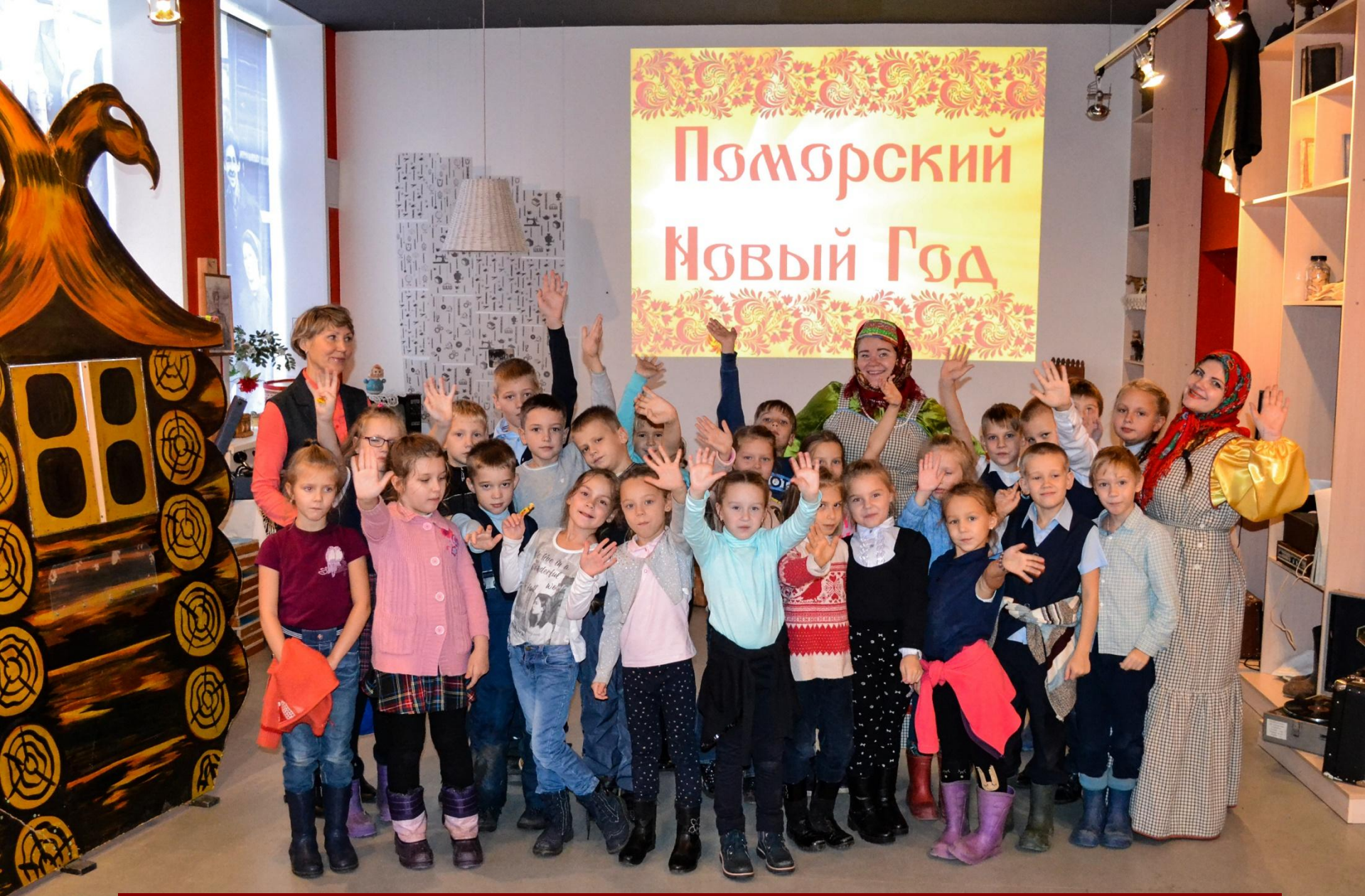
Интерактивная программа «Мы - поморы»