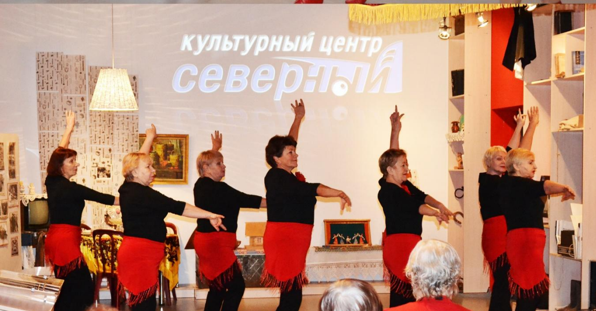
Выступления коллективов «КЦ Северный»