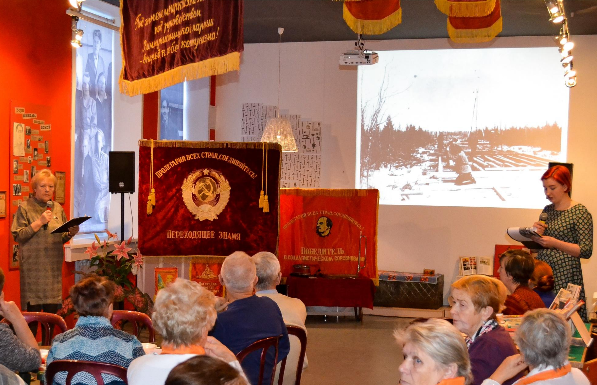
Творческий вечер, посвященный 100-летию Комсомольской организации