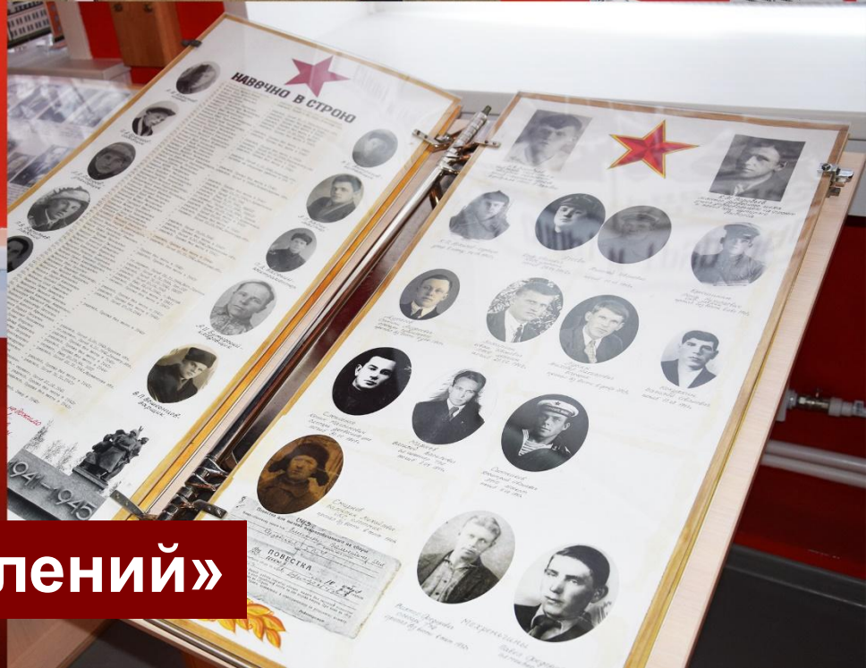
Экскурсия «Память поколений»