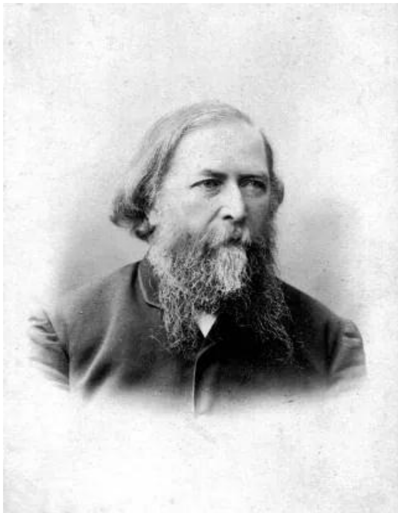
Николай Васильевич Верещагин

В 1870 г. Николаю Васильевичу Верещагину пришла идея о создании новой разновидности сливочного масла.