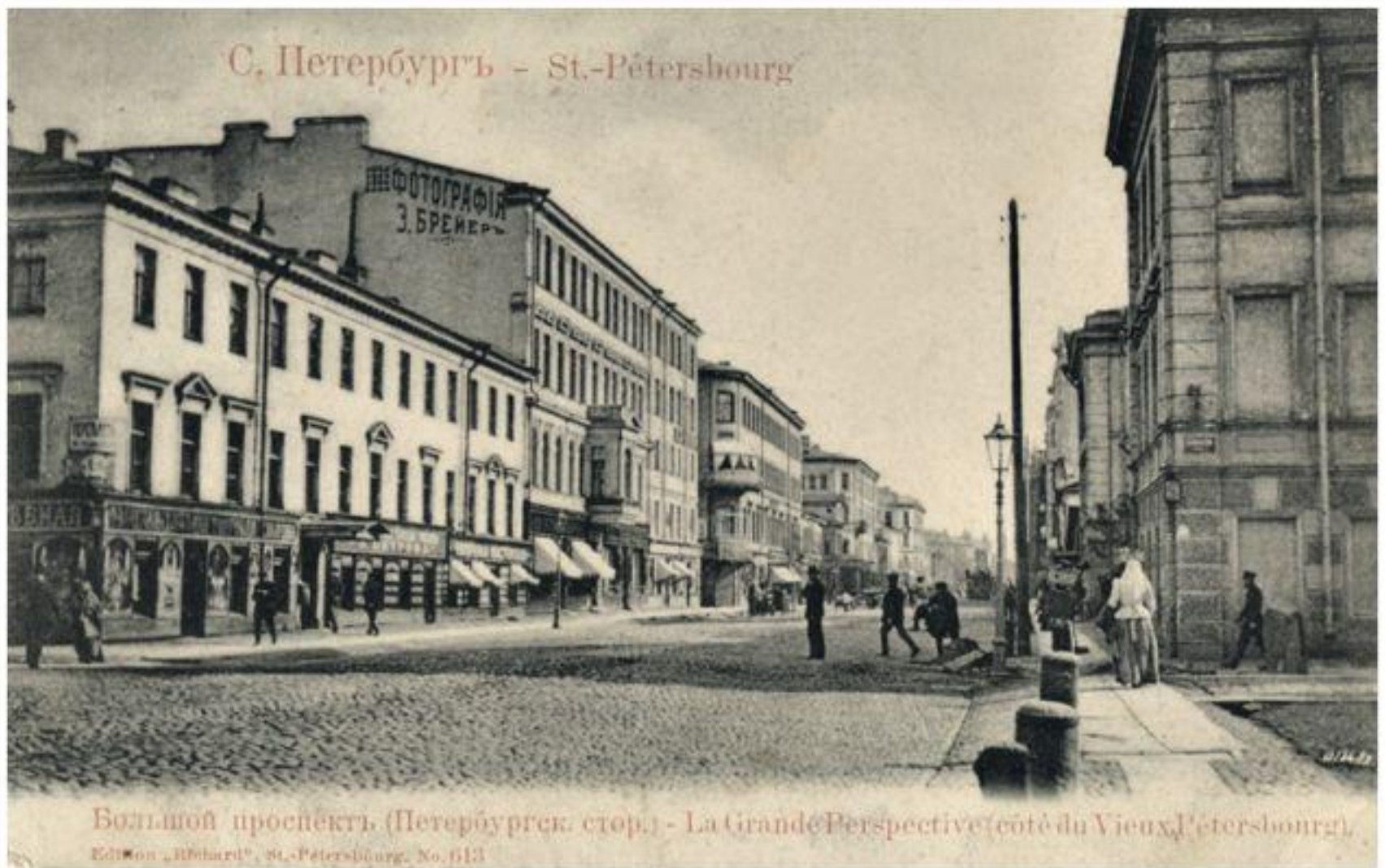
Большой проспект (Петербургск. стор.) - La Grande Perspective (côté du Vieux-Petersbourg).

Ed. Mon. «Hilbard», St.-Petersbourg, No. 613