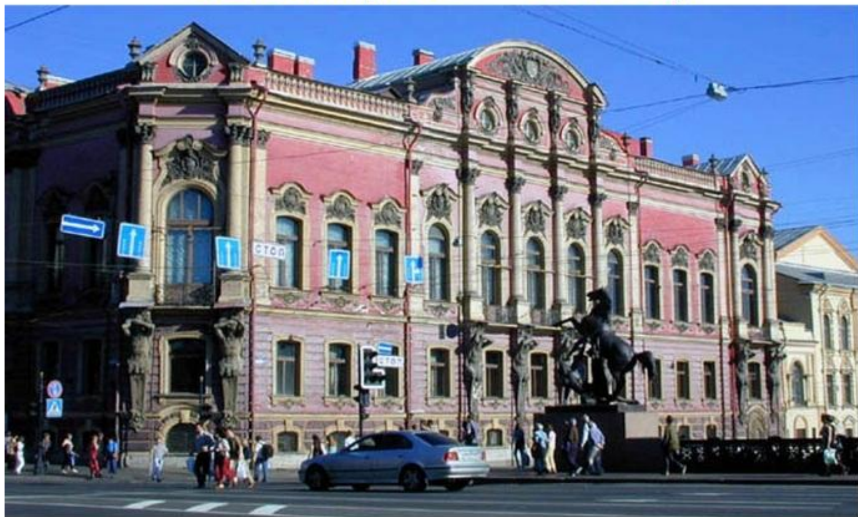
Частный дом-дворец Белосельских-Белозерских в Санкт-Петербурге