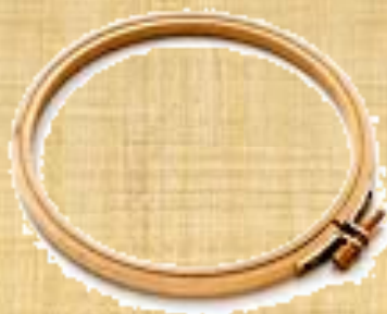
деревянные пяльцы с металлическим винтом