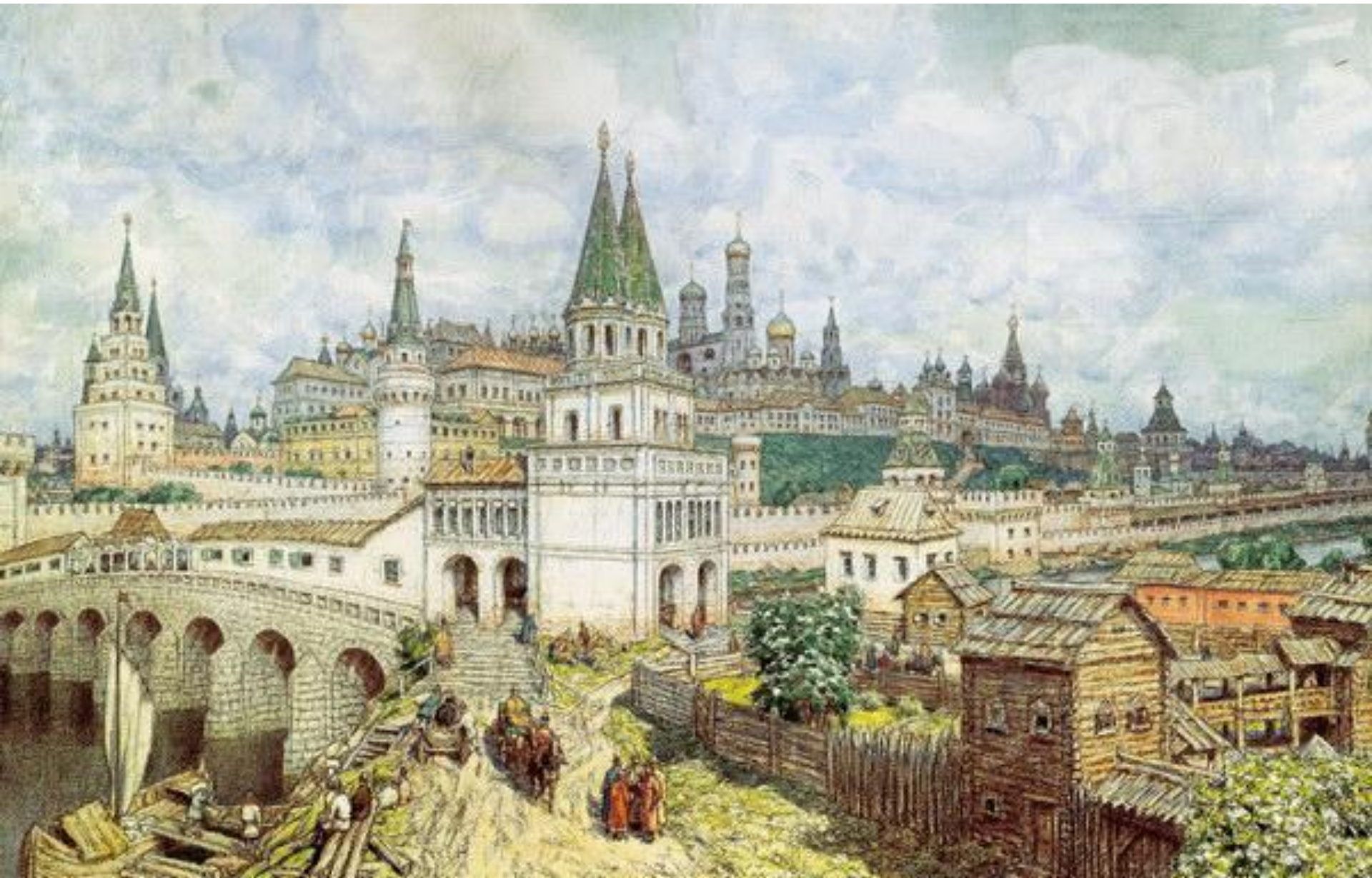
Московский Кремль XVI — XVII вв.