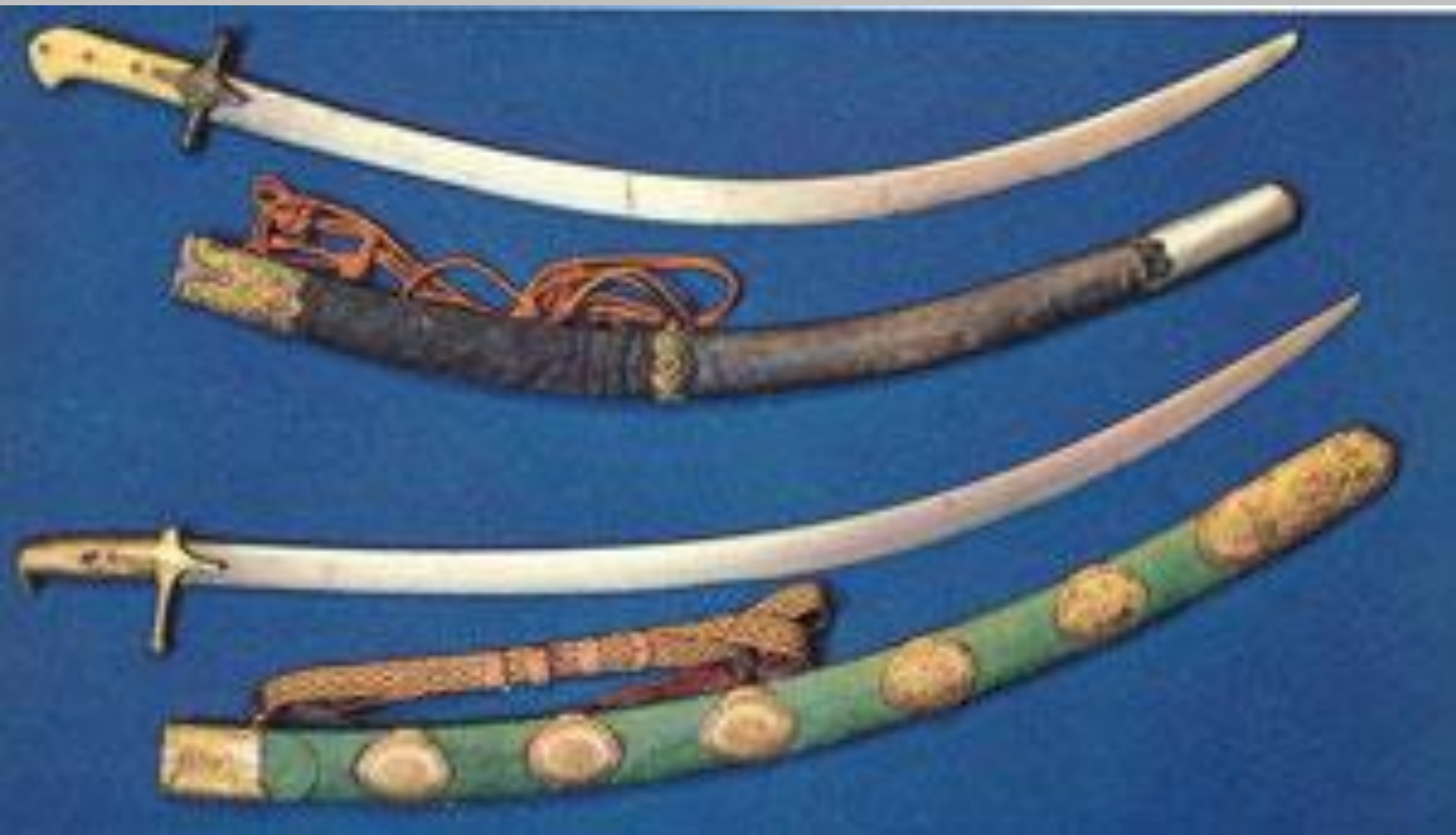
Сабли Минина и Пожарского