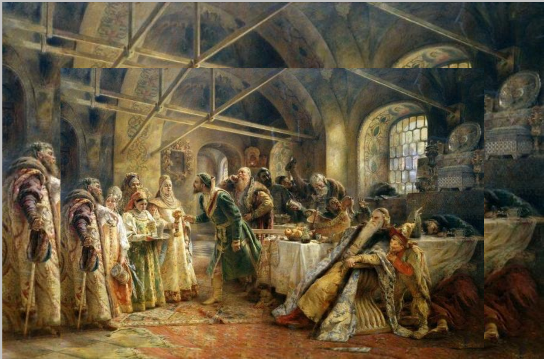
К.Маковский «Минин на Нижегородской площади»