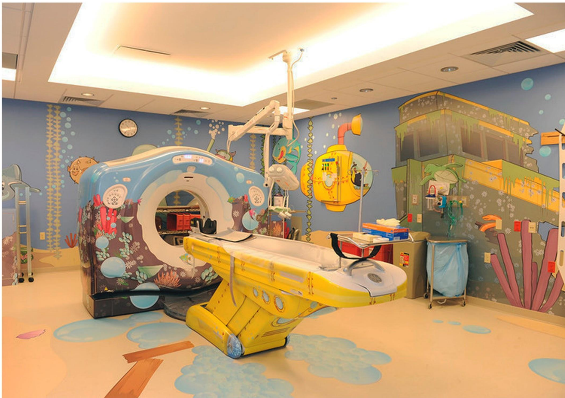
Кабинет томографии Nationwide Children's Hospital, Коламбус, Огайо