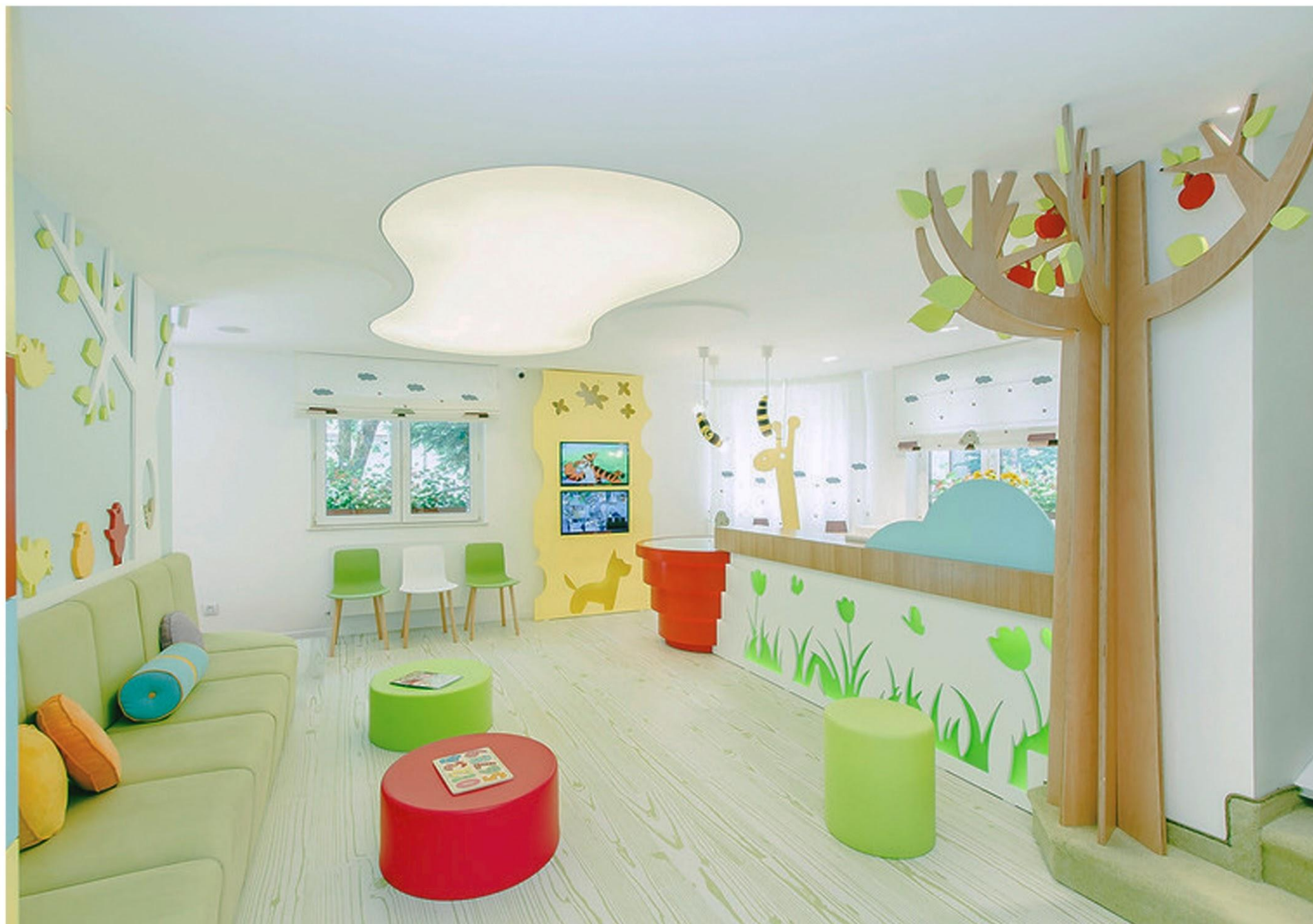
Приёмная и комната ожидания в детской стоматологической клинике