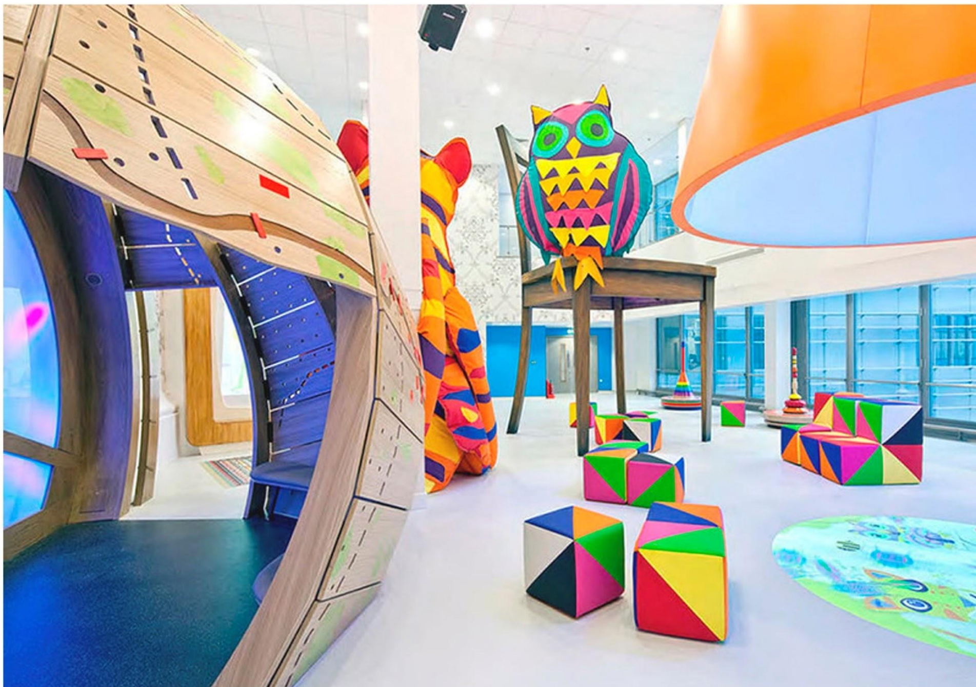
Холл ожидания одной из детских клиник в Мексике