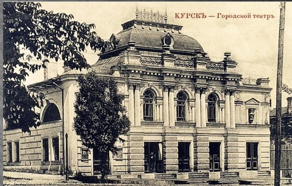
КУРСКЪ — Городской театръ