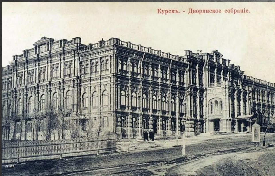
Курскъ. - Дворянское собраніе.