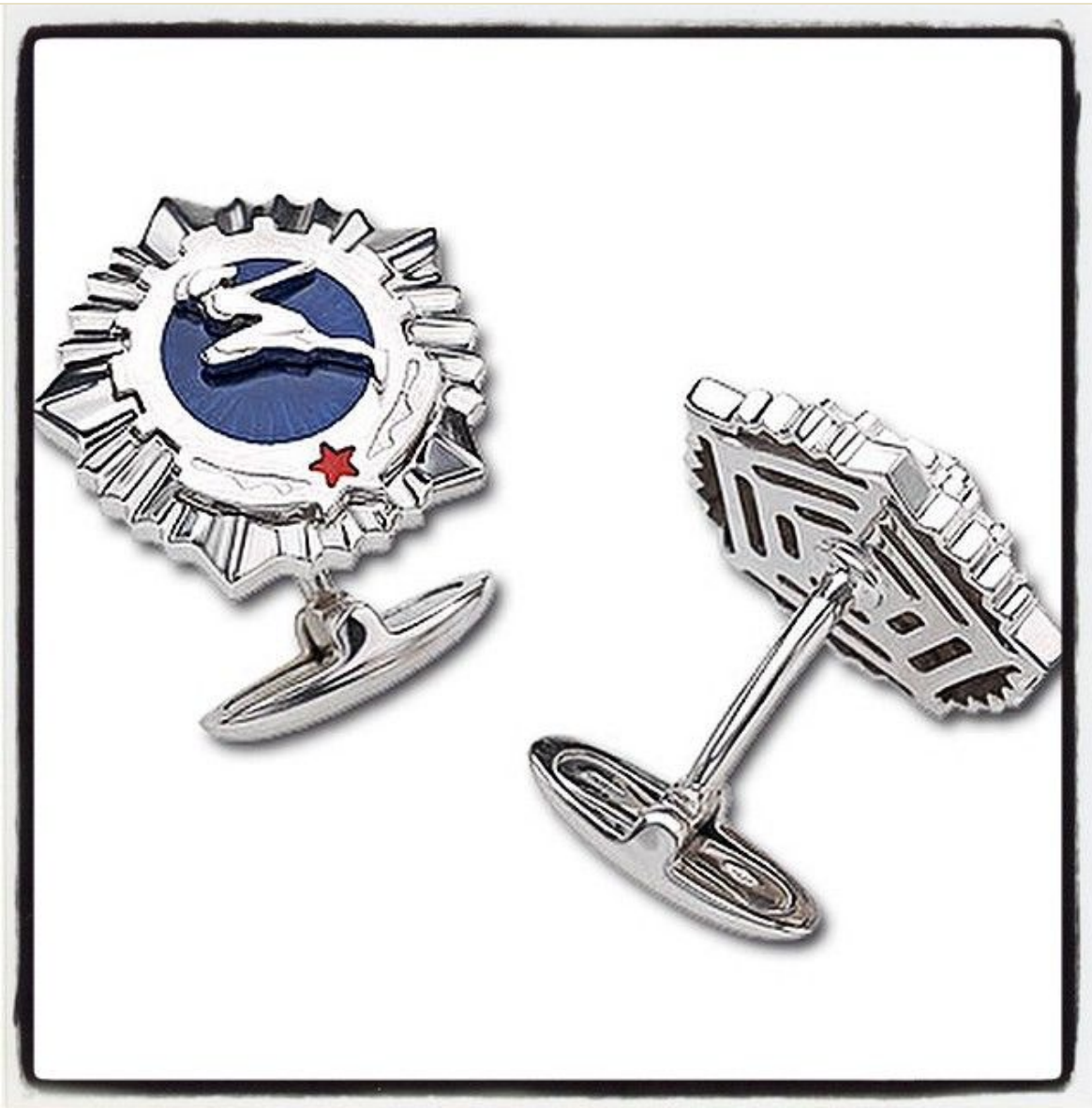
Запонки 20 век