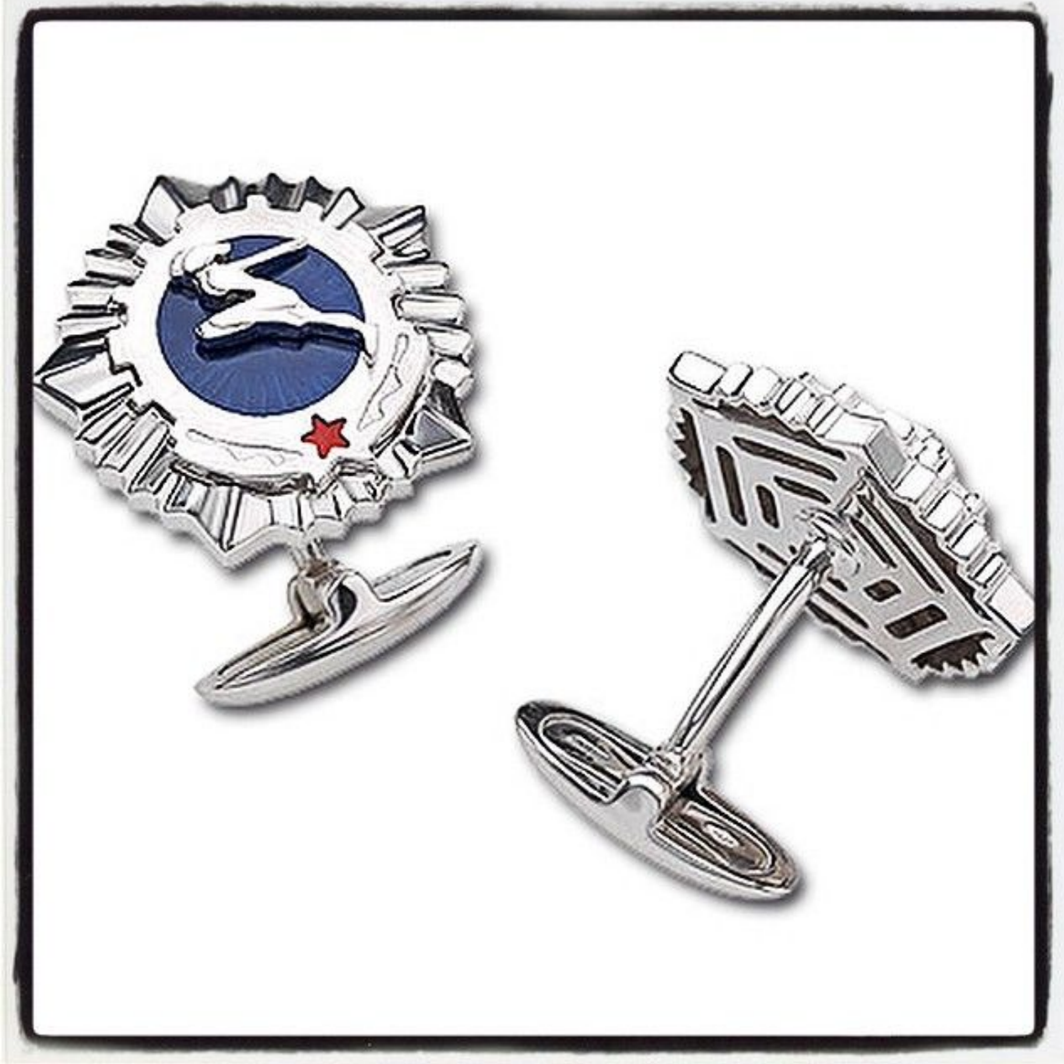
Запонки 20 век