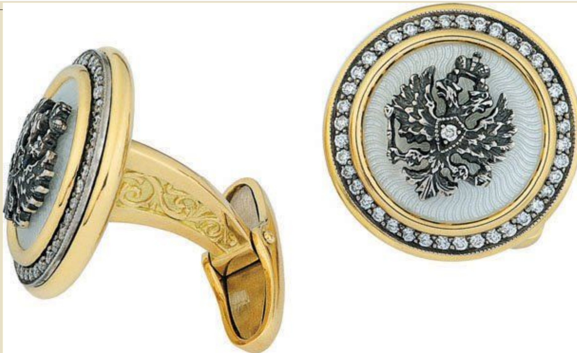
Запонки 19 век