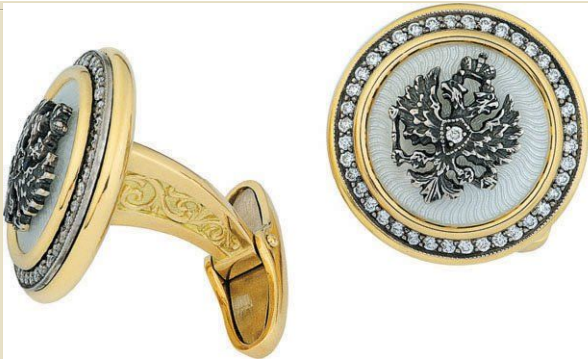
Запонки 19 век