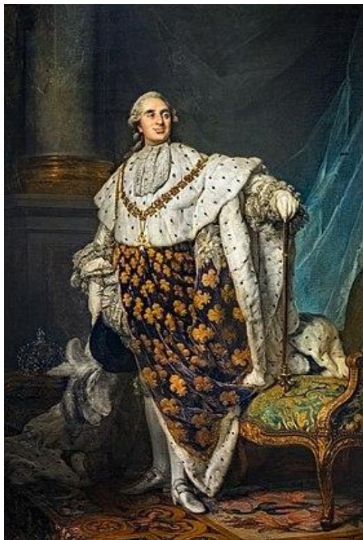
Мария - Антуанетта