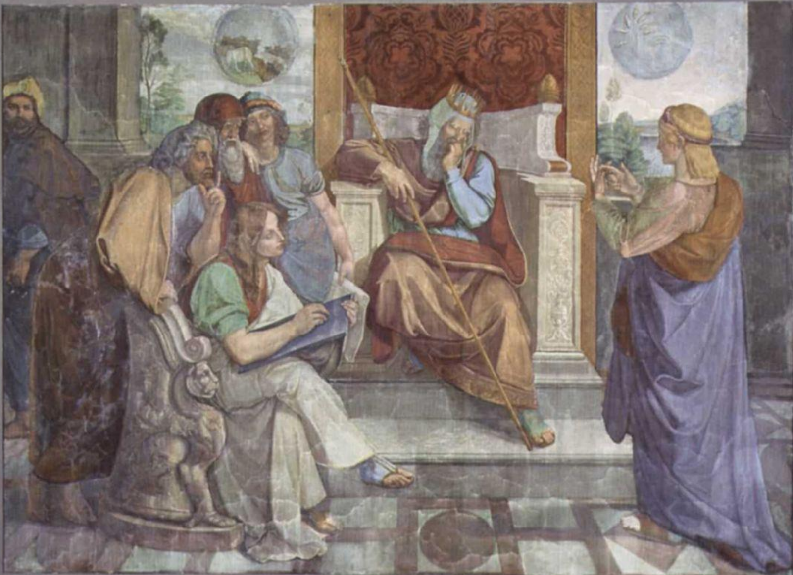
Фрески Каза Бартольди в Риме. Иосиф истолковывает сны фараона