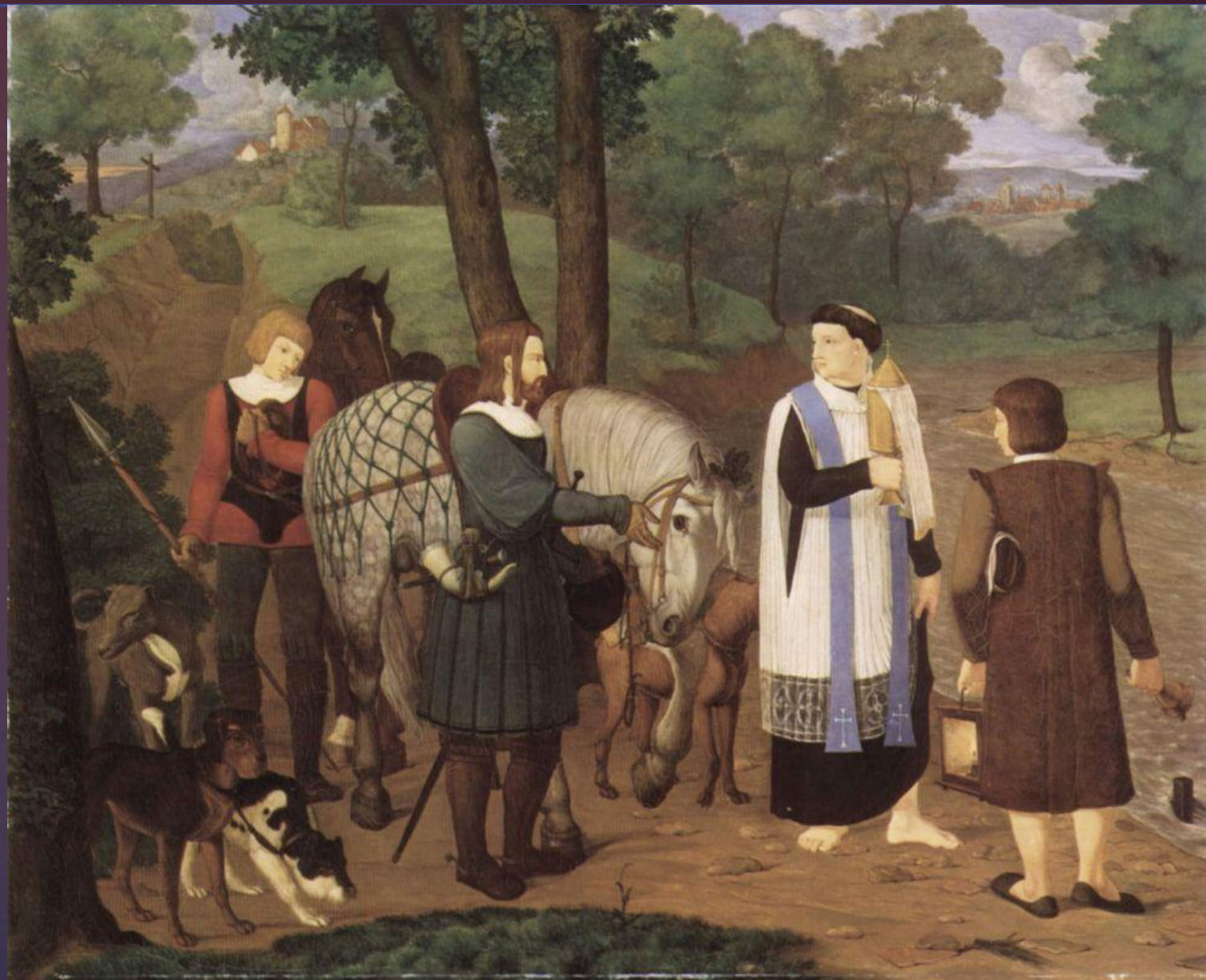
Франц Пфорр. Рудольф Габсбург и священник.