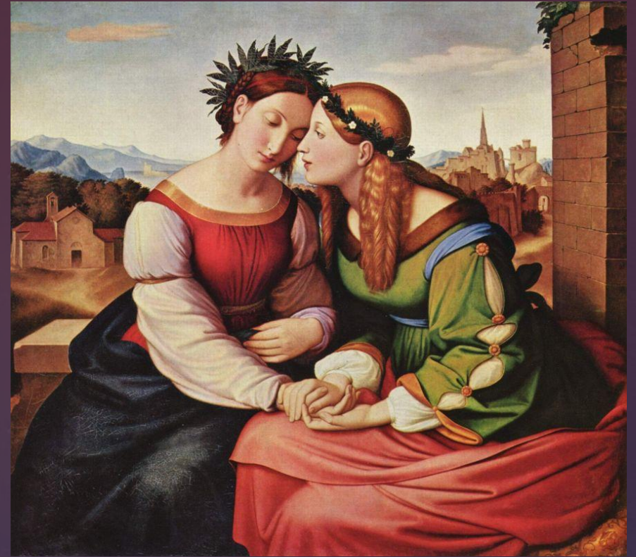
Фридрих Иоганн Овербек. «Италия и Германия»