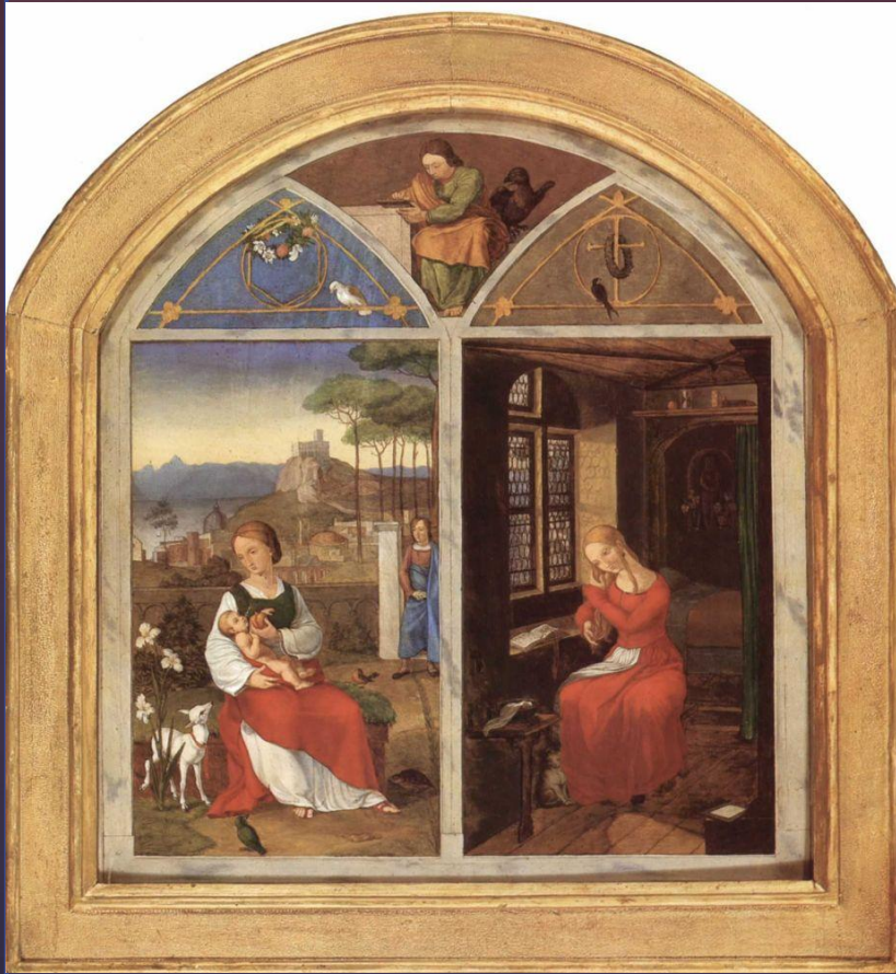
Франц Пфорр «Суламифь и Мария»