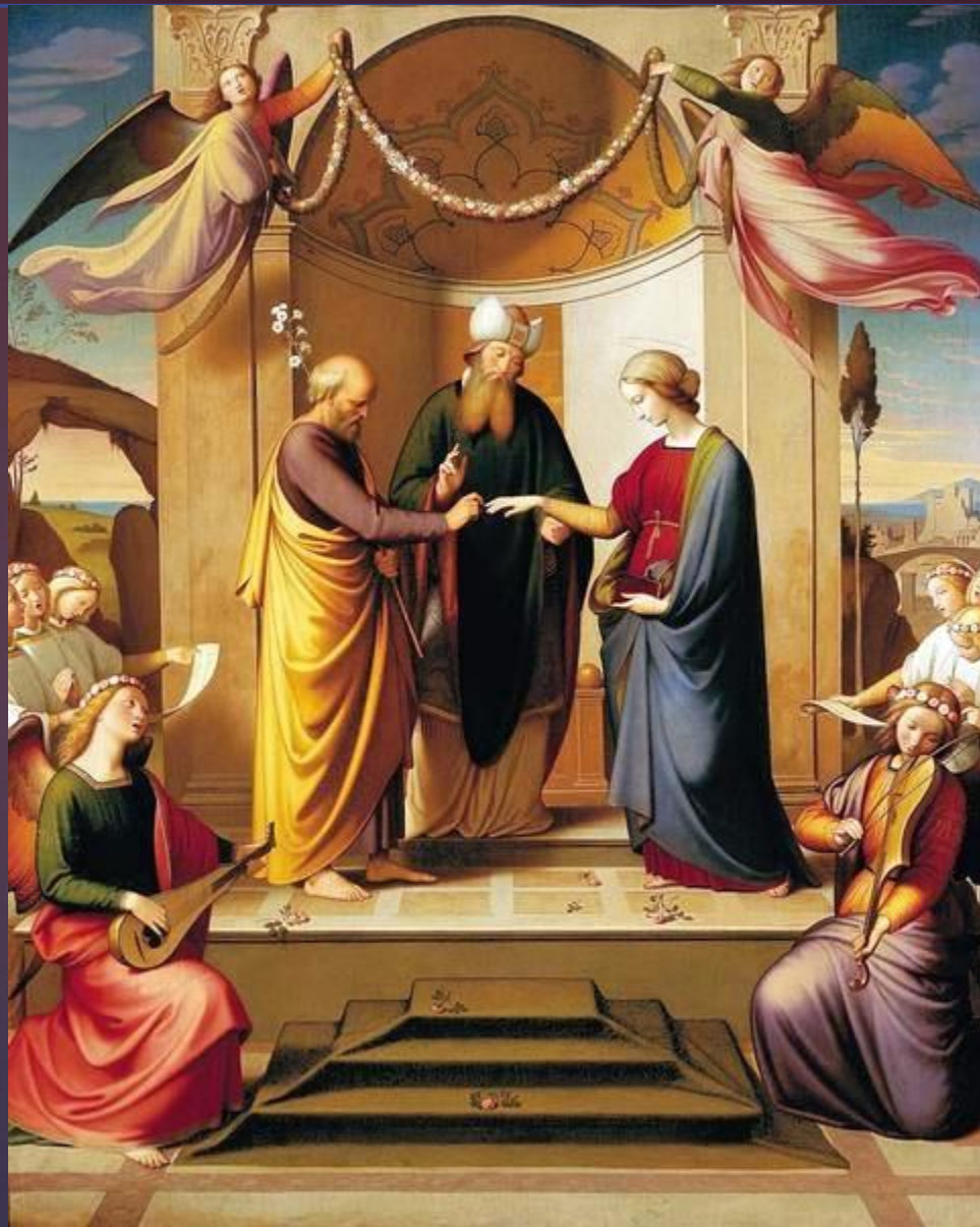
Иоганн Фридрих Овербек, «Обручение Марии и Иосифа» (1836 год)