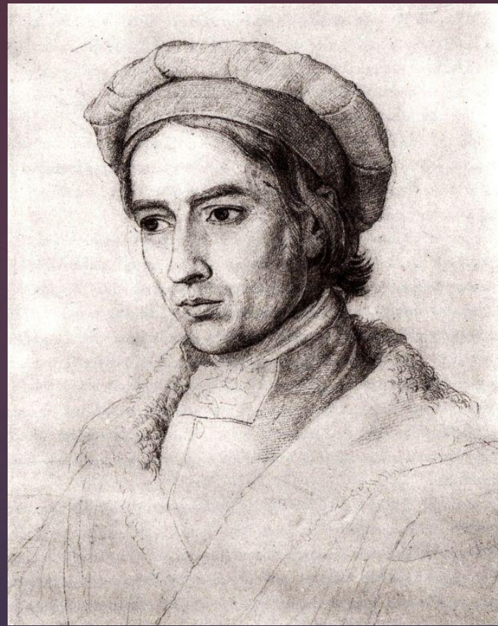
Фридрих Иоганн Овербек