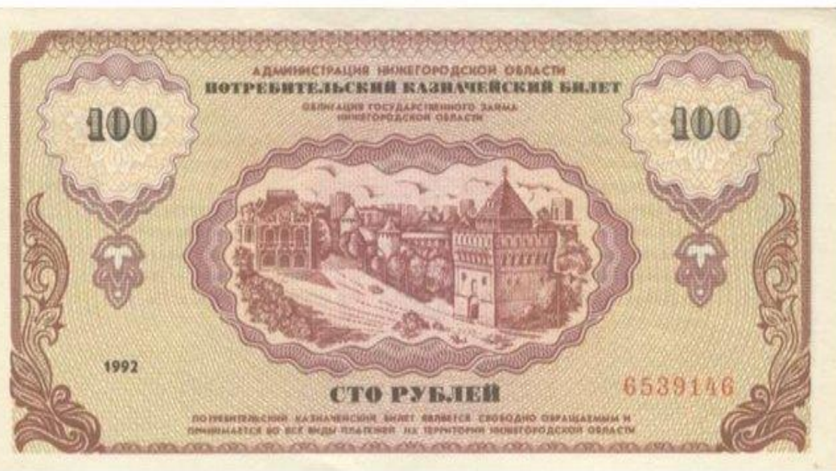
“Немцовки” – денежные суррогаты, появившиеся в Ниж.области в 92 году

Денежные суррогаты – это денежные знаки, не предусмотренные законодательством; вводятся отдельными предприятиями или иными организациями, а тж. гражданами самовольно. Денежные суррогаты — это заменители официальных форм денег, вводимые в обращение хозяйствующими субъектами произвольно с целью осуществления платежей.