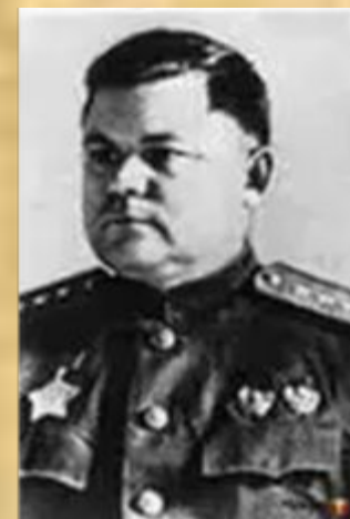
Н. Ф. Ватутин