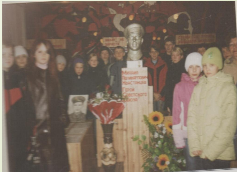
с. Дубовый Овраг школьный музей 2006г.