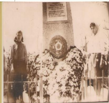
Могила после возложения венков.