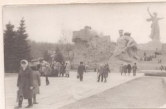
Группа Шошинских учеников побывала в г.Волгограде.