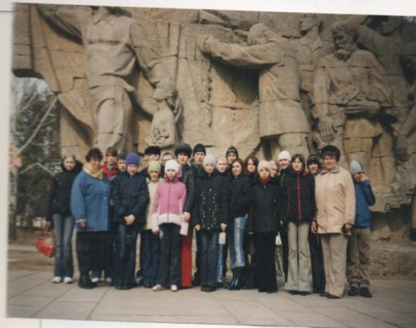
г. Волгоград. Мамаев курган.