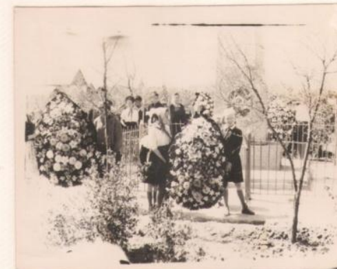
Пионеры возлагают венок на могилу.