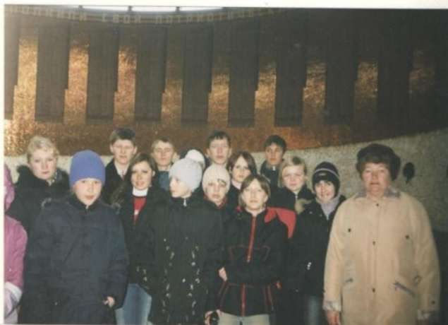
г. Волгоград. В зале боевой славы на Мамаевом кургане.