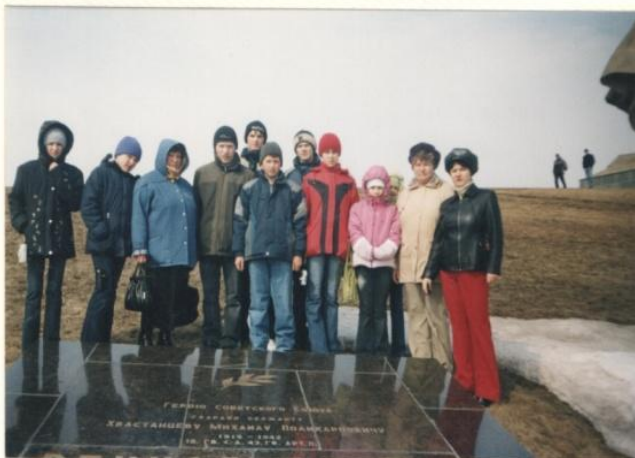
г. Волгоград. У плиты Героя на Мамаевом Кургане.