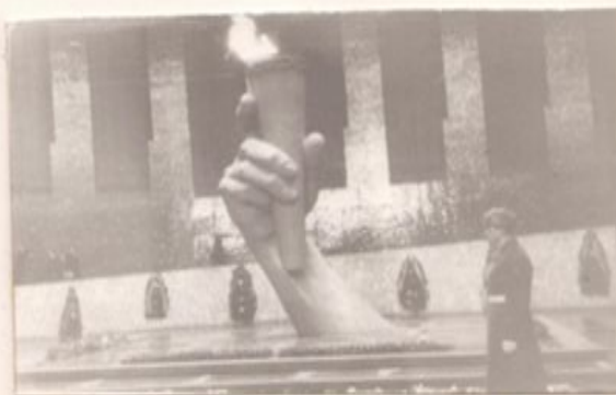
г.Волгоград. Зал Воинской Славы.