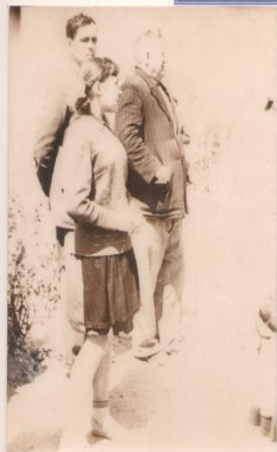
Выступление пионерки из отряда имени М.П.Хвостанцева.