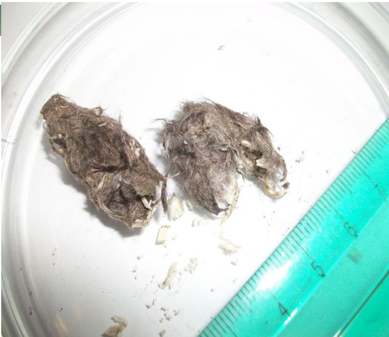
Погадка ушастой совы