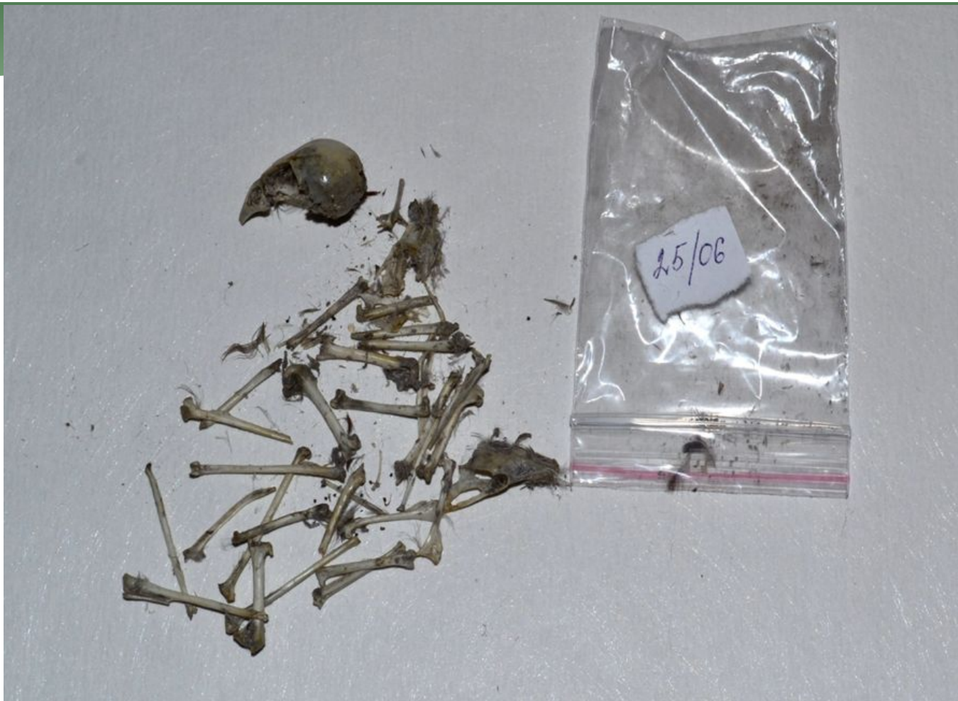
Фрагменты птицы в разобранной погадке ушастой совы