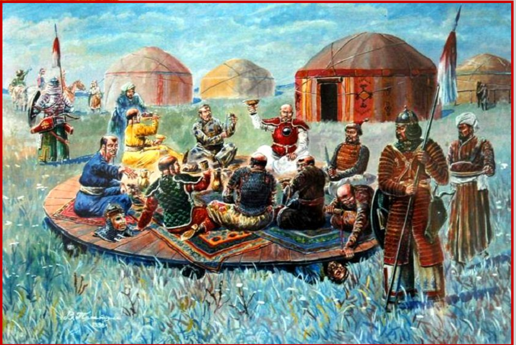
Пир после победы на Калке