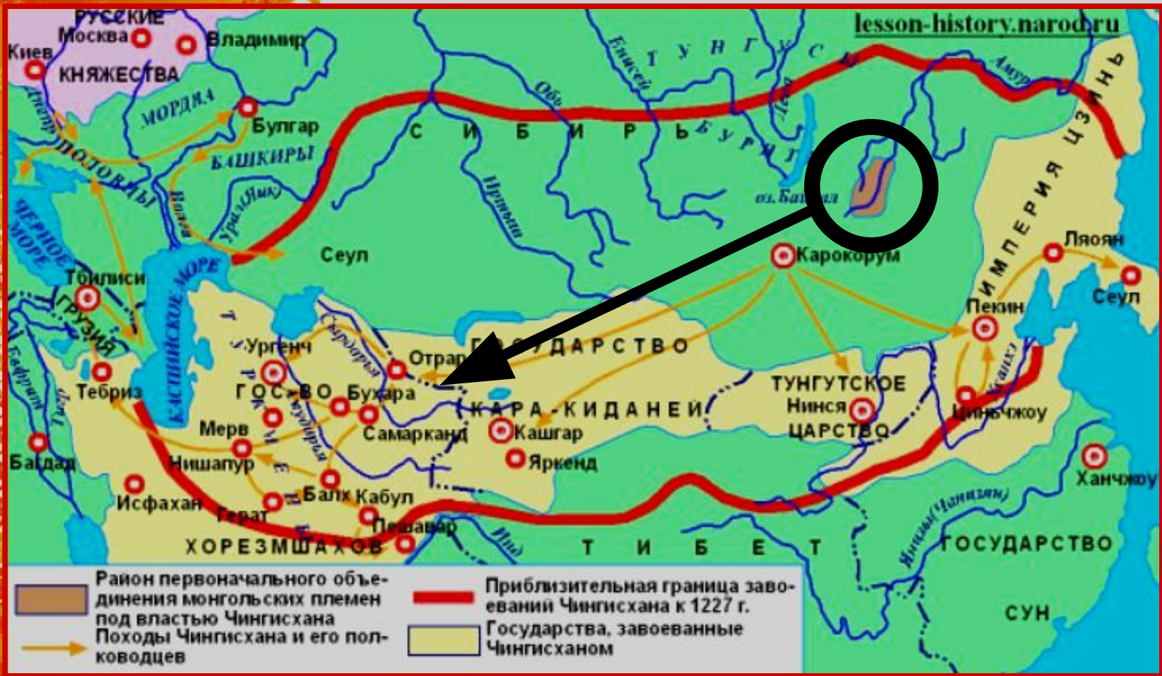
Азия в 13 веке