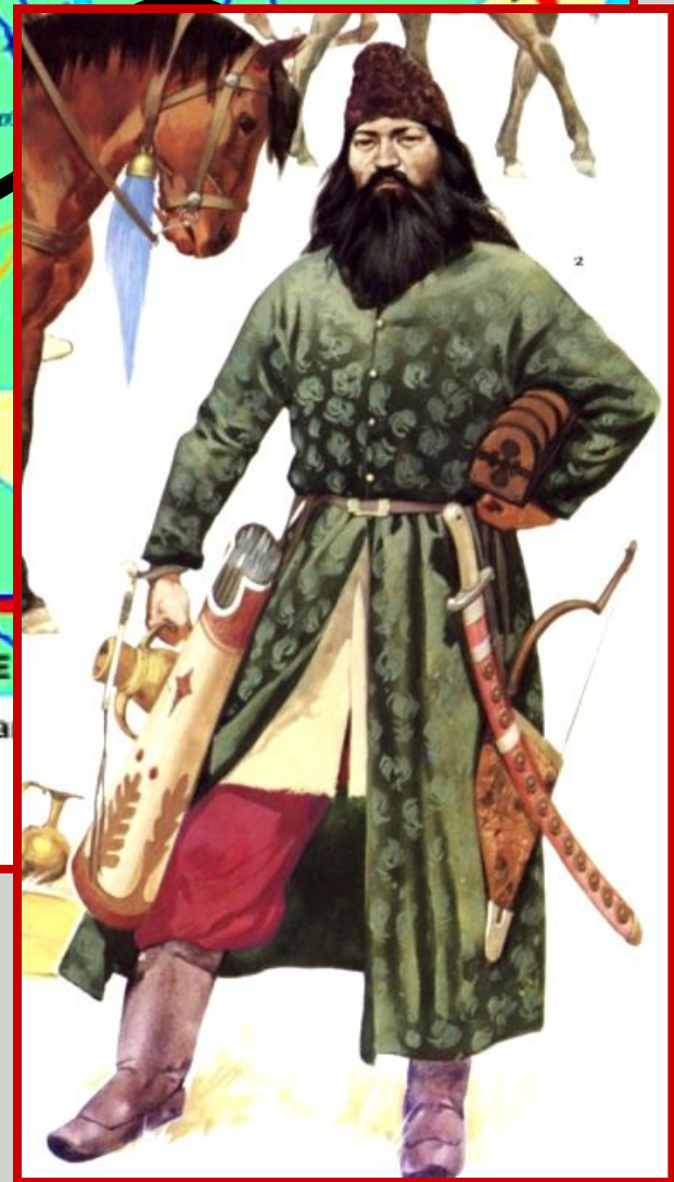
Вторжение в половецкие степи