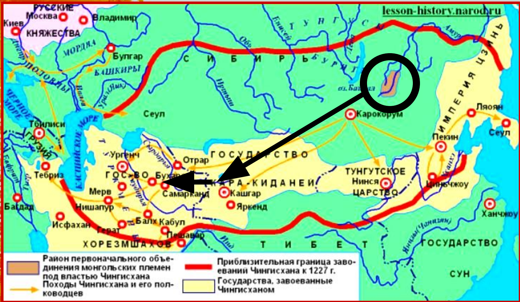
Азия в 13 веке