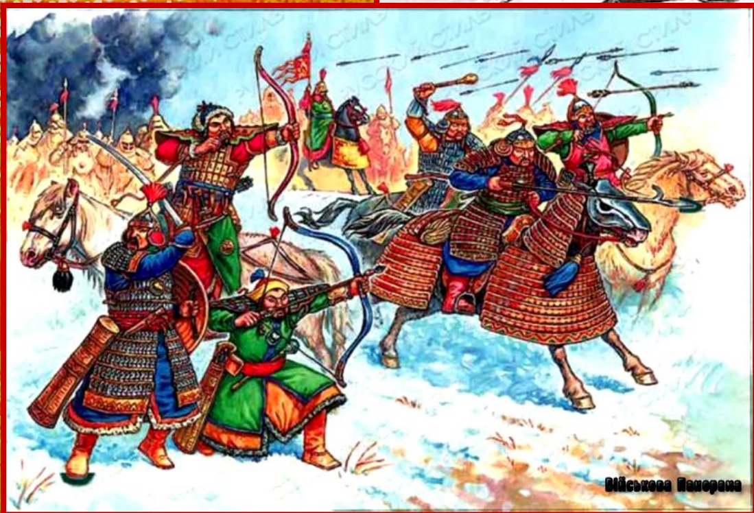
Монголо-татары в бою