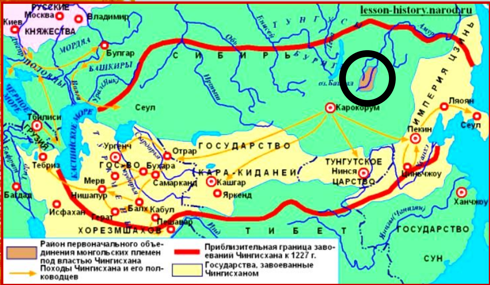
Азия в 13 веке (карта 8)