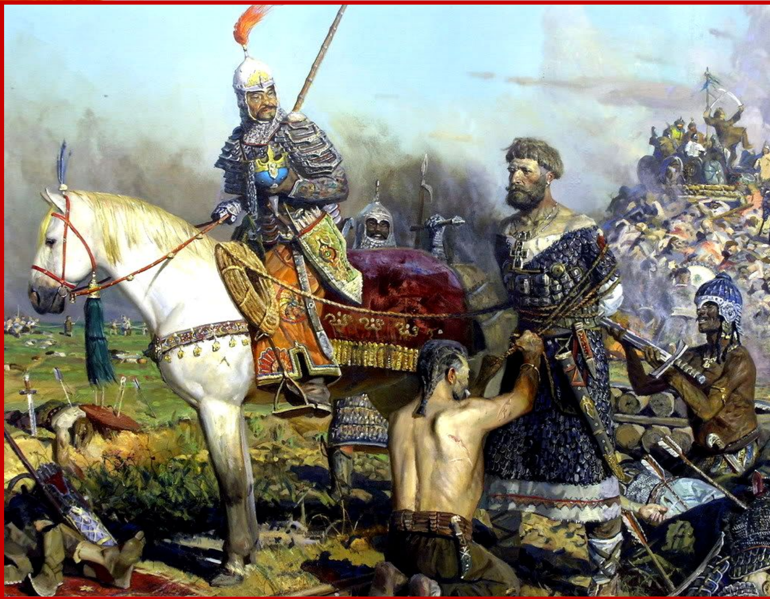
Пленение русского князя