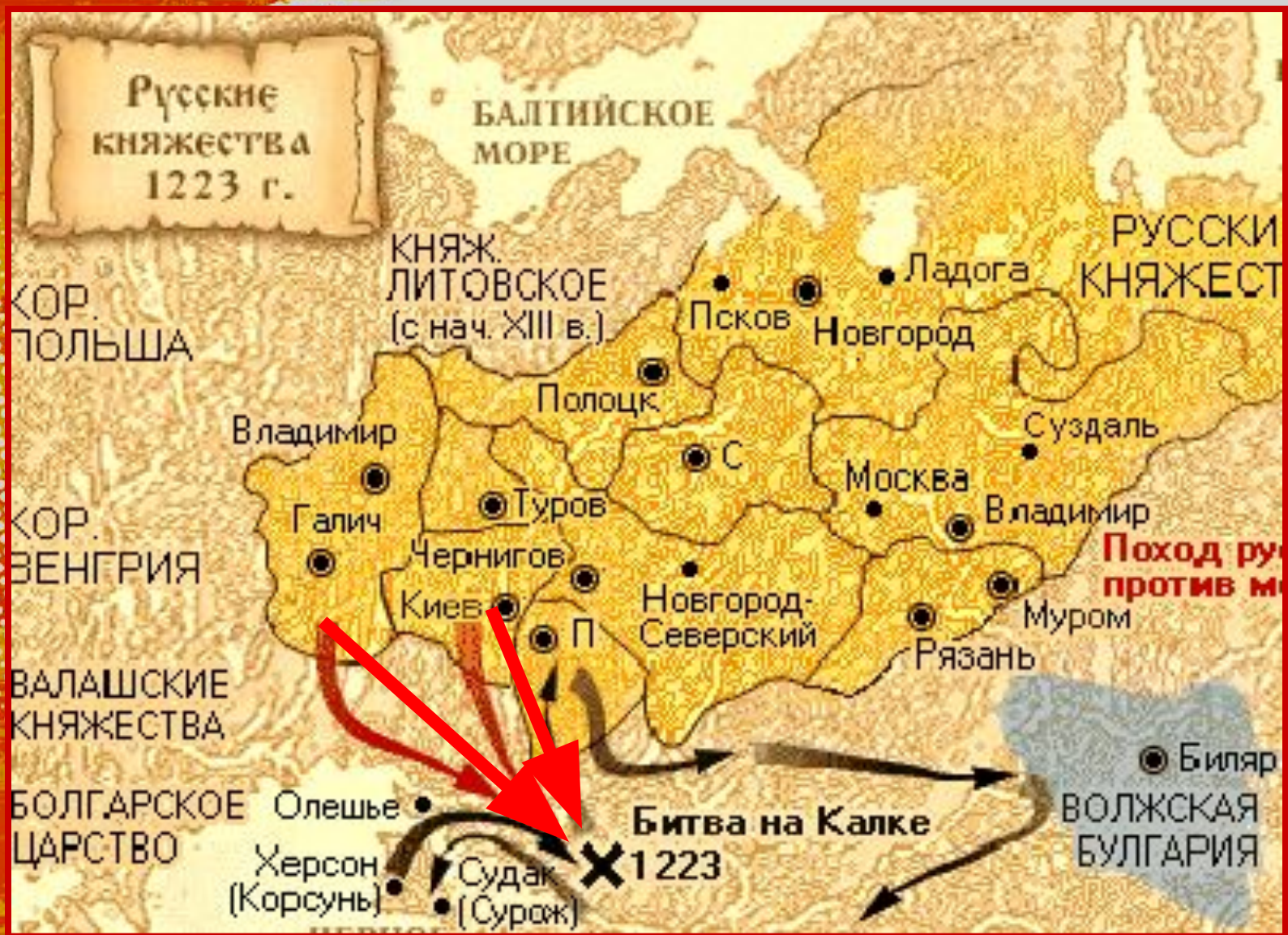
Русские княжества 1223 год