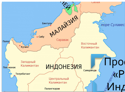
Проект ПАО «РЖД» в Индонезии