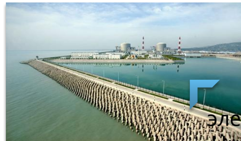
Атомная электростанция «Ниньтхуан-1» во Вьетнаме