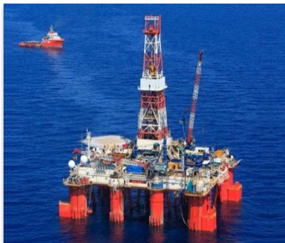
Проекты ПАО «НК Роснефть», Вьетнам