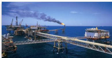
Проекты ПАО «Газпром», Южно- Китайское море, Вьетнам