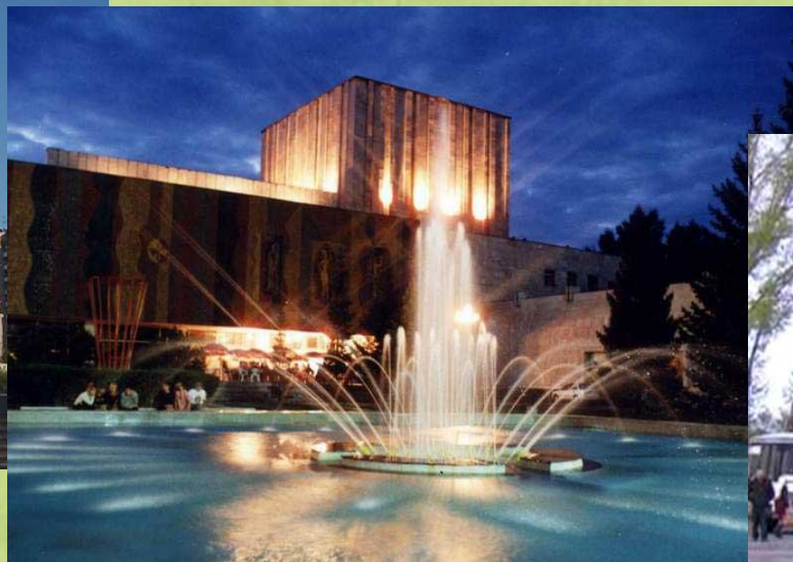
Драматический театр им. М. Ю. Лермонтова