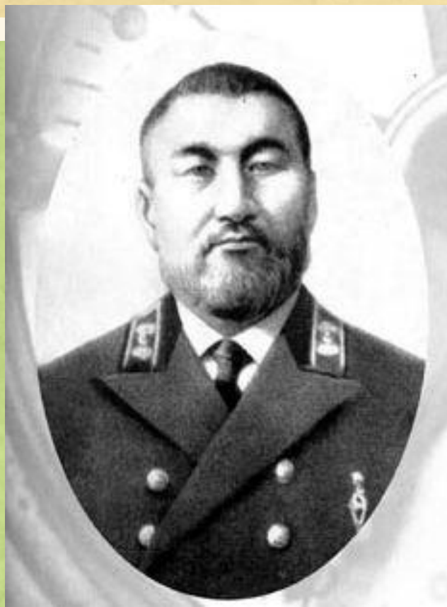
Николай Федорович Катанов (1862 – 1922)