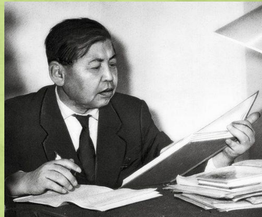
Доможаков Николай Георгиевич (1916 – 1976)