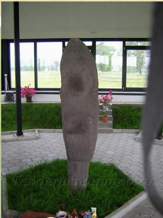
Улуг Хуртуях Тас