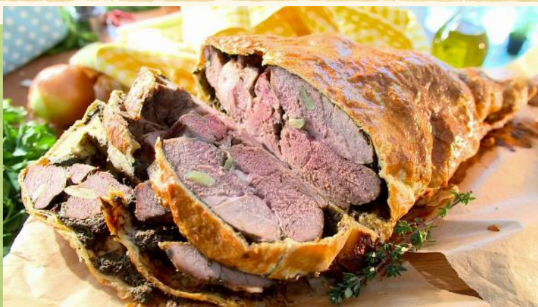
Бог (баранья нога)