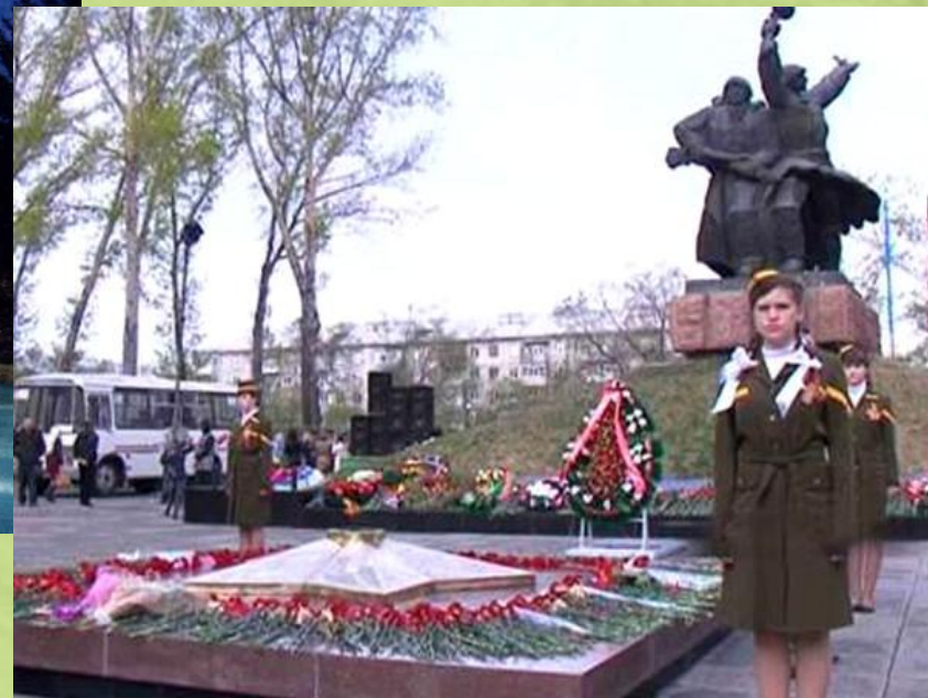
Памятник воинской Славы