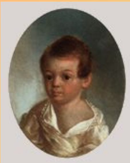
К. де Местр(?). Пушкин-ребенок. Метал. пласт., масло. 1801-1802. (ГМТТ)

Детские годы Пушкина протекли в Москве и подмосковном селе Захарове. Будущий поэт рос в обедневшей дворянской семье. Его отец Сергей Львович воспитание детей поручил жене Надежде Осиповне из рода Ганнибалов. Красавица-"креолка" была поглощена светскими обязанностями, а воспитанием Александра, Льва и Ольги занимались бабушка Мария Алексеевна Ганнибал, крепостная няня Арина Родионовна и многочисленные гувернеры и учителя, преимущественно иностранцы. Бабушка была "ума светлого и по своему времени образованною". Мальчик заслушивался ее рассказами о Пушкиных и Ганнибалах, чьи имена нашли свое место на страницах русской истории.