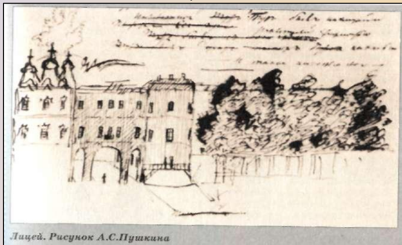
Лицей. Рисунок А.С.Пушкина

19 октября 1811 года. Торжество открытия Царскосельского лицея. В Актовом зале собралась царская семья с государем, высокопоставленные чиновники и гости, преподаватели и гувернеры, тридцать воспитанников и среди них Пушкин. Были прочитаны манифест об учреждении Лицея и Устав, в котором было записано, что в этом учебном заведении телесные наказания запрещены.