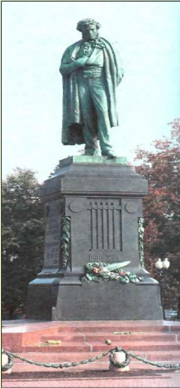
Памятник А. С. Пушкину на Страстной (Пушкинской) площади в Москве. Установлен в 1880 г. Скульптор А. М. Опекушин