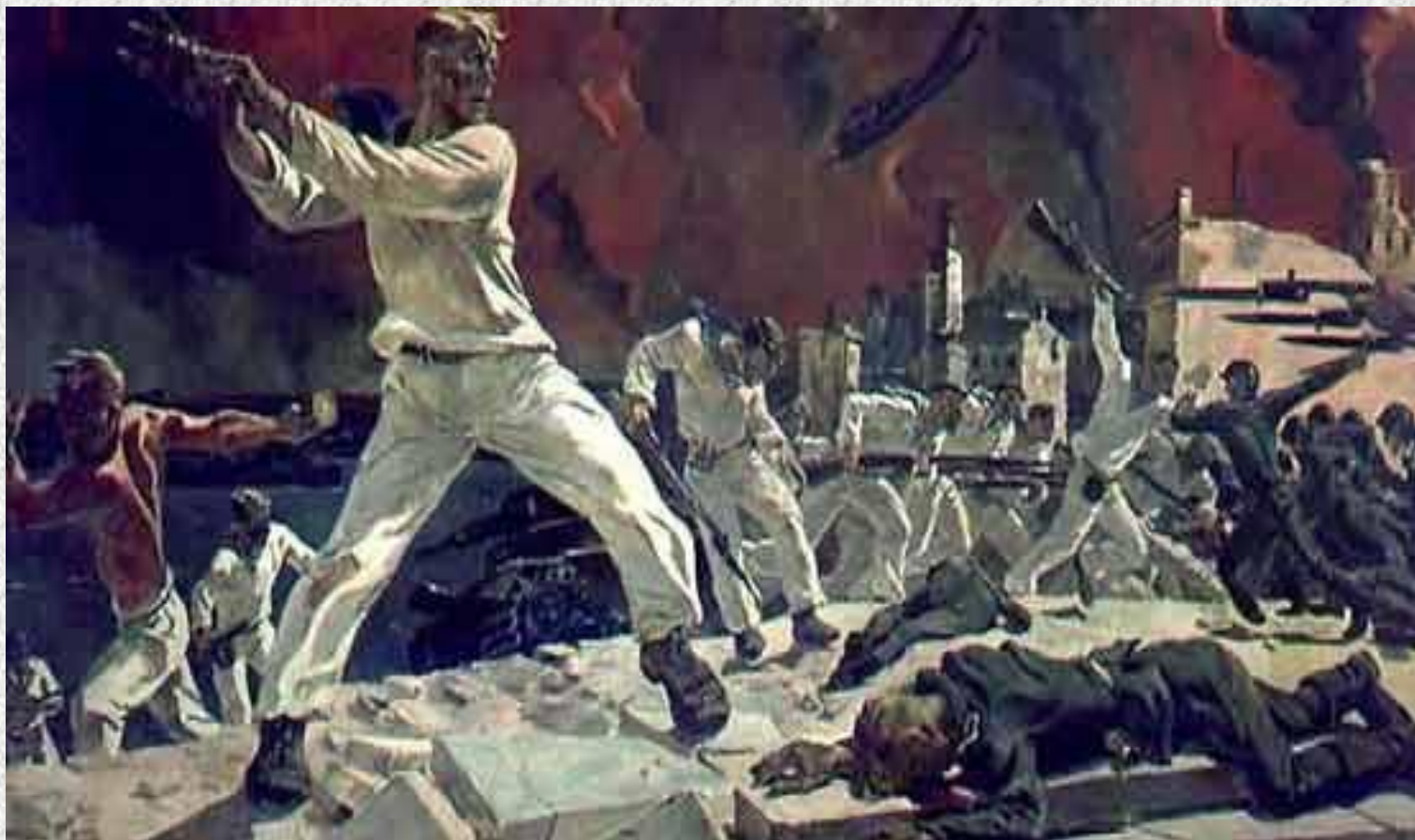
А. Дейнека. « Оборона Севастополя »