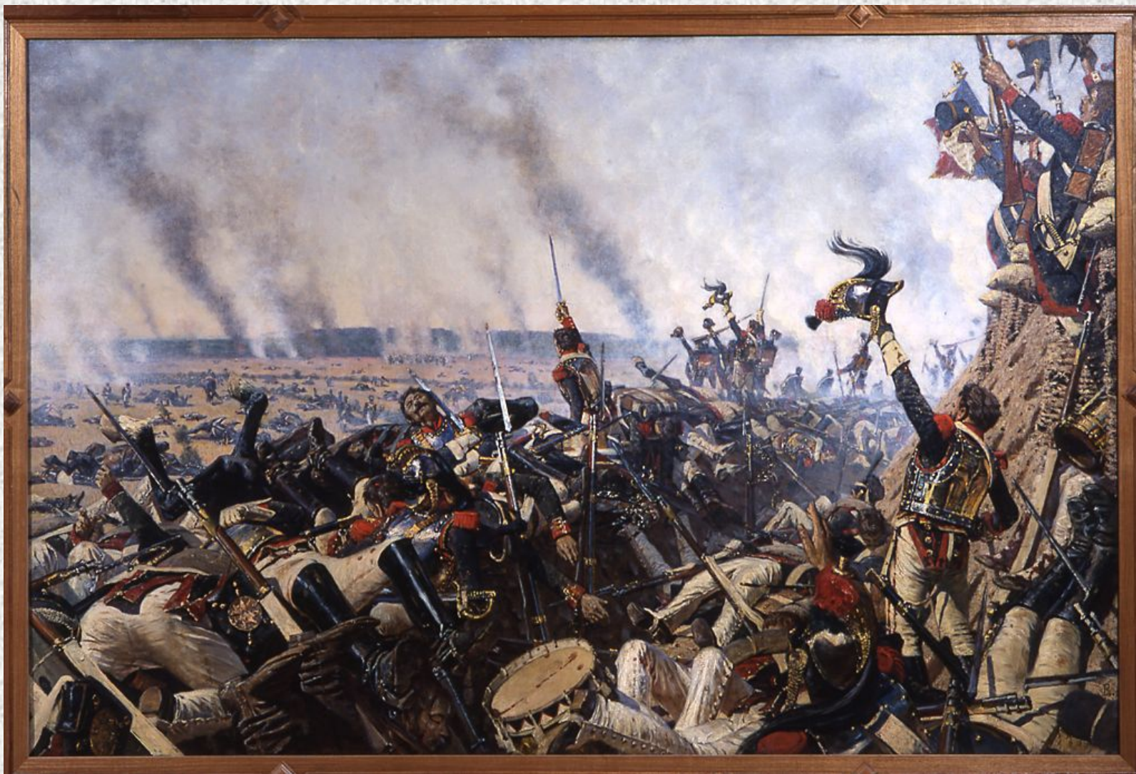
В.Верещагин. Конец Бородинского сражения