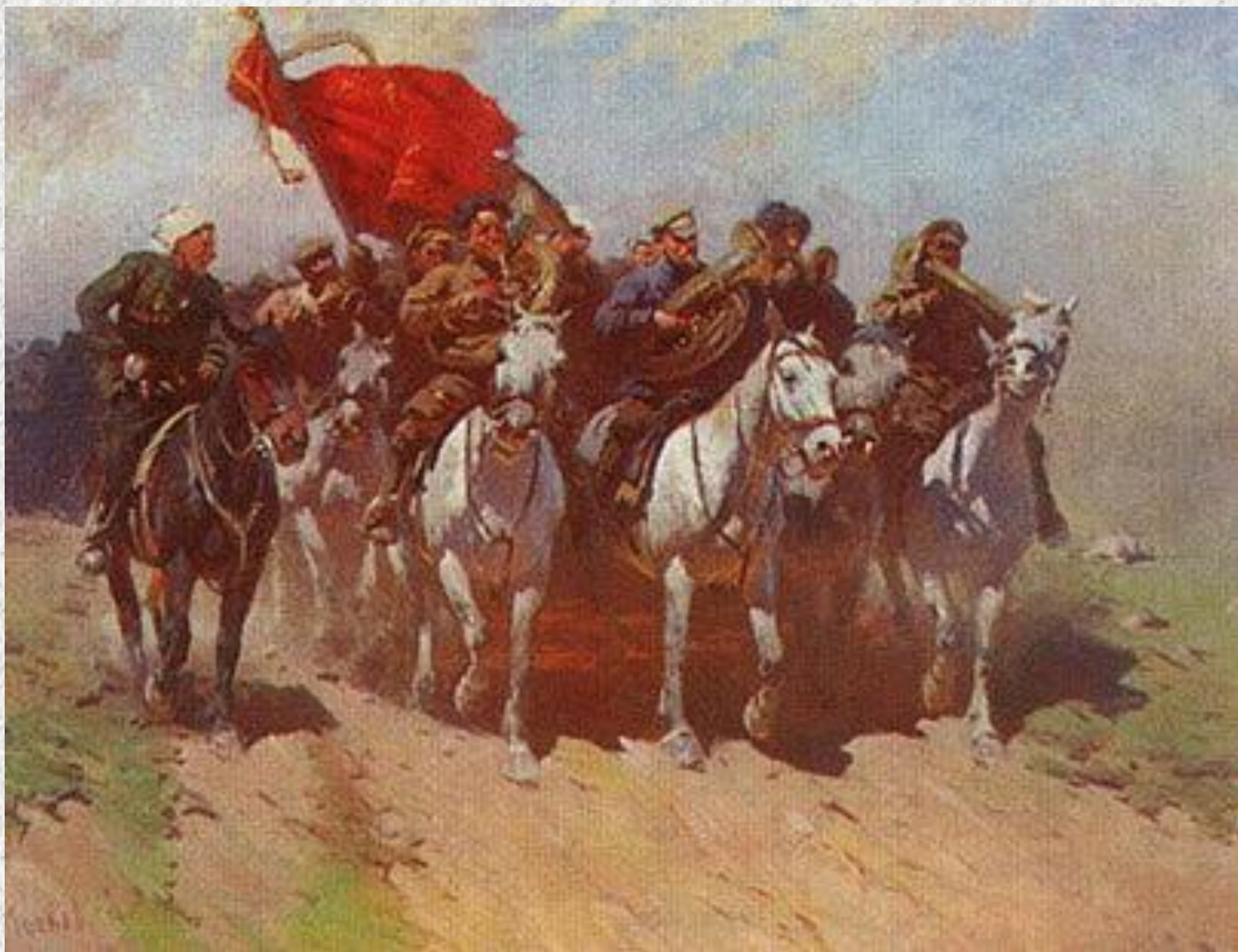
Б.Греков. «Трубачи первой конной»