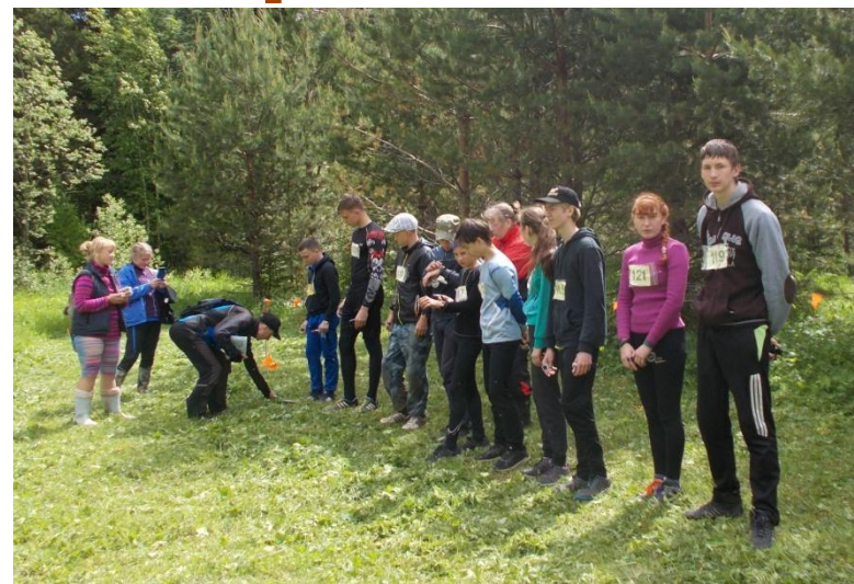
И бегом, держа карту в руке. Выдача карт на старте.