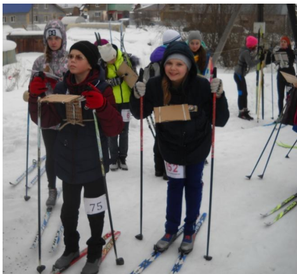
На лыжах со специальным столиком для карты