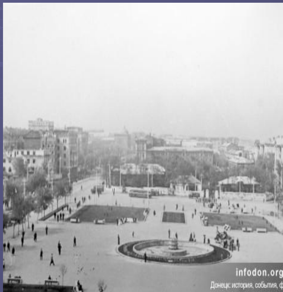
infodon.org.ua Донецк: история, события, факты