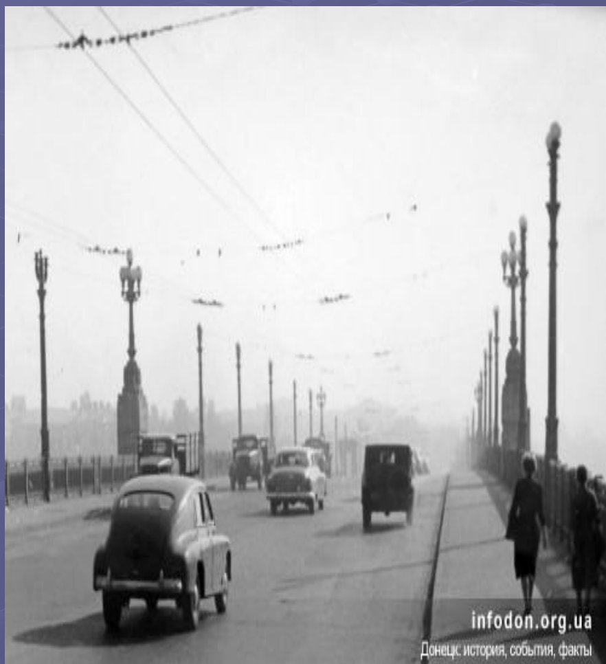
infodon.org.ua Донецк: история, события, факты