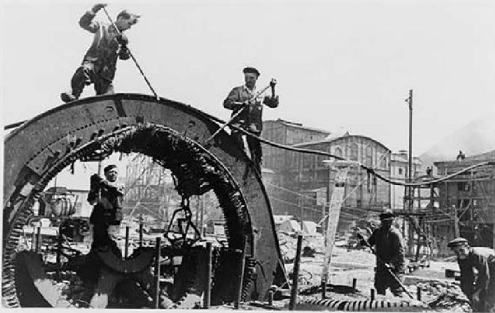
Восстановление шахты в Горловке