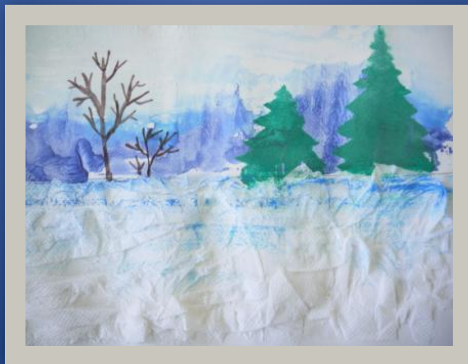
Рисунок на тему: «Зима» в смешанной технике