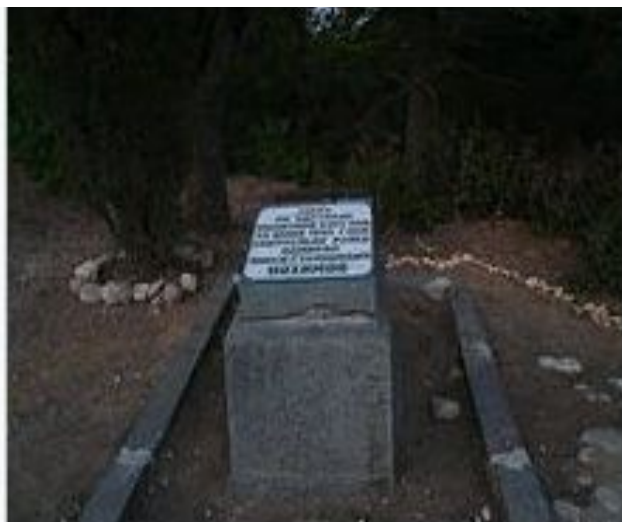
Памятная плита на Малаховом кургане на месте, где был смертельно ранен адмирал П. С. Нахимов