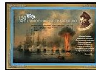
Почтовая марка СССР 1952 год: 150 лет со дня рождения