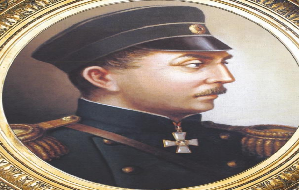
НАХИМОВ ПАВЕЛ СТЕПАНОВИЧ 1802-1855