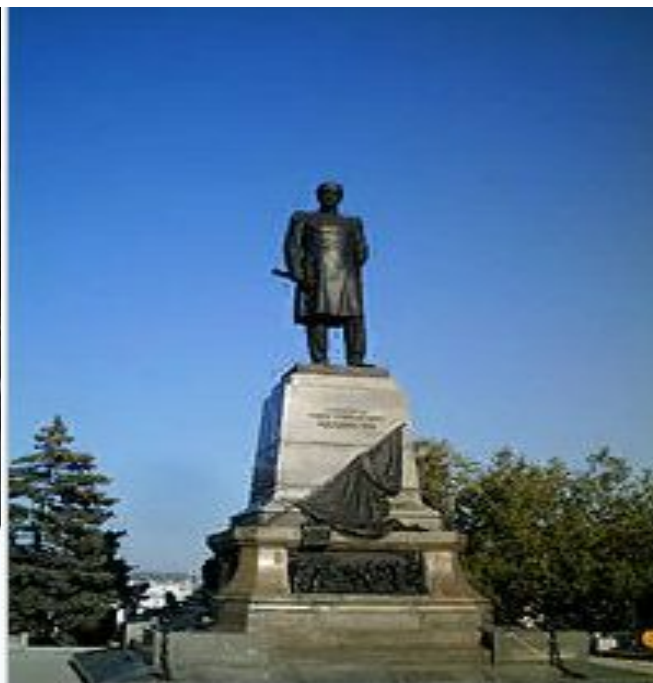
Памятник П. С. Нахимову в Севастополе