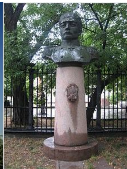
Бюст Нахимова, установленный возле Музея судостроения и флота в Николаеве.