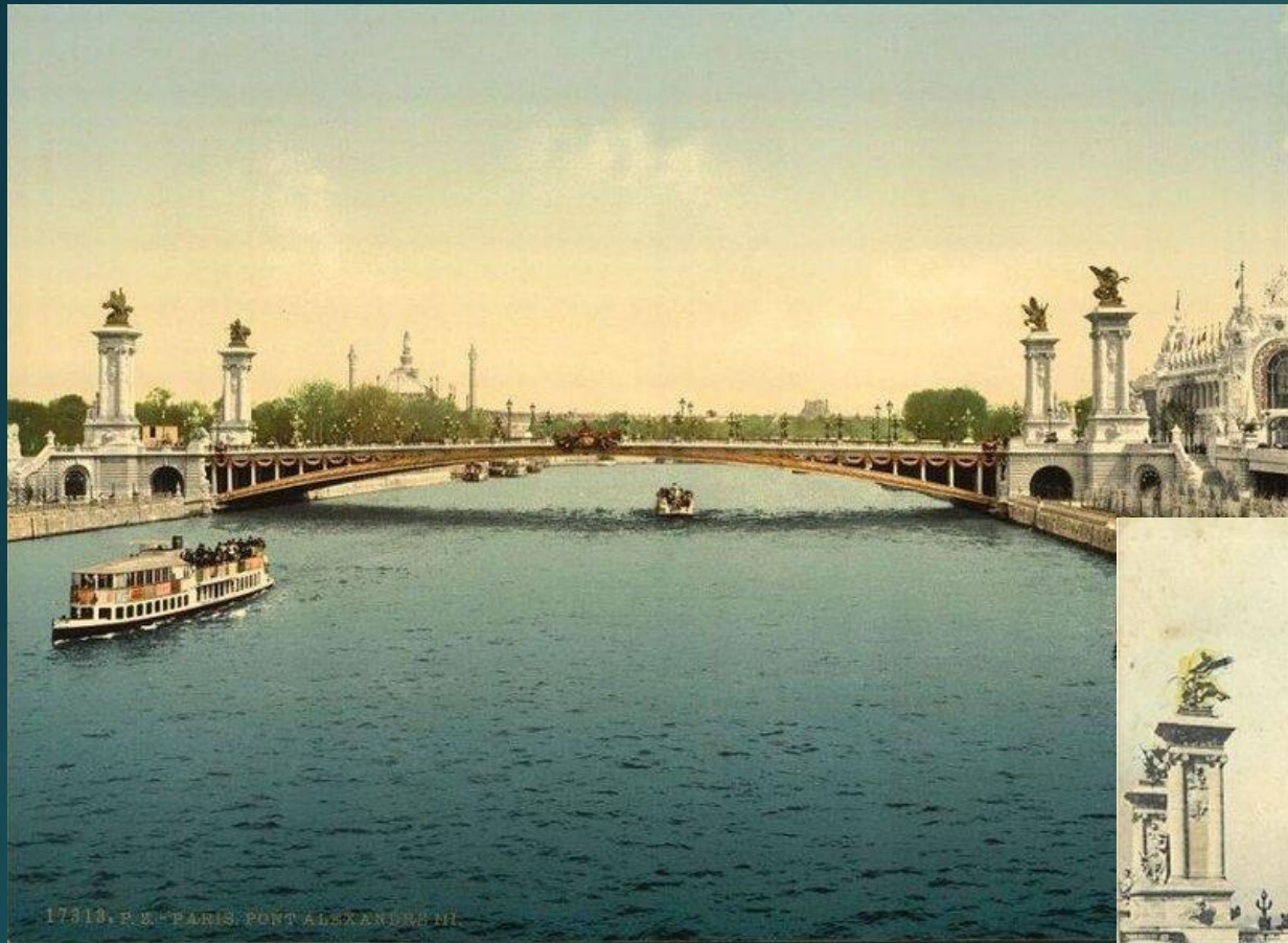
17319. P. F. - PARIS. PONT ALEXANDRE III.