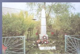
Памятник погибшим землякам в селе Вторые Ключики