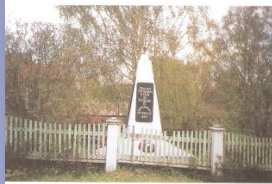
Памятник погибшим землякам в селе Павлово Красносельского сельского Совета