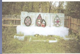
Памятник погибшим землякам в селе Межовка Второго Ключиковского сельского Совета

По всей России obeliski, как души рвутся из земли