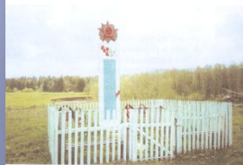
Памятник погибшим землякам в деревне Михайловка Ашанского сельского Совета