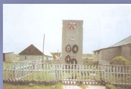
Памятник погибшим землякам в деревне Шелаванка Апанского сельского Совета