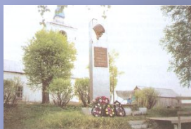
Памятник погибшим землякам в селе Красный Яемса