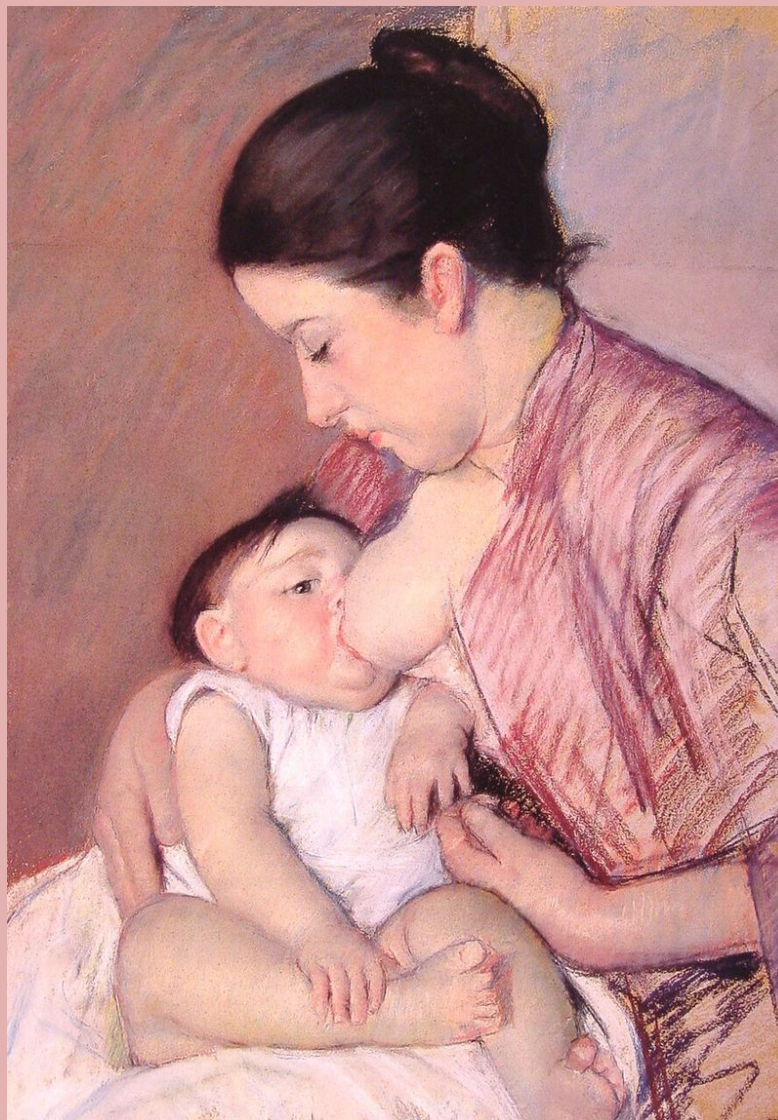
Мэри Кассат. Название неизвестно