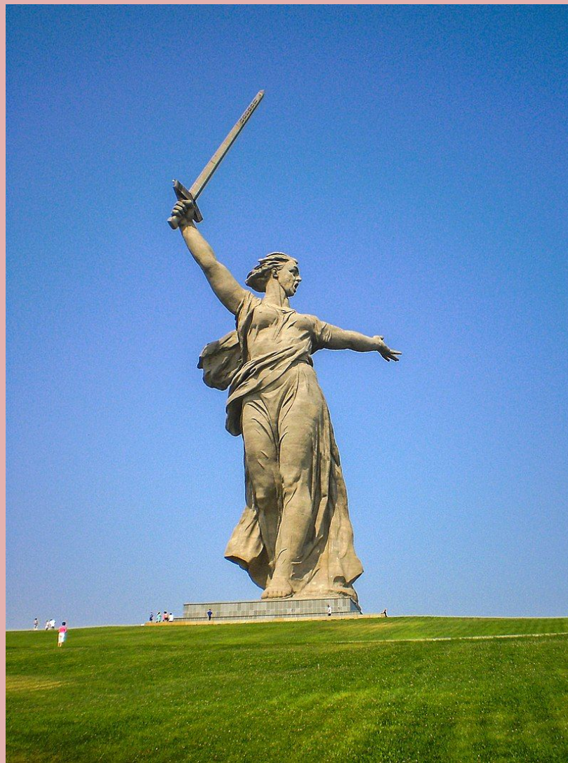
Родина-Мать зовёт! , скульптура на Мамаевом Кургане