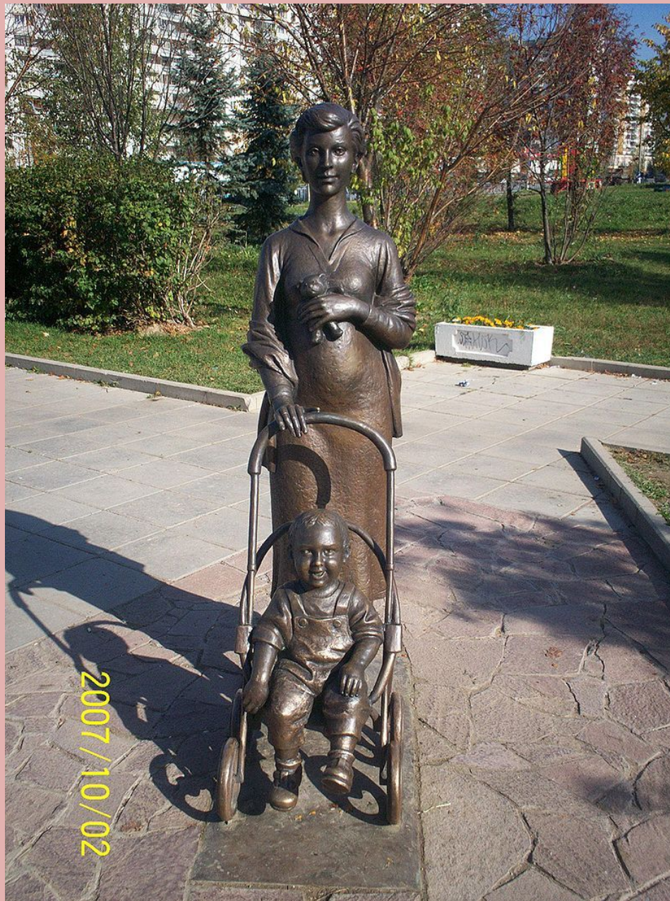
Скульптурная композиция «Мать и дитя» (Зеленоград)