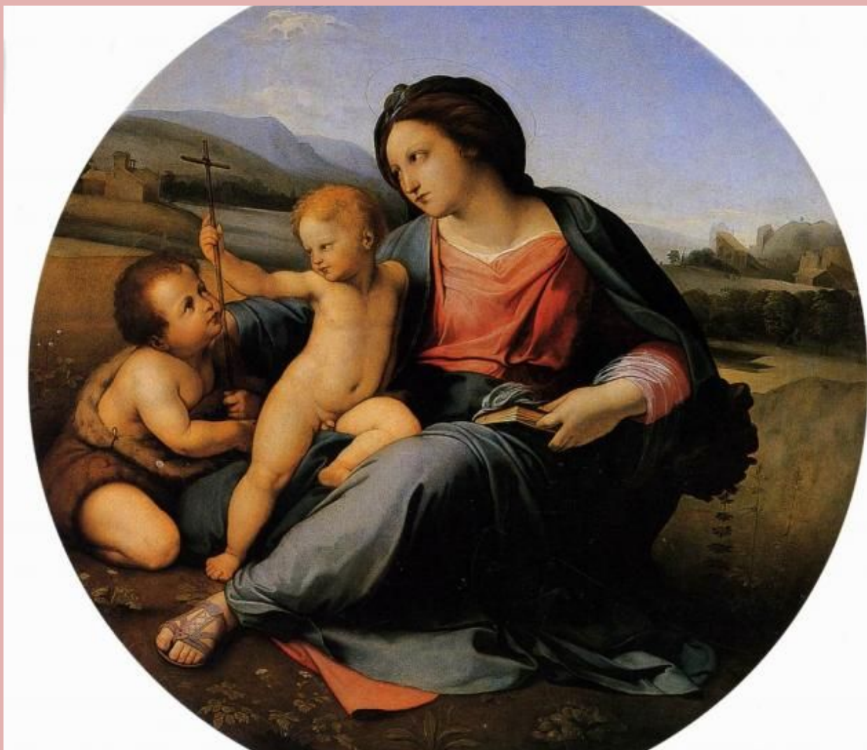
Бруни. Мадонна Альба