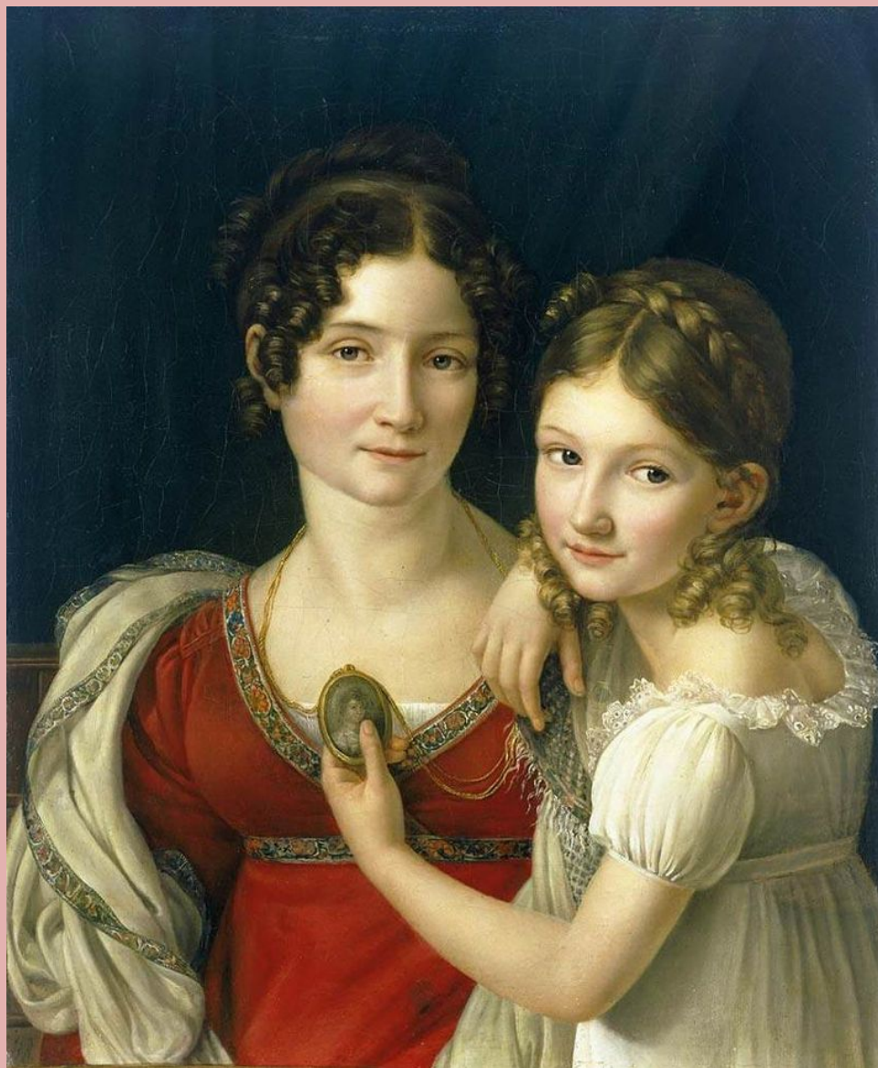
Ф. Ризенер. Мать и её дочь