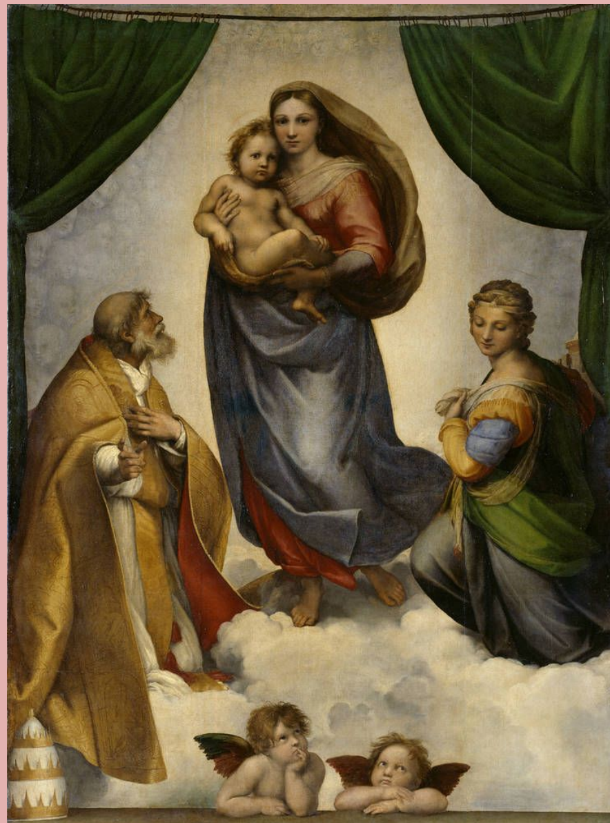
Рафаэль, Сикстинская Мадонна