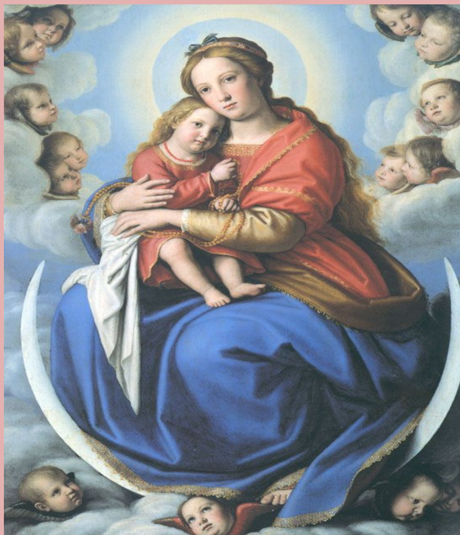
Мадонна с Иисусом (из собрания Ватиканского музея).