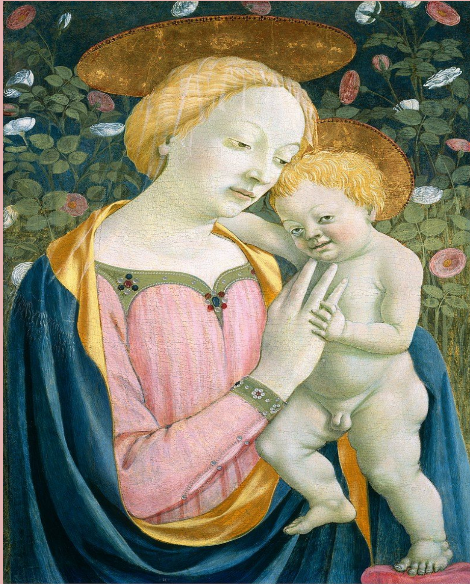
Мадонна с младенцем, Вашингтон