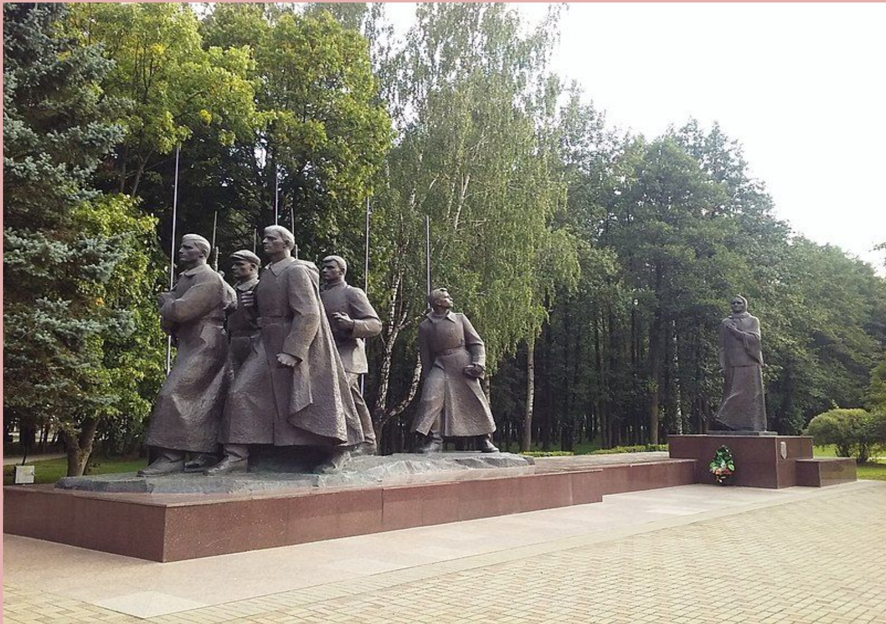
Монумент в честь советской матери-патриотки (Жодино)