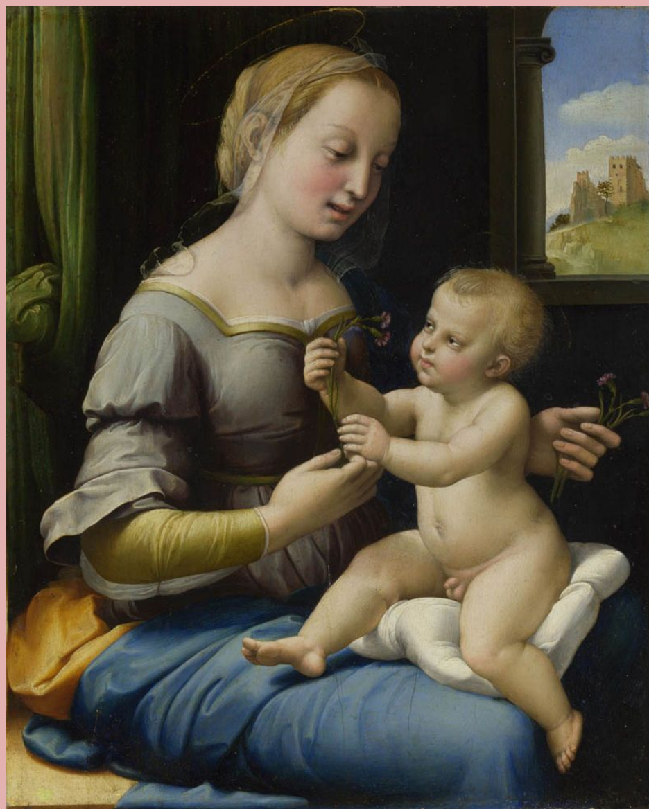
Рафаэль. Мадонна с гвоздикой.