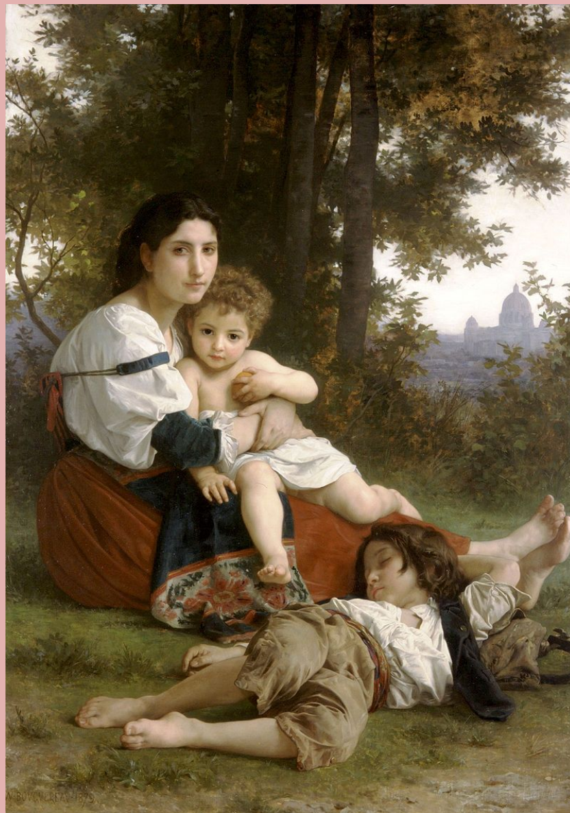
Адольф Вильям Бугро. Отдых