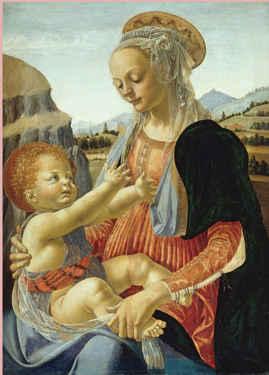
Андреа Верроккьо. Мадонна с младенцем