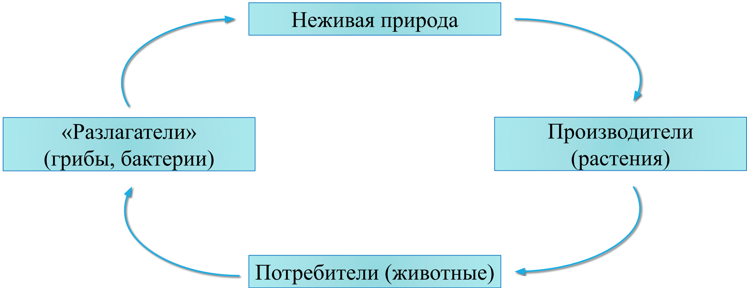
Схема. Поток органических веществ в природе