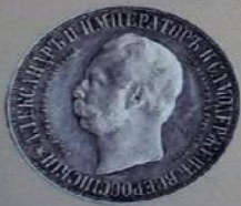
Александр II Николаевич с 18 февраля 1855 г. по 1 марта 1881 г.