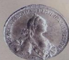
Екатерина II Алексеевна с 28 июня 1762 г. по 6 ноября 1796 г.