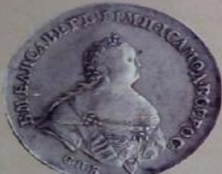
Елизавета Петровна с 26 ноября 1741 г. по 25 декабря 1761 г.