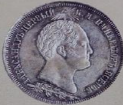
Александр I Павлович с 11 марта 1801 г. по 19 ноября 1825 г.