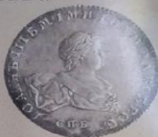
Иоанн III Антонович с 17 октября 1740 г. по 25 ноября 1741 г.