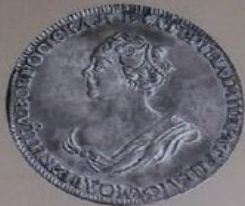
Екатерина I Алексеевна с 28 января 1725 г. по 5 мая 1727 г.