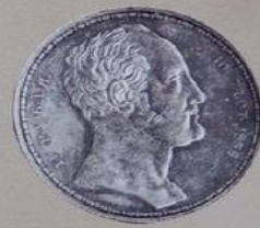
Николай I Павлович с 19 ноября 1825 г. по 17 февраля 1855 г.