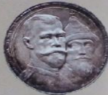
Николай II Александрович с 20 октября 1894 г. по 2 марта 1917 г.