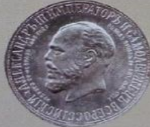
Александр III Александрович с 1 марта 1881 г. по 20 октября 1894 г.