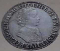
Петр I Алексеевич царь с 27 апреля 1682 г., император с 22 октября 1722 г. по 28 января 1725 г.