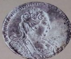
Анна Иоанновна с 25 февраля 1730 г. по 17 октября 1740 г.