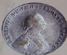
Петр III Федорович с 25 декабря 1761 г. по 28 июня 1762 г.