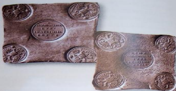
▼ Монета-плата гривна (номинал, эквивалентный 10 копейкам) образца 1726 г. Размер — 65 × 65 мм; вес — 163,8 г; металл — медь; гурт — гладкий.