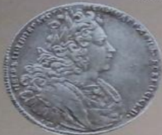
Петр II Алексеевич с 6 мая 1727 г. по 19 января 1730 г.