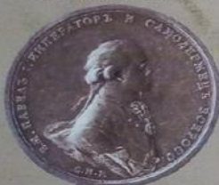
Павел I Петрович с 6 ноября 1796 г. по 11 марта 1801 г.