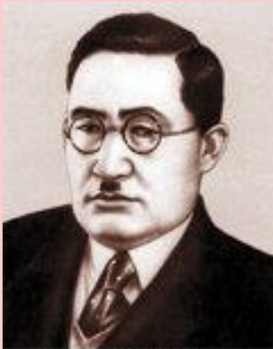
ЛУДВИГ ЖАКШЧИТІС (1894–1938)