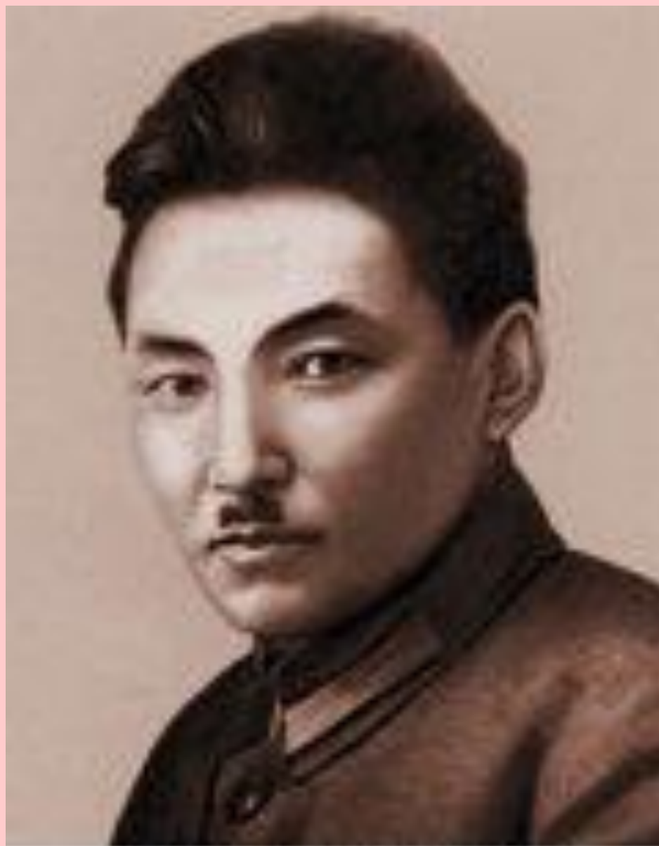
ЖУСПЕБЕК АЙМАБЫТОВ (1889–1931)