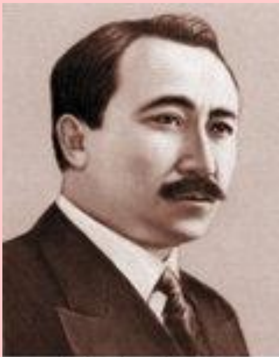
СОКОЛ СЕЙФУЛЛИН (1894—1938)