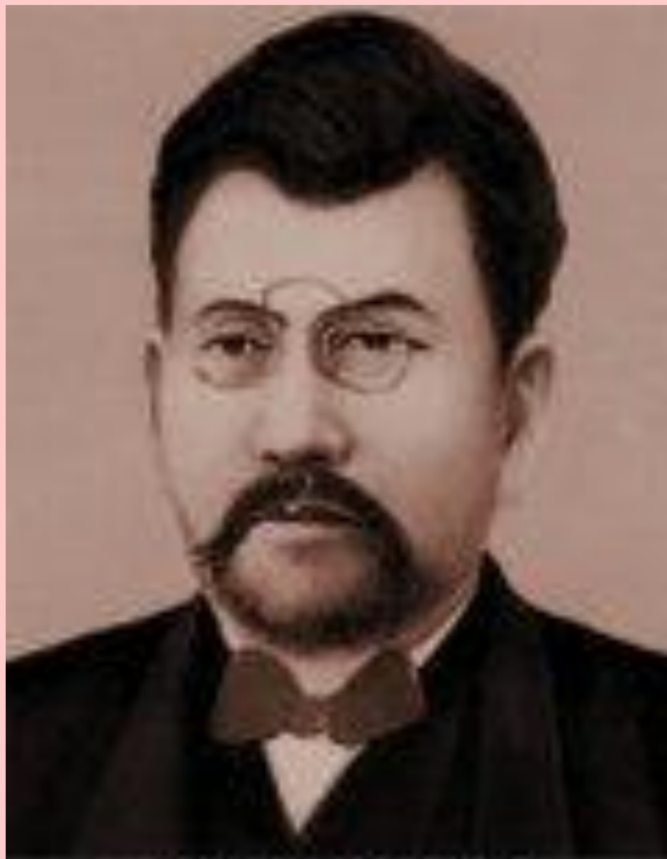
АХМЕТ БАЙТУРСЫНОВ (1873–1938)