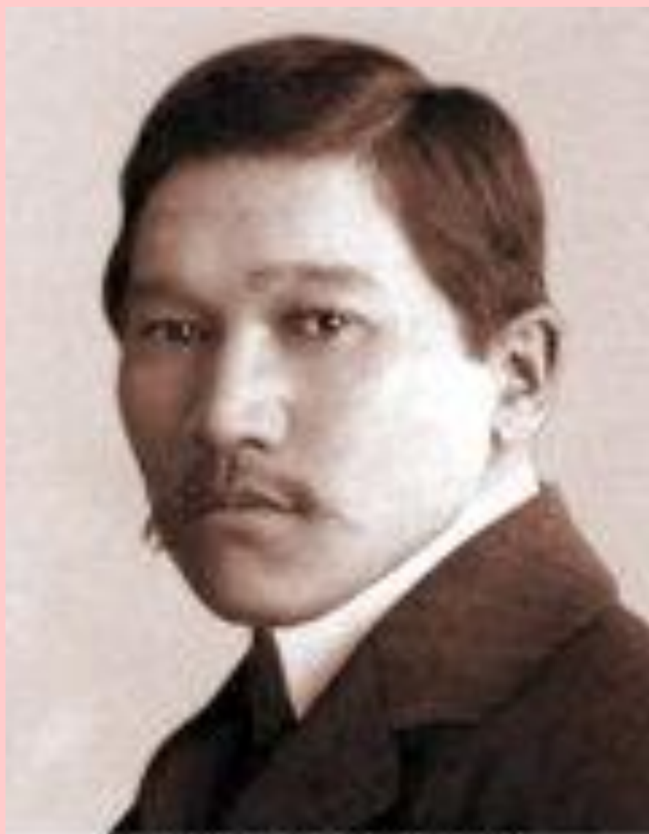
МИРЖАҚЫН ДОЛАТОВ (1885–1935)