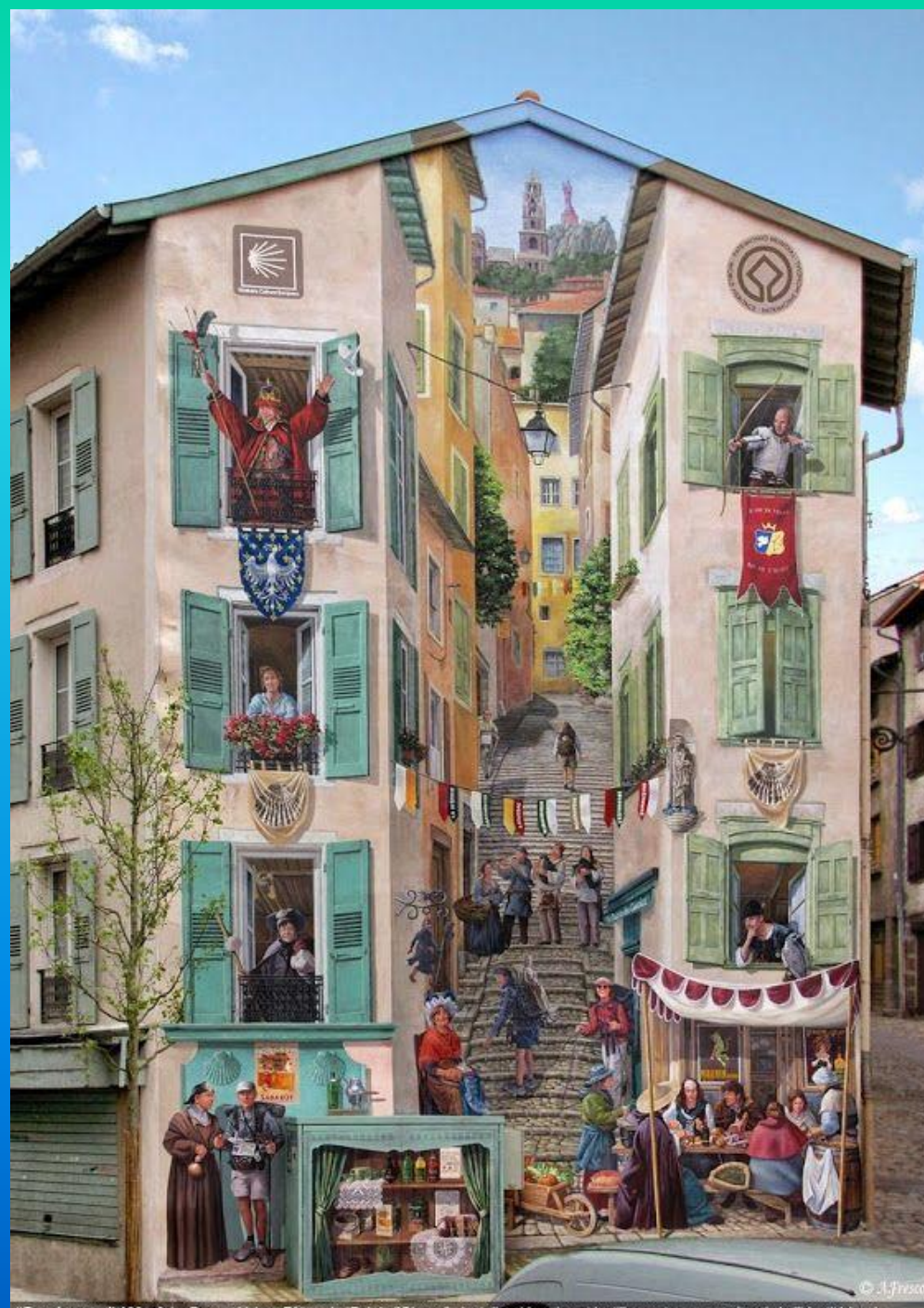
"Renaissance" 100 m 3 , Le Puy-en-Velay. Fêtes du "Roi de l'Oiseau", dentelles, Verveine et lentilles vertes, un condensé de l'identité locale...