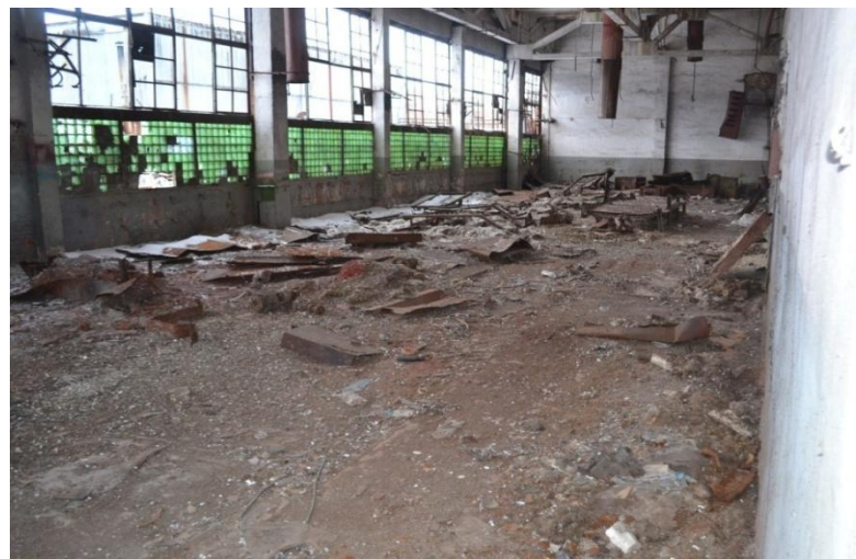
ЦЕХ, ФОТО 1, ПЛОЩАДЬ: 680 м 2