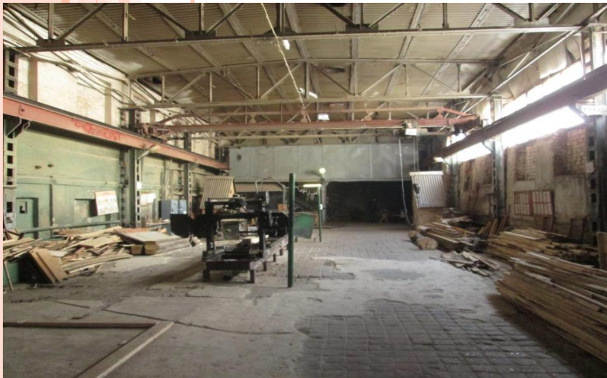
Цех, площадь: 250 м 2