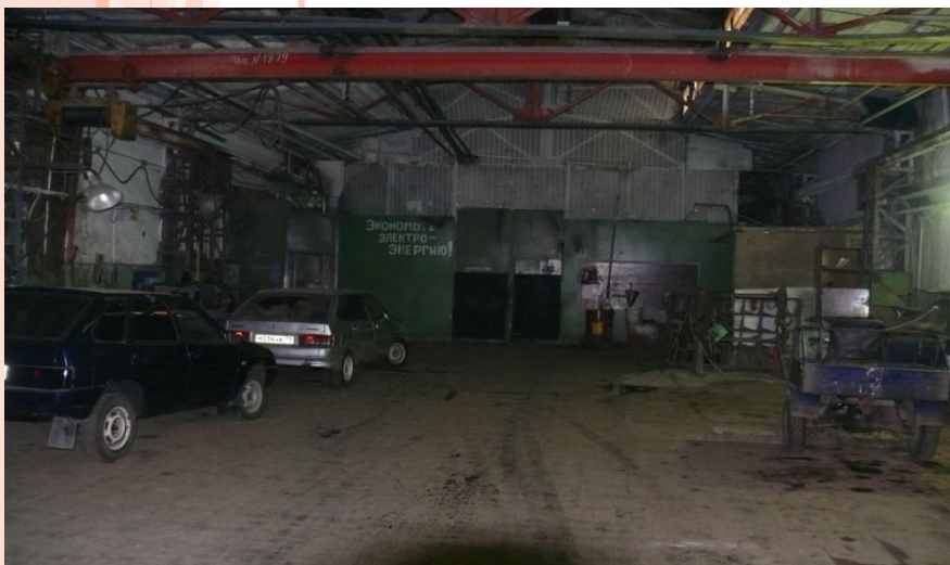
Участок, площадь: 1410 м 2