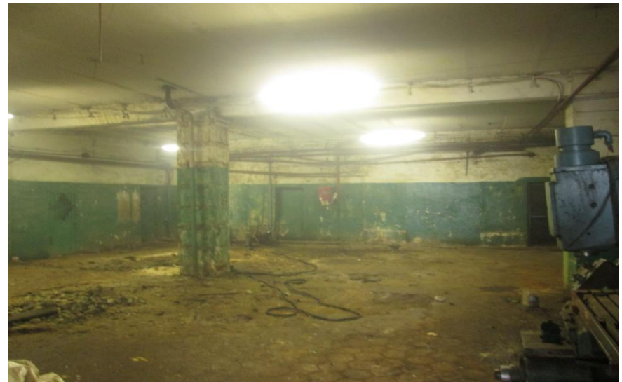
Цех, площадь: 225 м 2