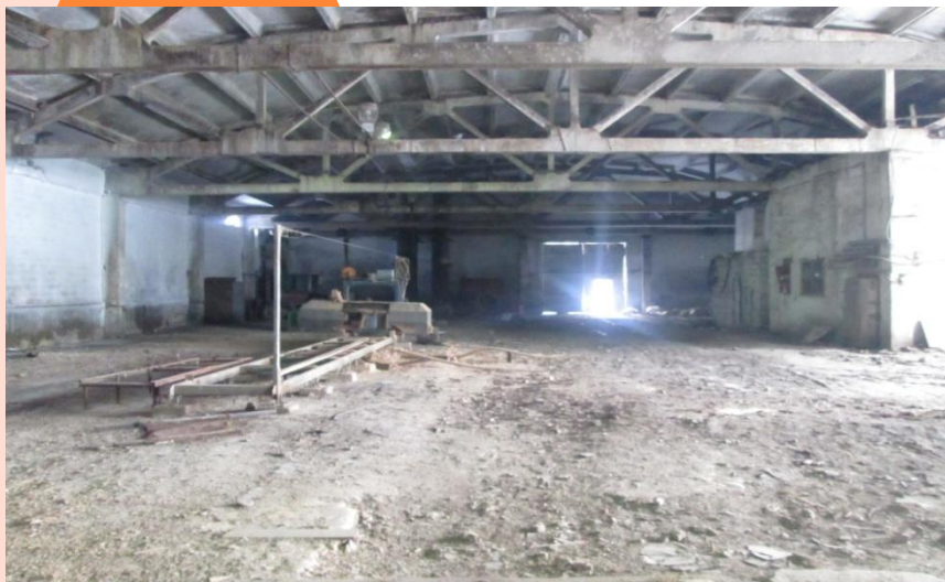
Цех, фото 1, площадь: 880 м 2