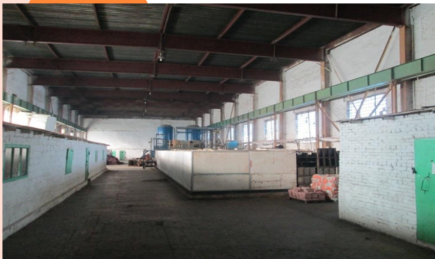
Цех, площадь: 1560 м 2