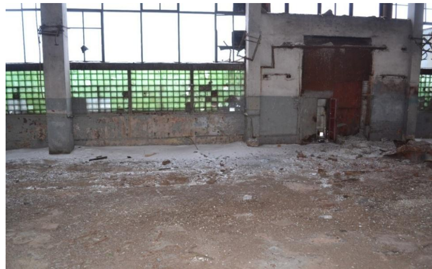
ЦЕХ, ФОТО 3, ПЛОЩАДЬ: 680 м 2