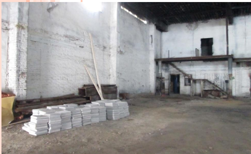
Цех, фото 1, площадь: 864 м 2