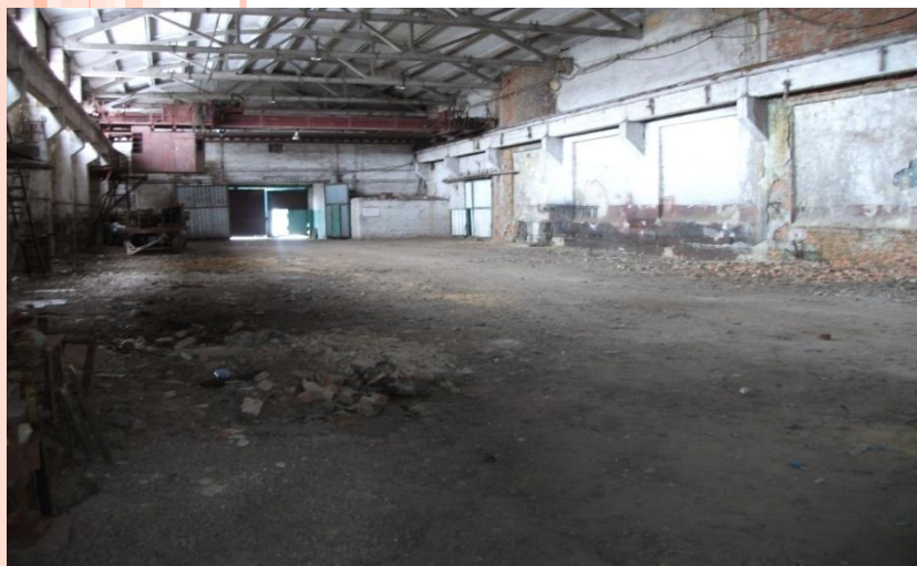
Цех 1-й пролет, фото 1, площадь: 3132 м 2