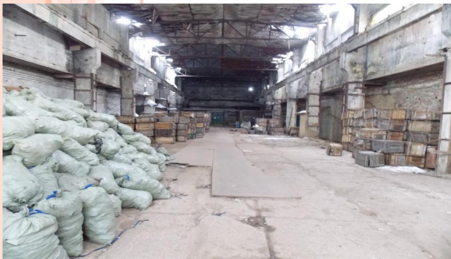
Цех, площадь: 770 м 2