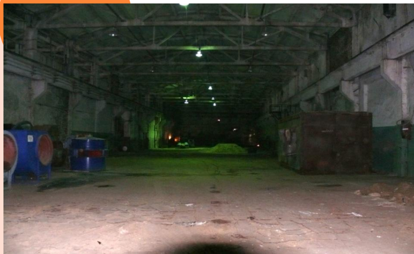
Цех 3-й пролет, фото 2, площадь: 3132 м 2