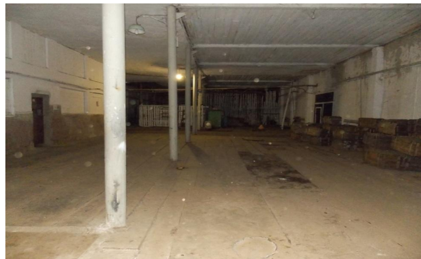
Цех, площадь: 600 м 2