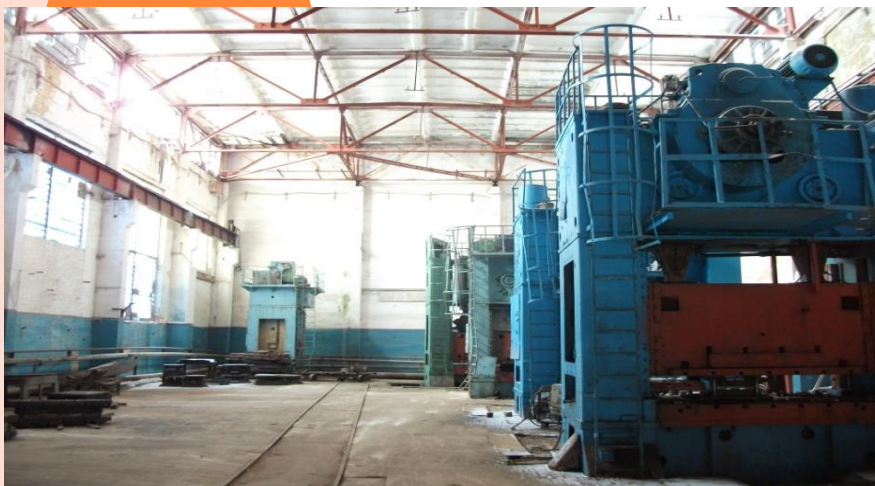
Цех, фото 1, площадь: 639 м 2