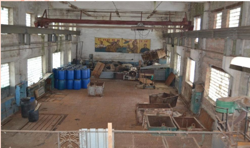
ЦЕХ, ПЛОЩАДЬ: 447 м 2