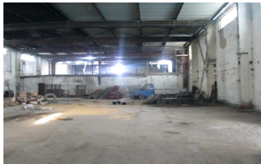
Цех, фото 2, площадь: 864 м 2