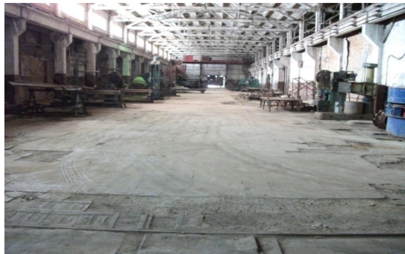
Цех 2-й пролет, фото 2, площадь: 3132 м 2