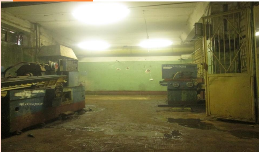
Цех, площадь: 50 м 2