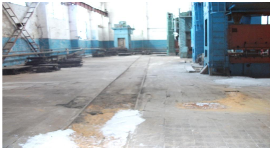
Цех, фото 2, площадь: 639 м 2