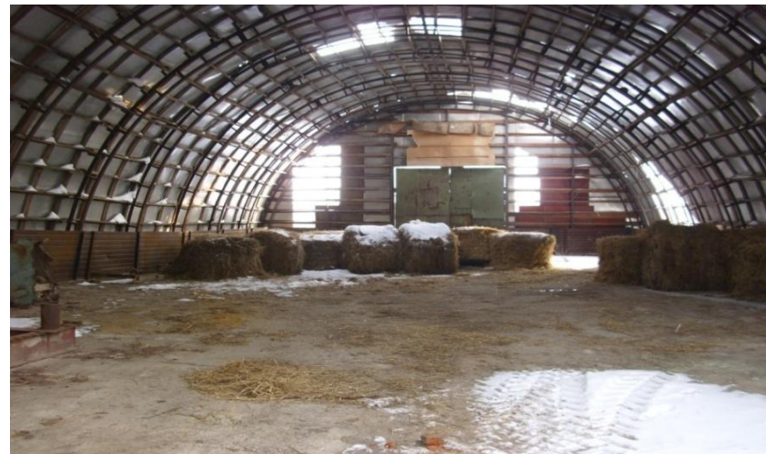
Ангар, площадь: 470,4 м 2