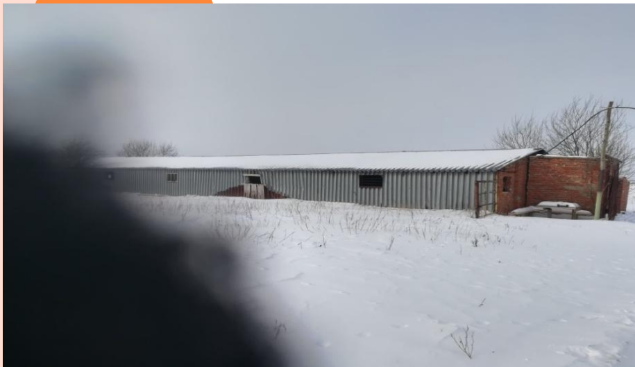
Коровник, фото 1, площадь: 576,0 м 2