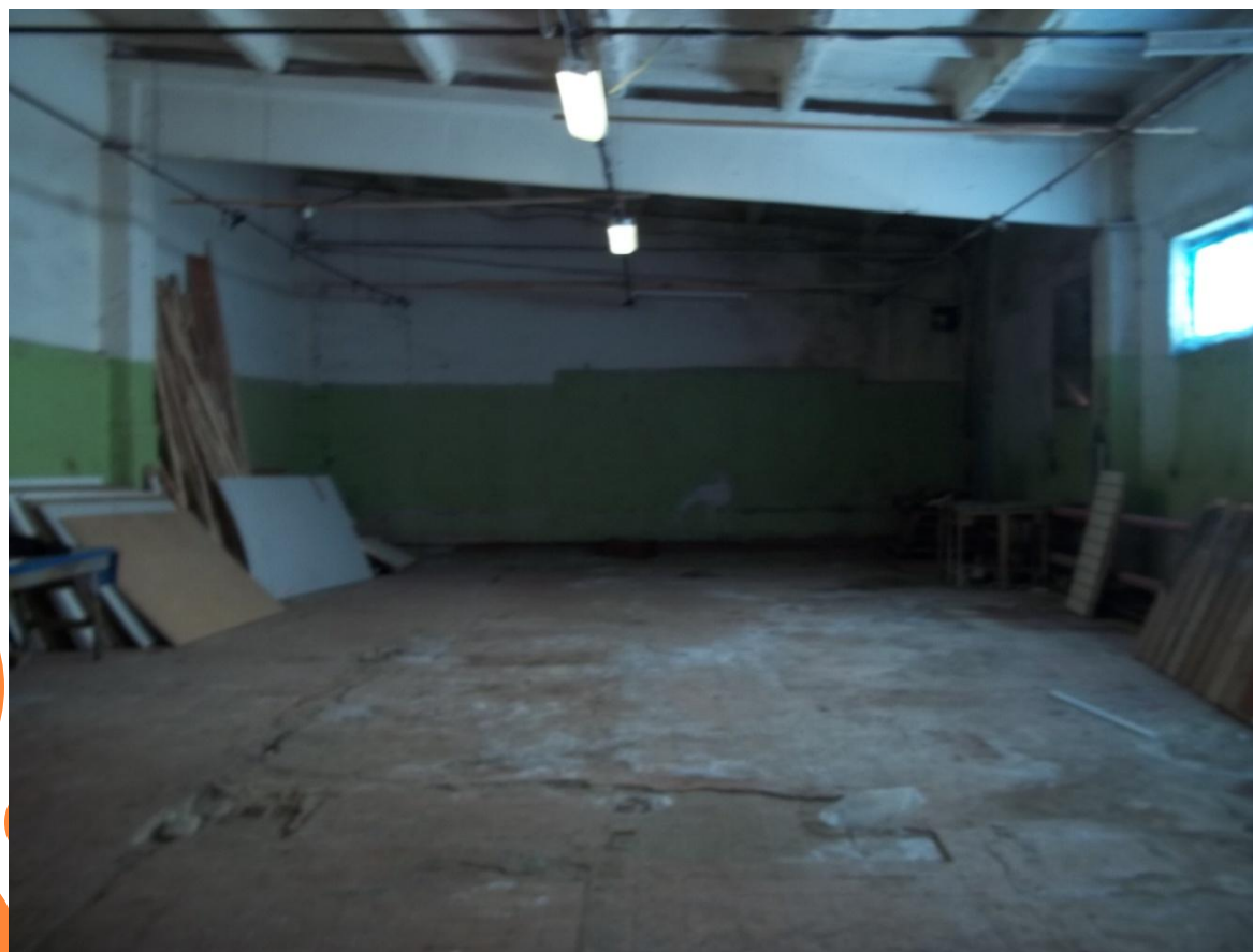
Цех, площадь 134 м 2