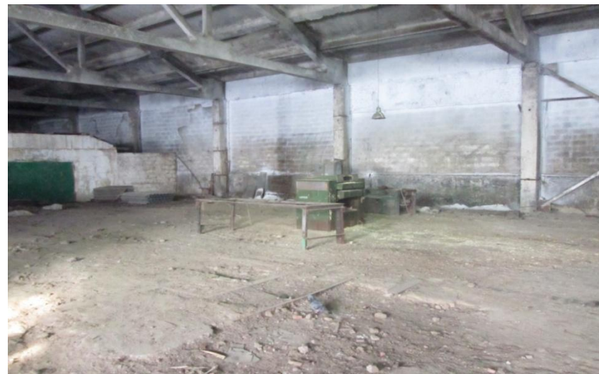
Цех, фото 2, площадь: 880 м 2