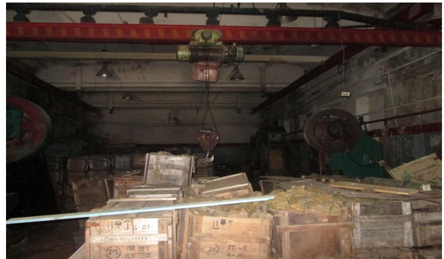
Цех, площадь: 200 м 2