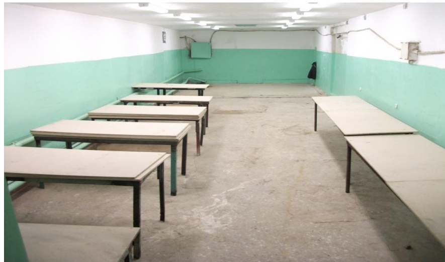
Участок, площадь: 90 м 2