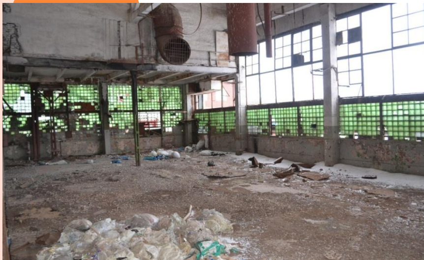
ЦЕХ, ФОТО 2, ПЛОЩАДЬ: 680 м 2