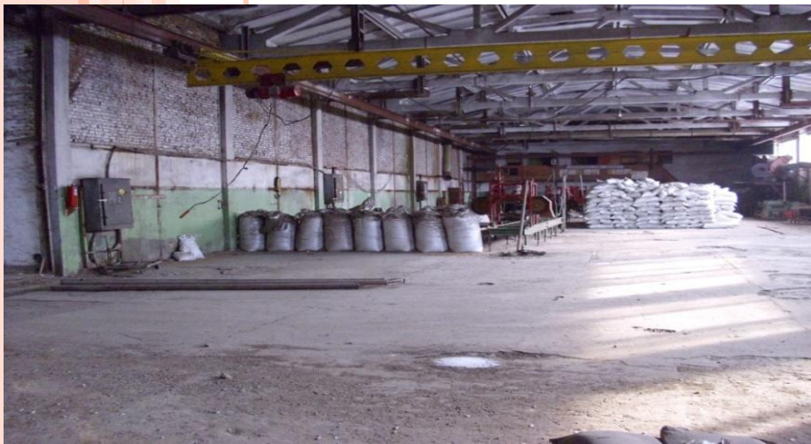
Цех, площадь: 1070,0 м 2