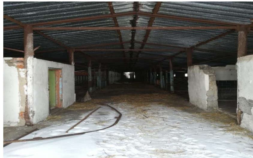
Коровник, фото 2, площадь: 576,0 м 2