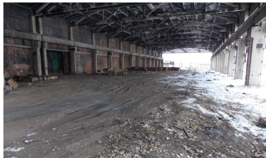
Цех, площадь: 2160 м 2