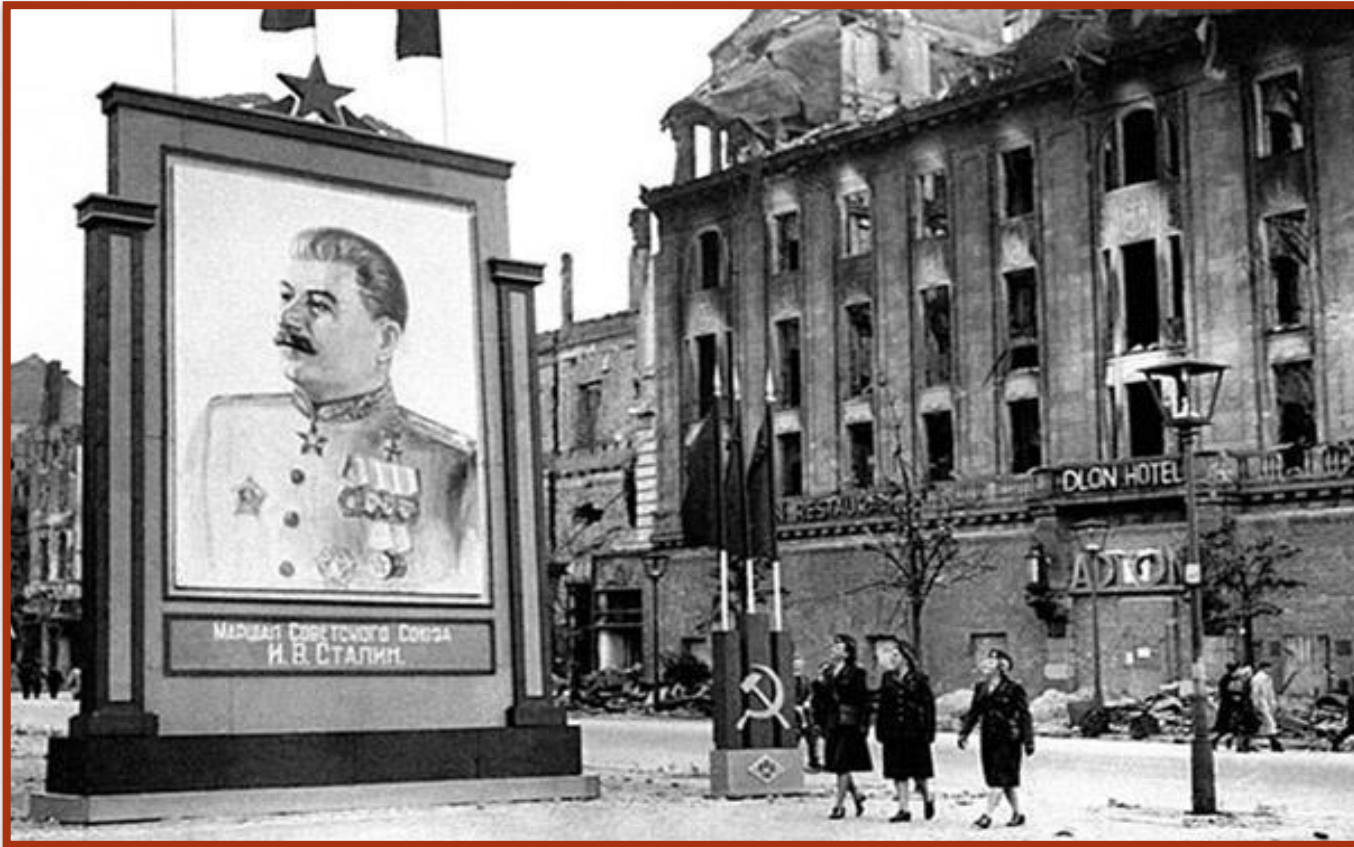
Портрет Иосифа Сталина на бульваре Унтерден-Линден в Берлине, 1945 г.