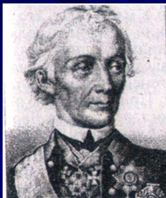
Суворов Александр Васильевич (1730-1800)

Выдающийся русский полководец, генерал-фельдмаршал австрийской и генералиссимус русской армии, князь Италийский, граф Рымникский, граф Священной Римской империи. Участник многих военных походов и компаний.