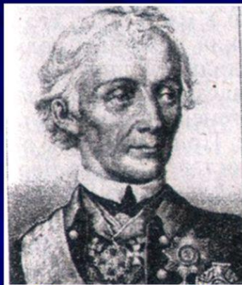
Суворов Александр Васильевич (1730-1800)

Выдающийся русский полководец, генерал-фельдмаршал австрийской и генералиссимус русской армии, князь Италийский, граф Рымникский, граф Священной Римской империи. Участник многих военных походов и компаний.