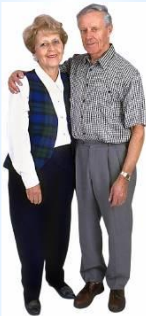
Жили-были дедушка и бабушка