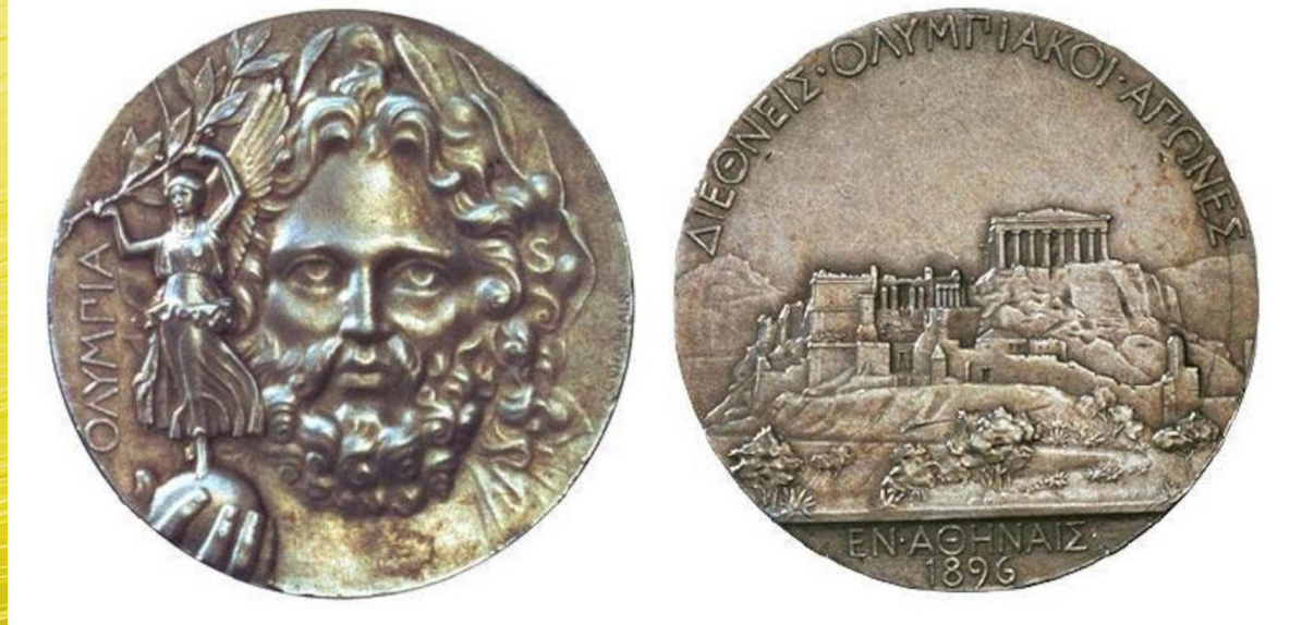
Олимпийские медали 1896 года

-Победителям спортивных соревнований впервые вручали медали на I Олимпийских играх, которые проводились в 1896 году в Греции. Спортсменов награждали золотыми медалями за 1 место и серебряными медалями за 2 место. Бронзовые медали за 3 место стали вручаться только с 1908 года.