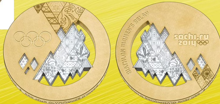
Олимпийские медали 2014 года