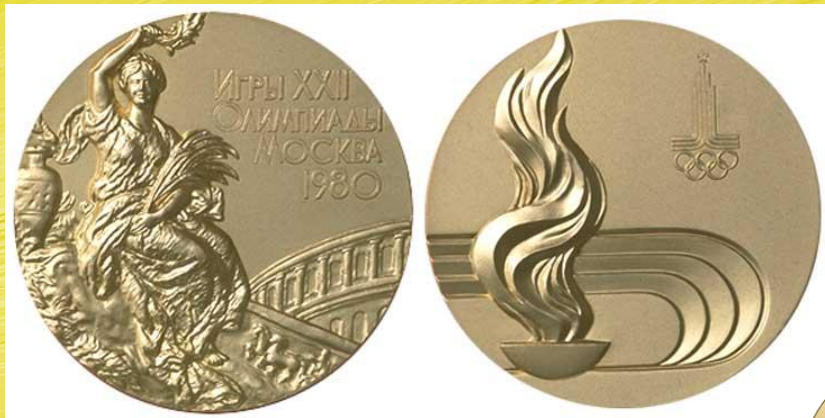
Олимпийские медали 1980 года

Для каждой Олимпийских игр создаются свои медали по эскизам художников, победивших в специально проводимых конкурсах.