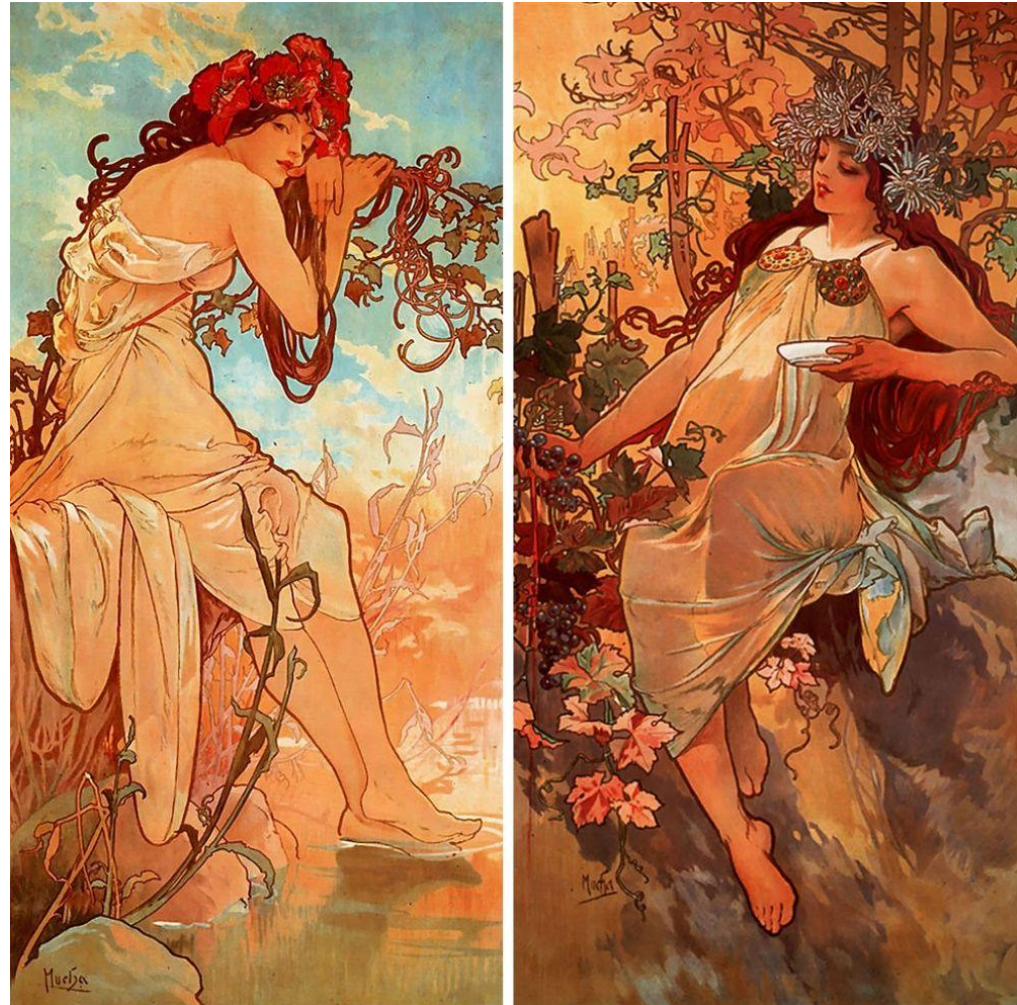
Автор - Альфонс Муха