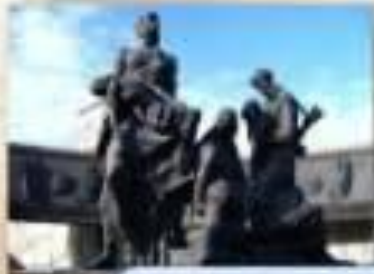
«Героическим защитникам города»