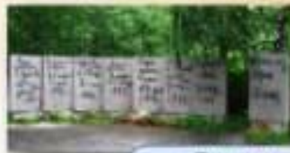
«Дневник Тани Савичевой»