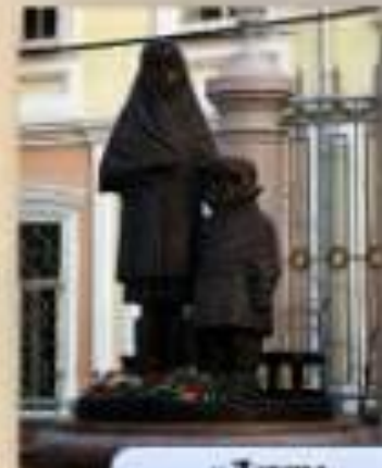
«Детям блокадного Ленинграда»