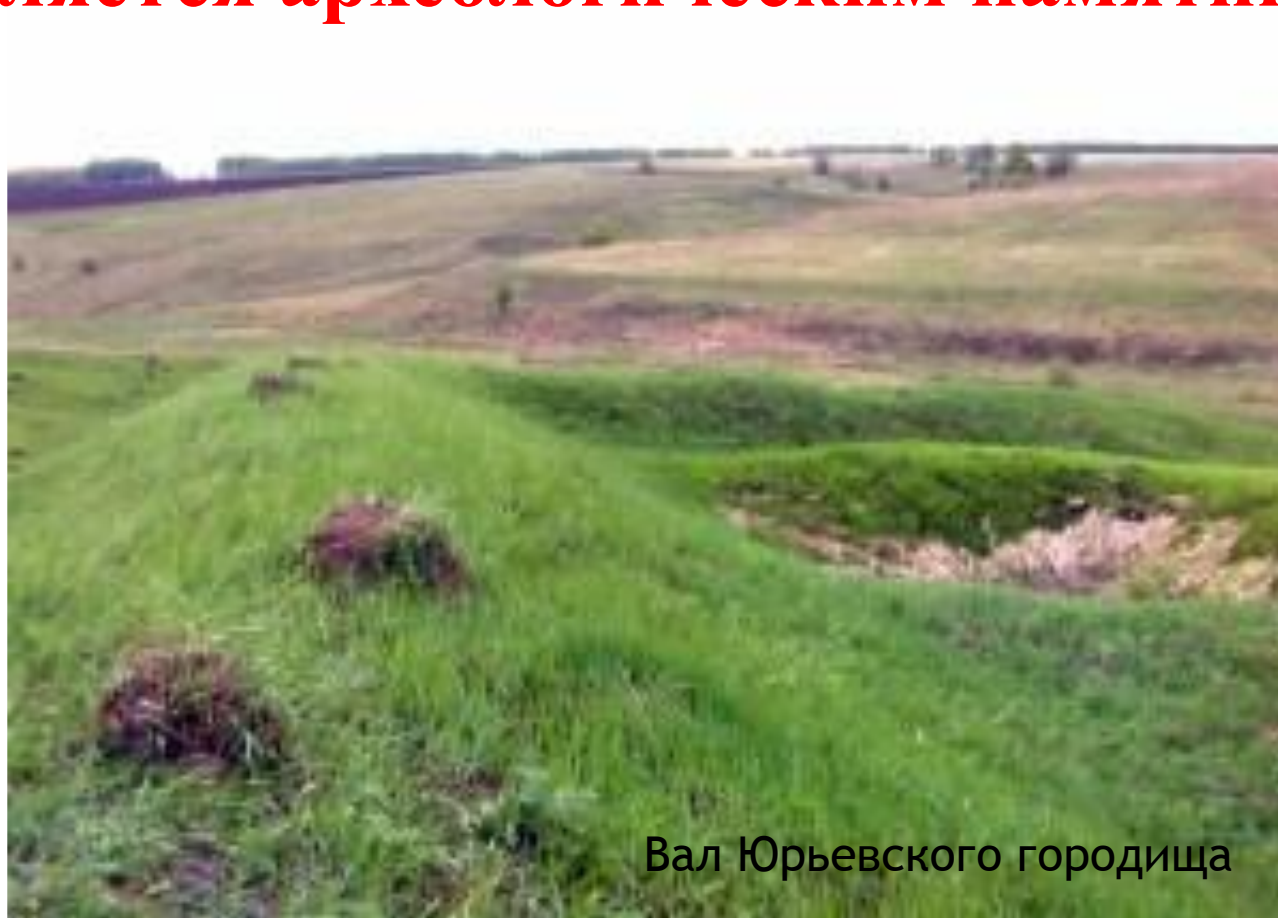
Вал Юрьевского городища