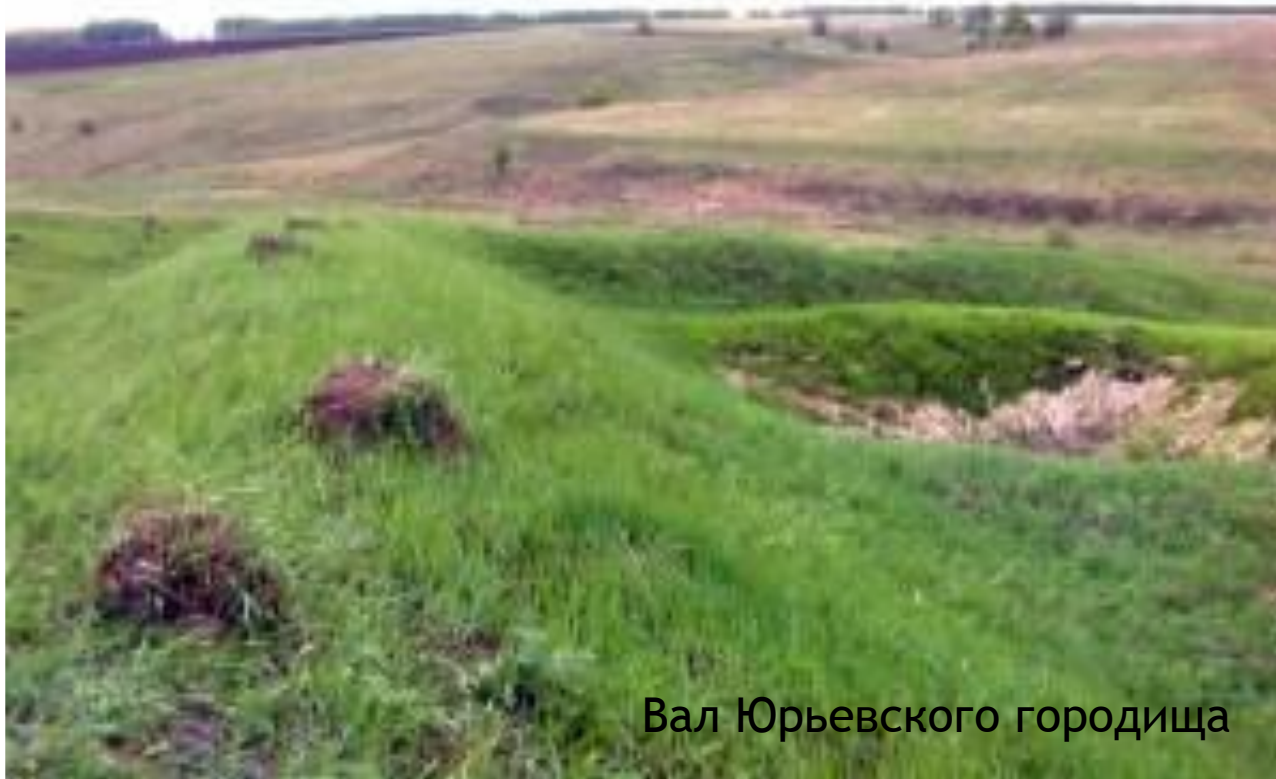
Вал Юрьевского городища