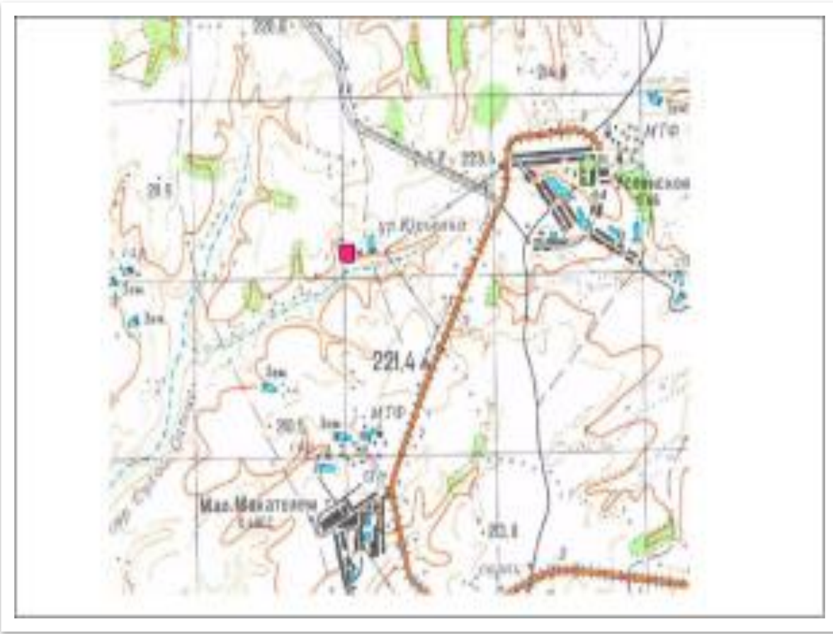
Местоположение Юрьевского городища обозначено цветным квадратиком

В 1970-х годах археологом В.Н. Мартьяновым были обследованы несколько городищ в южных районах Нижегородской области. Они (Понетаевское, Хозинское, Федоровское городища) были отнесены им к X-XII векам. Эти городища отличаются сравнительно небольшими размерами, удаленностью от водных путей, небольшая мощность культурного слоя, свидетельствующая о непродолжительности обитания на них людей. Мартьянов связал городища с упомянутыми в летописи мордовскими твердями и с Пургасовой волостью. Пургасовой волостью Мартьянов считал территорию с севера и востока ограничиваемую рекой Тешей, с юга Алатырем и Мокшей, а с запада - Окой. Именно в этом районе сосредоточены средневековые мордовские городища.