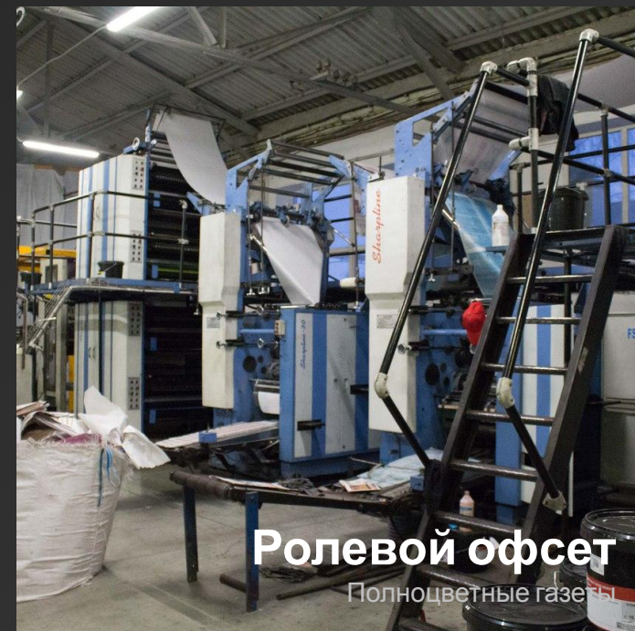
Ролевой офсет Полноцветные газеты