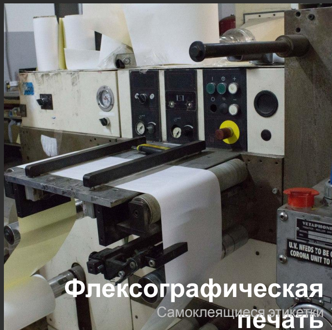
Флексографическая печать Самоклеящиеся этикетки