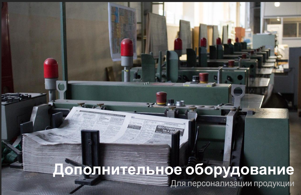
Дополнительное оборудование Для персонализации продукции