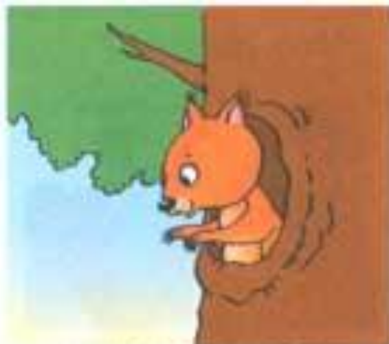
ЧЬЕ ЭТО ДУПЛО? (БЕЛИЧЬЕ)