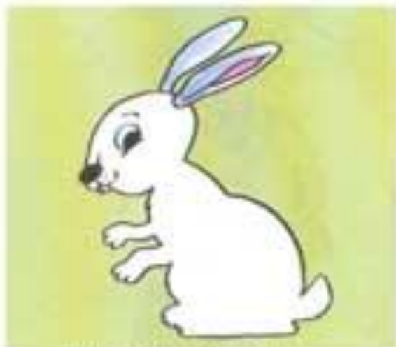
ЧЬИ ЭТО УШИ? (ЗАЯЧЬИ)