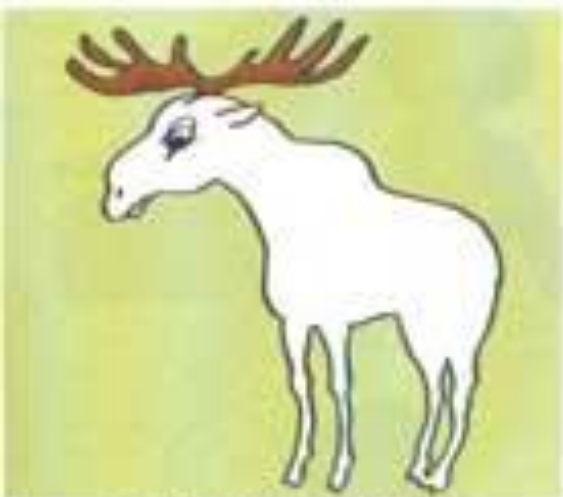
ЧЬИ ЭТО РОГА? (ЛОСИНЫЕ)