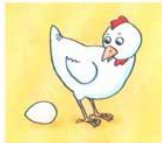
ЧЬЕ ЭТО ЯЙЦО? (КУРИНОЕ)