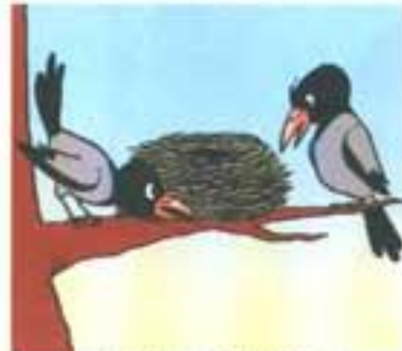
ЧЬЕ ЭТО ГНЕЗДО? (ВОРОНЬЕ)