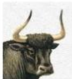
Бычья Бычачья бычья