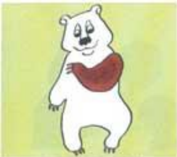
ЧЬЯ ЭТО ЛАПА? (МЕДВЕЖЬЯ)