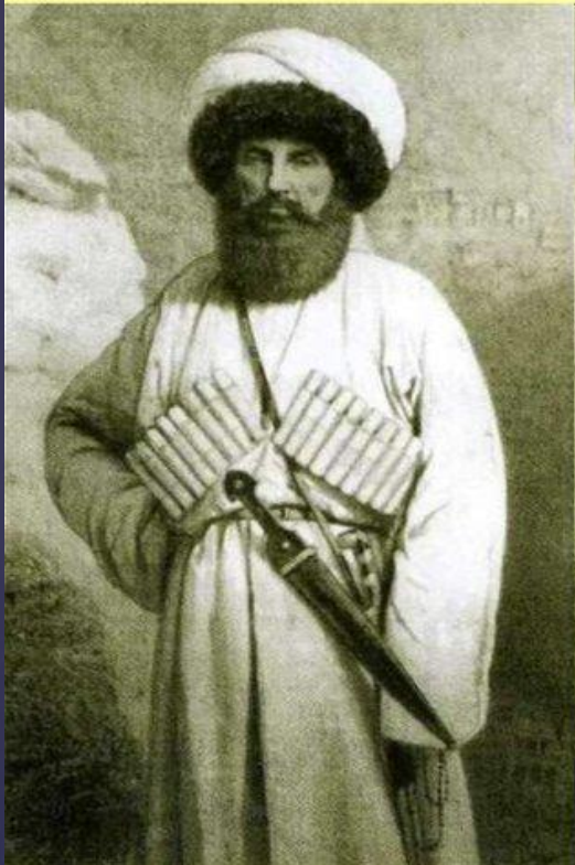
Шамиль, имам Дагестана и Чечни в 1834–1859 гг.

В 1834 г. был избран третий имам – Шамиль.