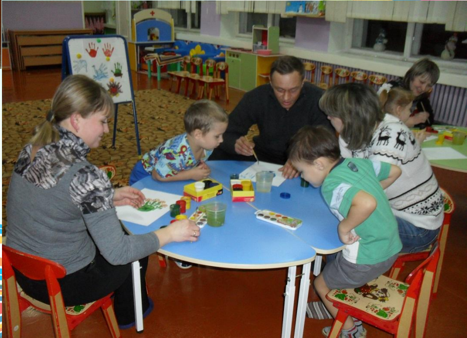
Родительский клуб «Заботливые родители»