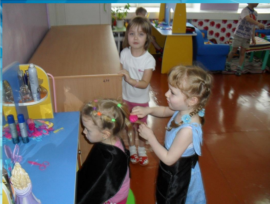
Сюжетно-ролевая игра «Парикмахерская»