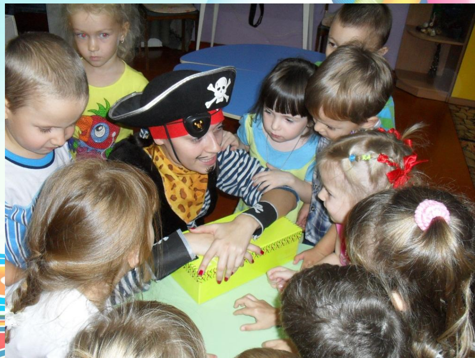
Веселое празднование дней рождений ребят.