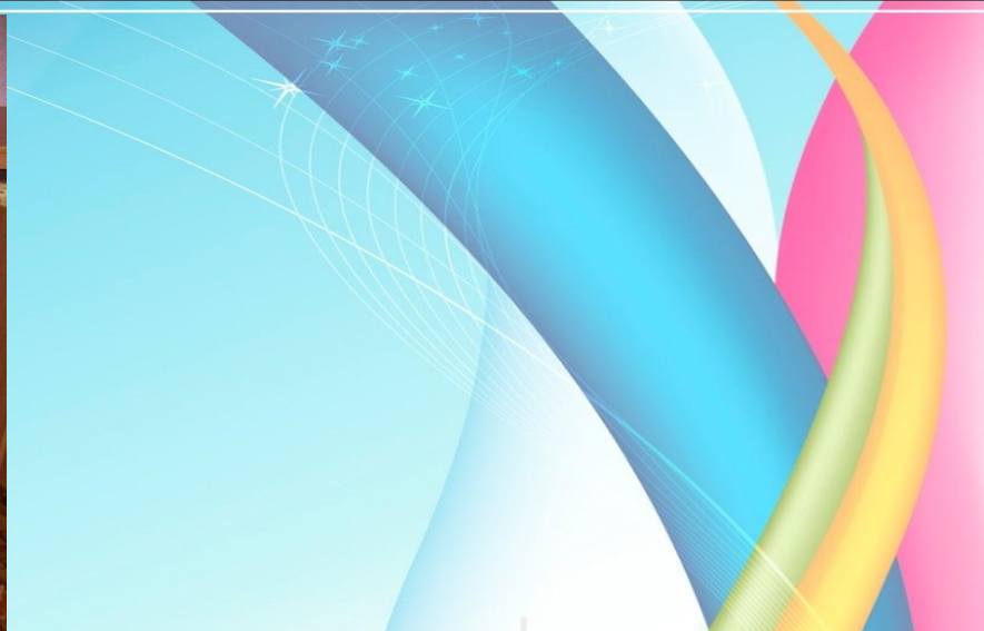
Конкурс "Чистые ладошки"