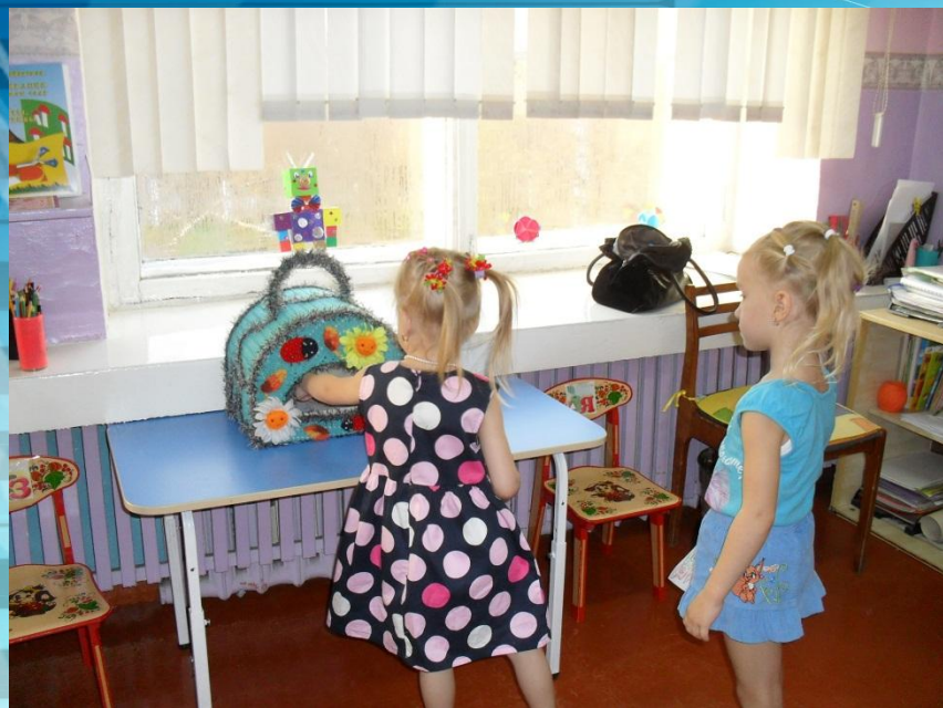
Конкурс «Зеленый кошелек» (изготовление эко-контейнера)