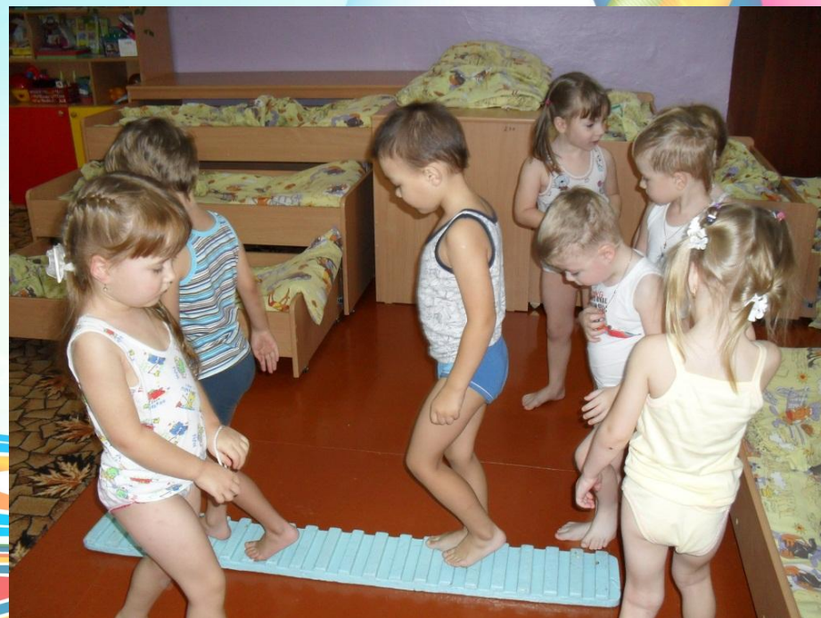
Подъем после сна. Профилактика плоскостопия.