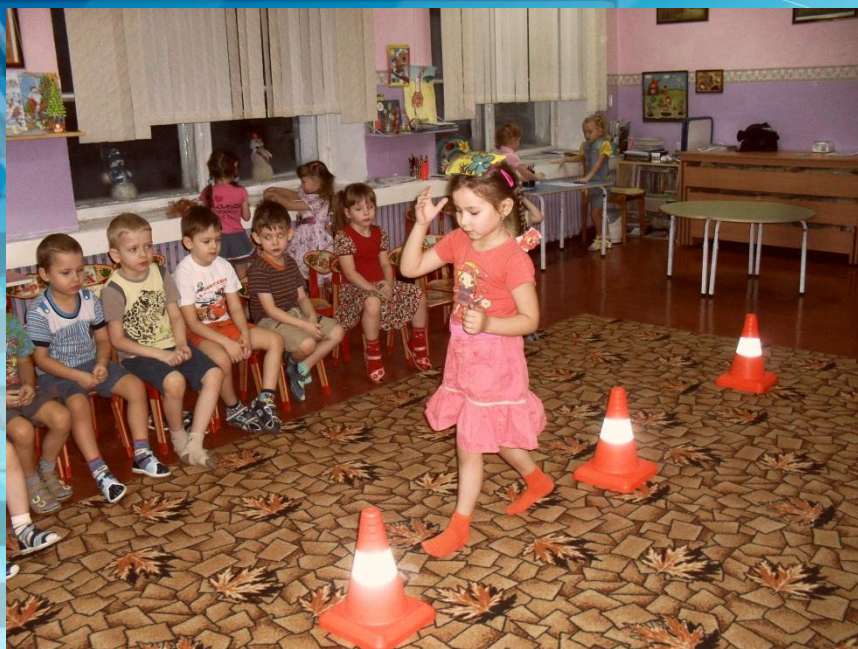
Спортивный досуг в рамках педагогического проекта «Логический поезд»