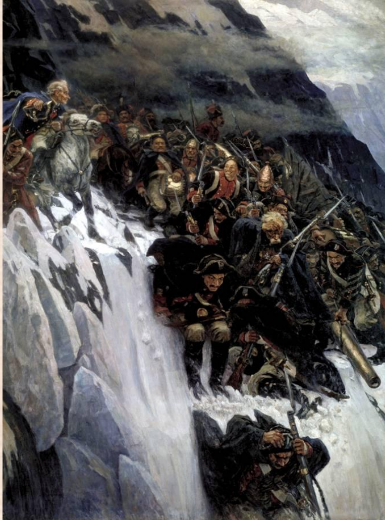
В.И.Суриков «Переход Суворова через Альпы»