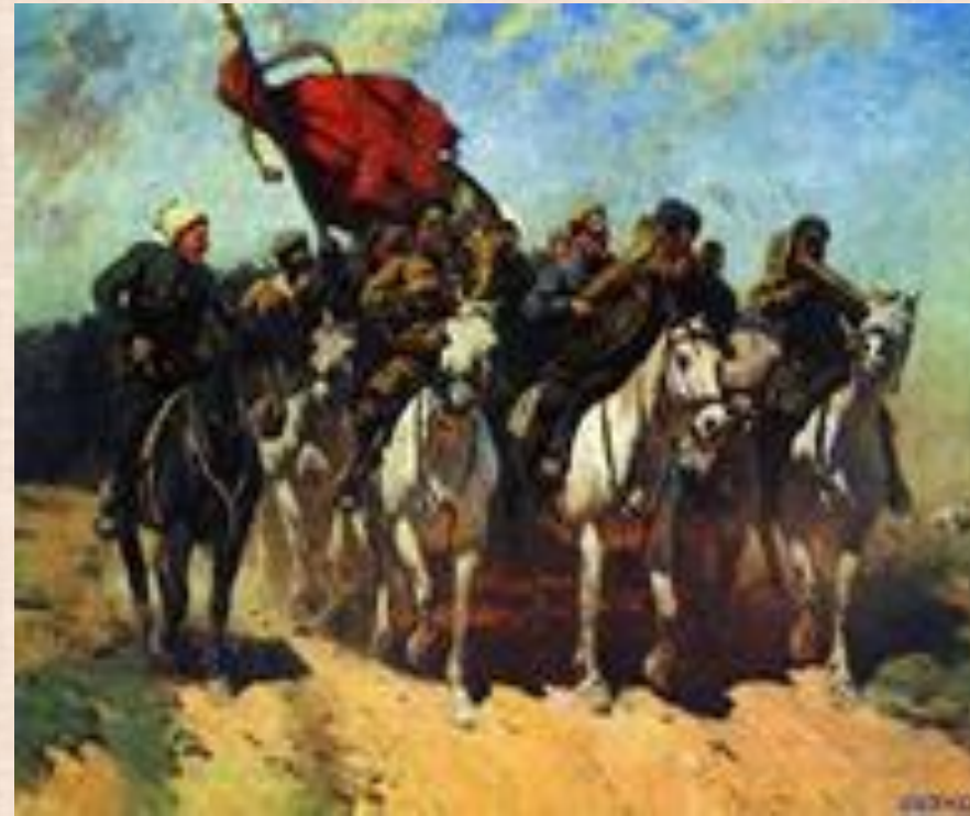
М.Греков «Трубачи Первой Конной»