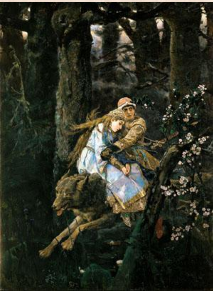
В. Васнецов «Иван-царевич на сером волке»