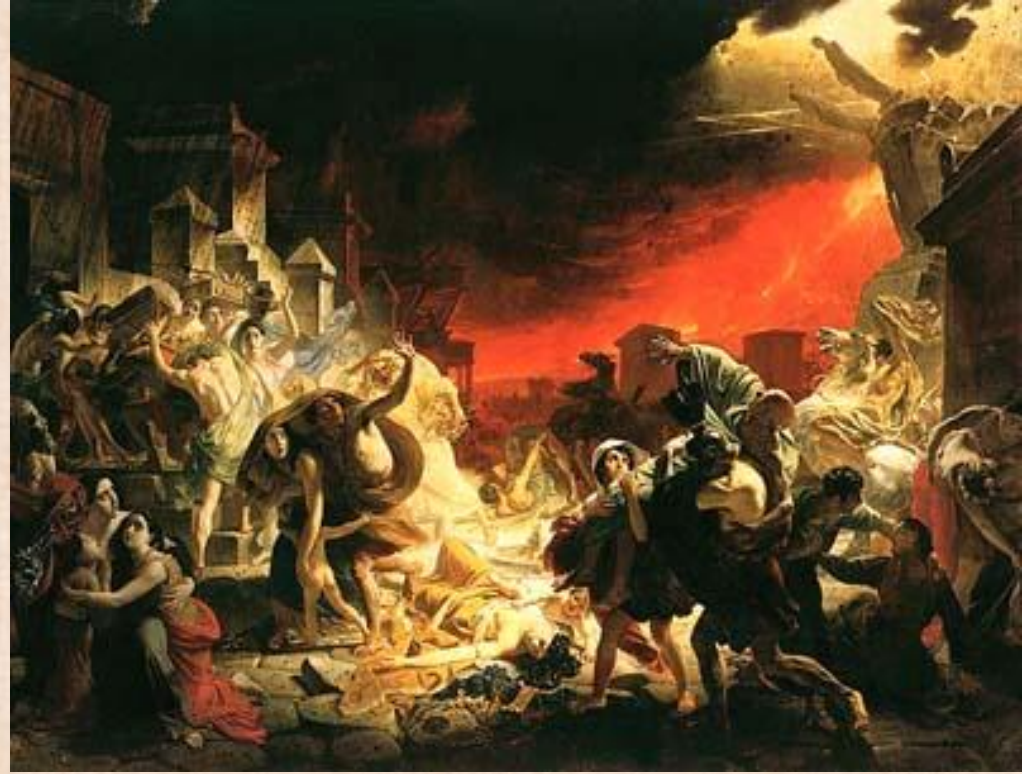
К.Брюллов «Последний день Помпеи»