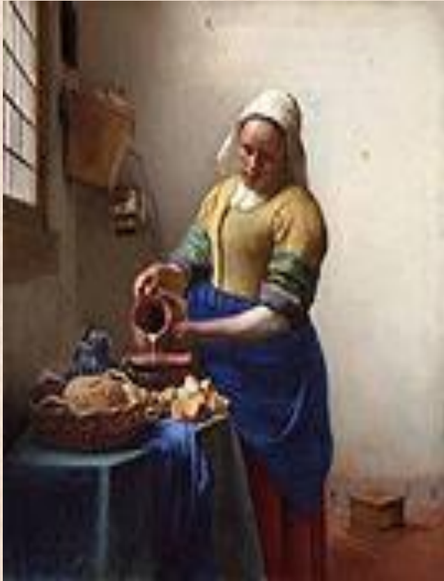
Я. Вермеер «Служанка с кувшином»

Бытовой жанр – жанр изобразительного искусства, посвященный повседневной жизни людей