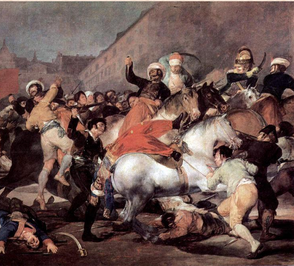
Ф.Гойя «Восстание 2 мая 1808г в Мадриде»

Битвенный жанр (от франц. bataille – битва) – посвящен темам войн, битв, походов и эпизодов военной жизни. Он может быть составной частью исторического и мифологического жанра, а также изображать современную жизнь армии и флота.