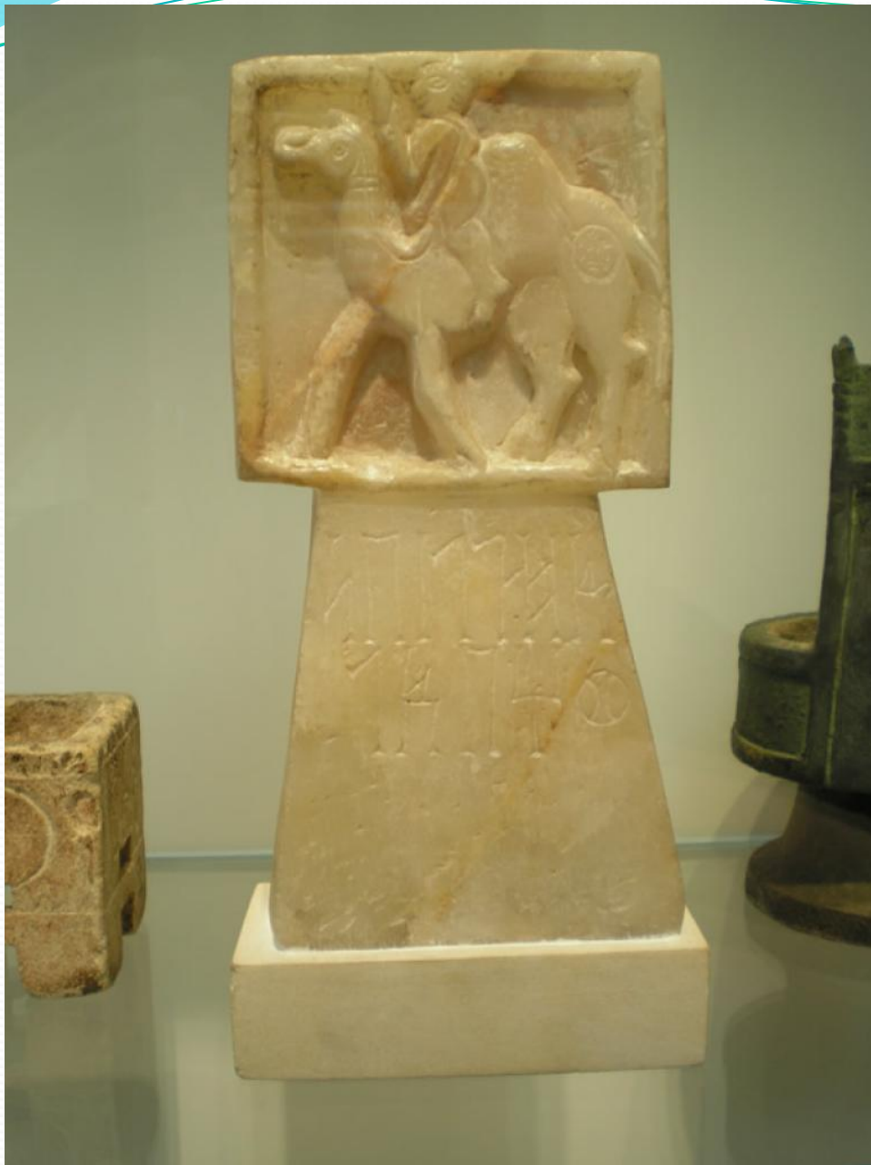
Горелка для ладана. Около III век н.э. Найдена в Шабве.