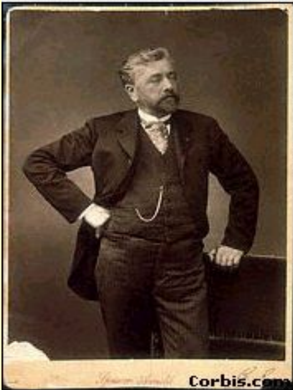
Alexandre Gustave Eiffel (1832 – 1923)