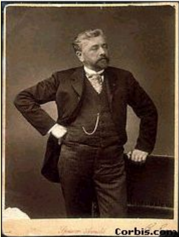
Alexandre Gustave Eiffel (1832 – 1923)